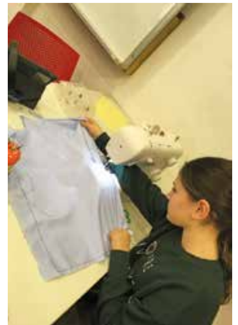
Hem après a fer servir la màquina de cosir!