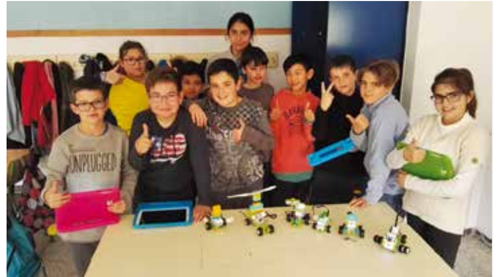
© Construïm diferents models de robots.