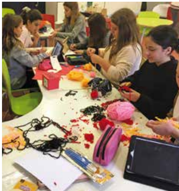
© Compartint espais: fem pompons, busquem manualitats a pinterest...