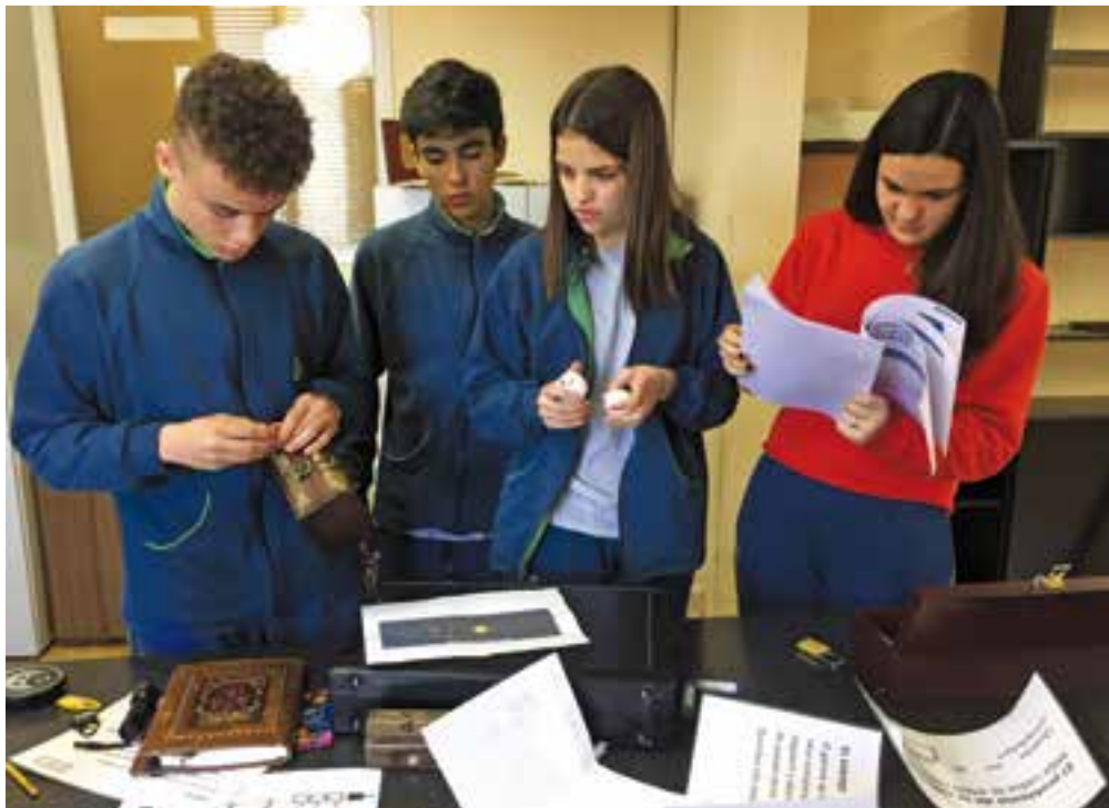
© Alumnes de 4t d'ESO resolent un escape portàtil

Un cop estigui tot preparat, obrirem el nostre 'escape' al poble, i serà aleshores quan tothom podrà gaudir de l'aventura de resoldre enigmes i proves que ens endinsaran en una història interessant sobre l'escola, la família Tolrà i un misteri a resoldre. Esteu tots i totes convidats a entrar al nostre escape "El misteri dels Tolrà". Properament en rebreu notícies a través de l'actual i les xarxes socials. En podreu sortir?