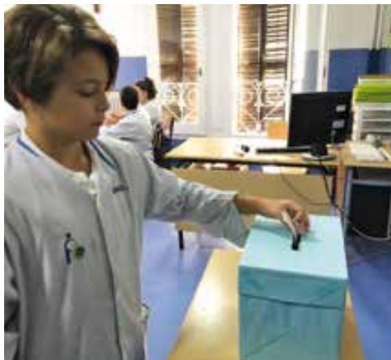
Votacions de l'equip directiu.