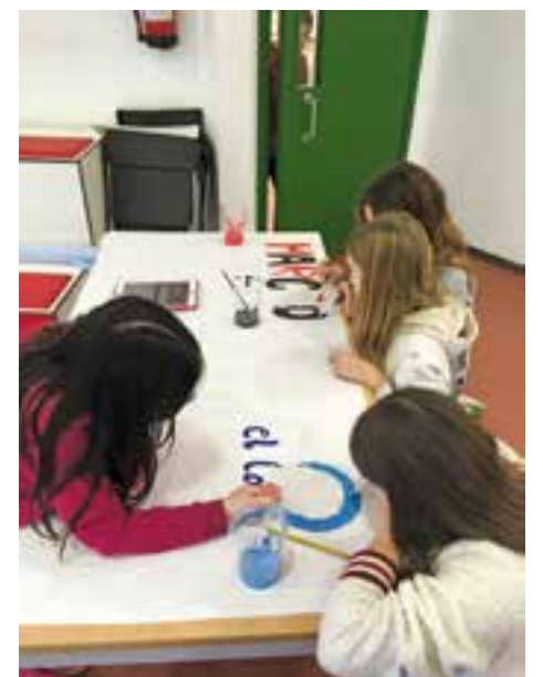
© Ajudem a decorar l'escola.