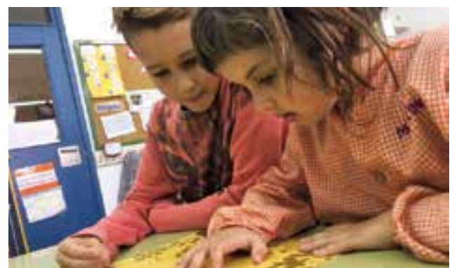
© Un padrí ajuda a llegir a la seva fillola.

Compartim, ens estimem, ens ajudem i aprenem plegats. Ens agrada molt aquest projecte!