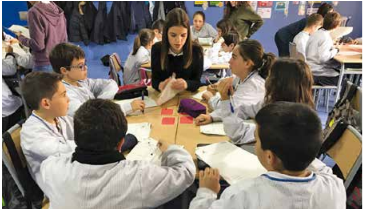
© Taller de logotips dels alumnes de 4t ESO.

Gràcies a aquest projecte, hem pogut realitzar activitats que ens han permès entendre què significa muntar una empresa, que vol dir ser emprenedor o emprenedora, fer vivencial tot aquest aprenentatge i participar d'un projecte, no només escolar, emprenedor i de país, sinó que ens ha permès apropar-nos al nostre entorn, al nostre poble, a la gent i als serveis i institucions, i poder donar a conèixer allò que estem treballant i aprenent amb tanta il·lusió i passió.