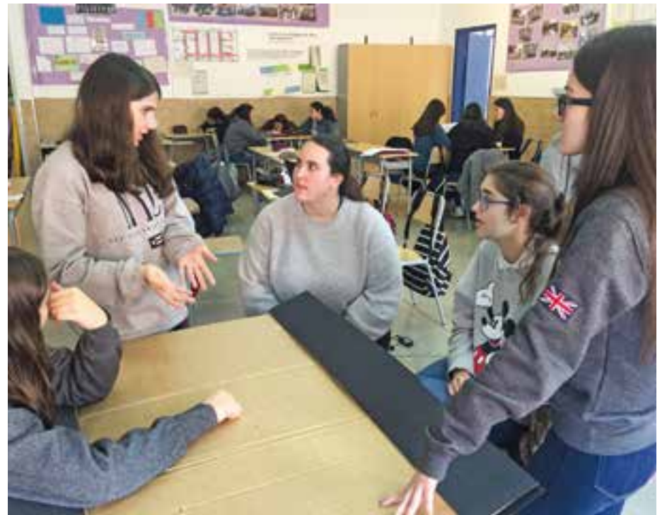
© La Bea escoltant les propostes.