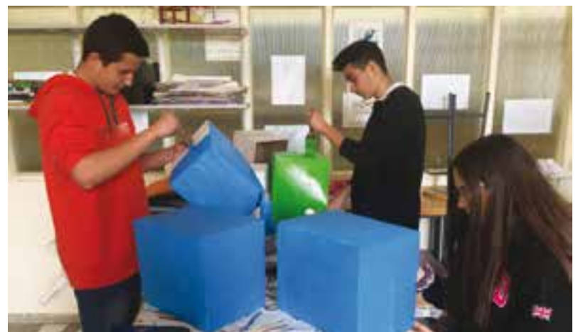
© Alumnes creant material i decoracions.