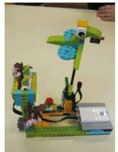
© Imaginació al servei de la tecnologia