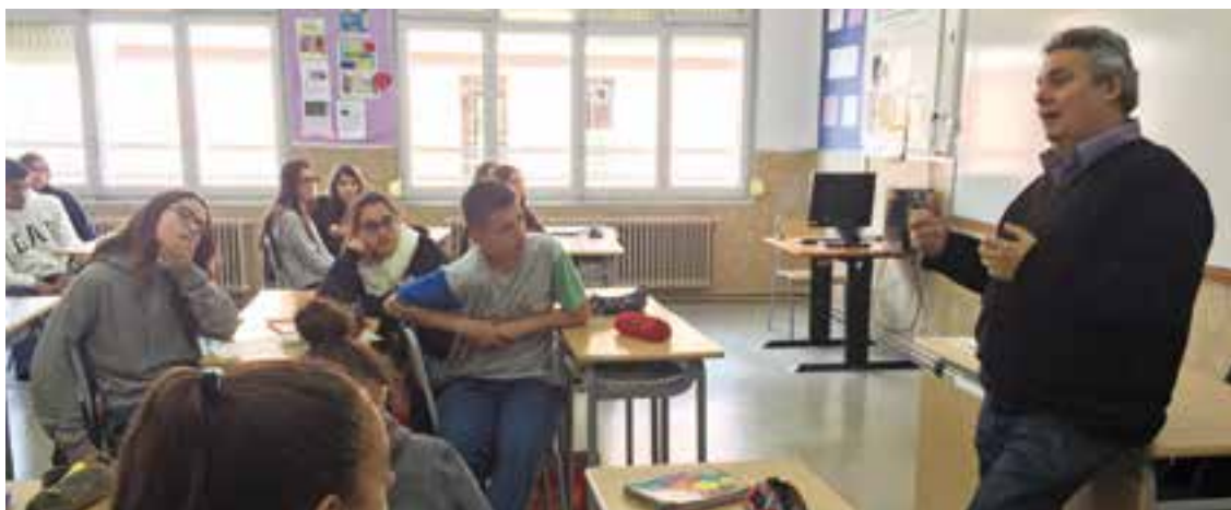
© El Carles explicant com ha creat l'escape.