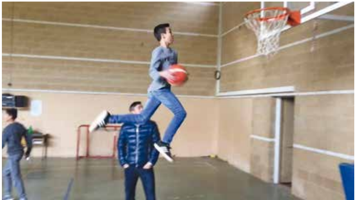
Fem concursos d'esmaixades amb acrobàcies.

És una estona divertida, diferent d'Educació Física, ideal per aquells alumnes als que ens apassiona l'esport.