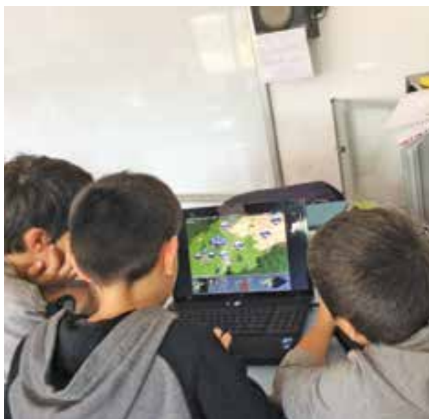
Alumnes jugant a Age of Empires