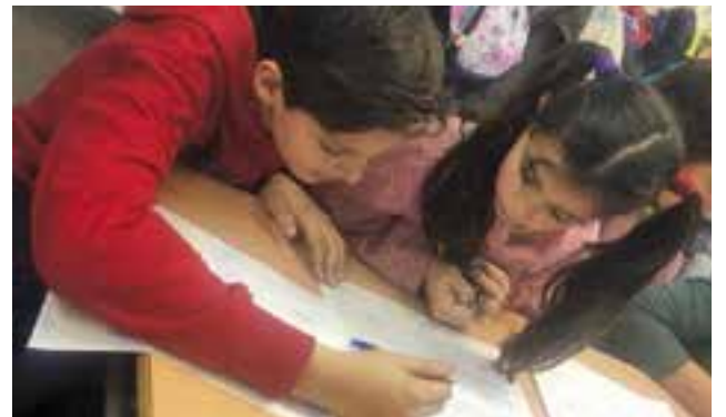
© Signem el contracte d'apadrinament

Des que hem començat el curs hem fet moltes activitats conjuntes. Els nens i nenes de primer us expliquem la nostra experiència com a fillols i filloles.