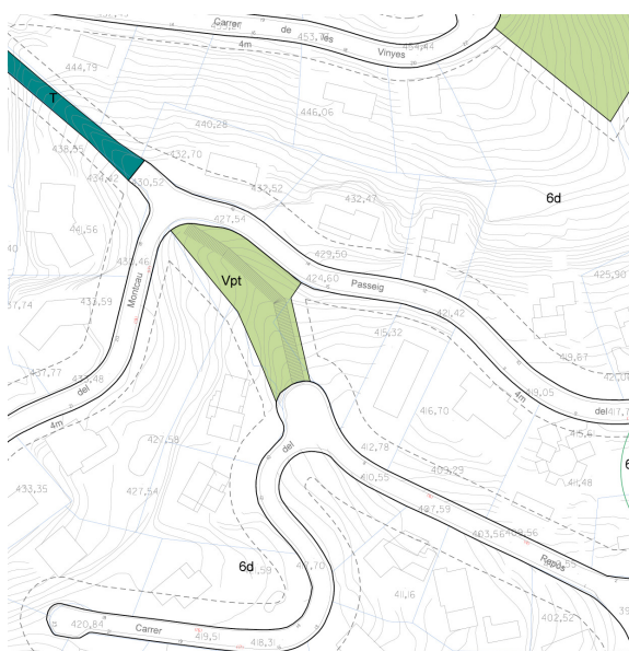
Plànol ordenació-b2. Text Refós POUM

Ajust del límits de la parcel·la del carrer Passeig Montcau, 15, amb la zona verda que limita.