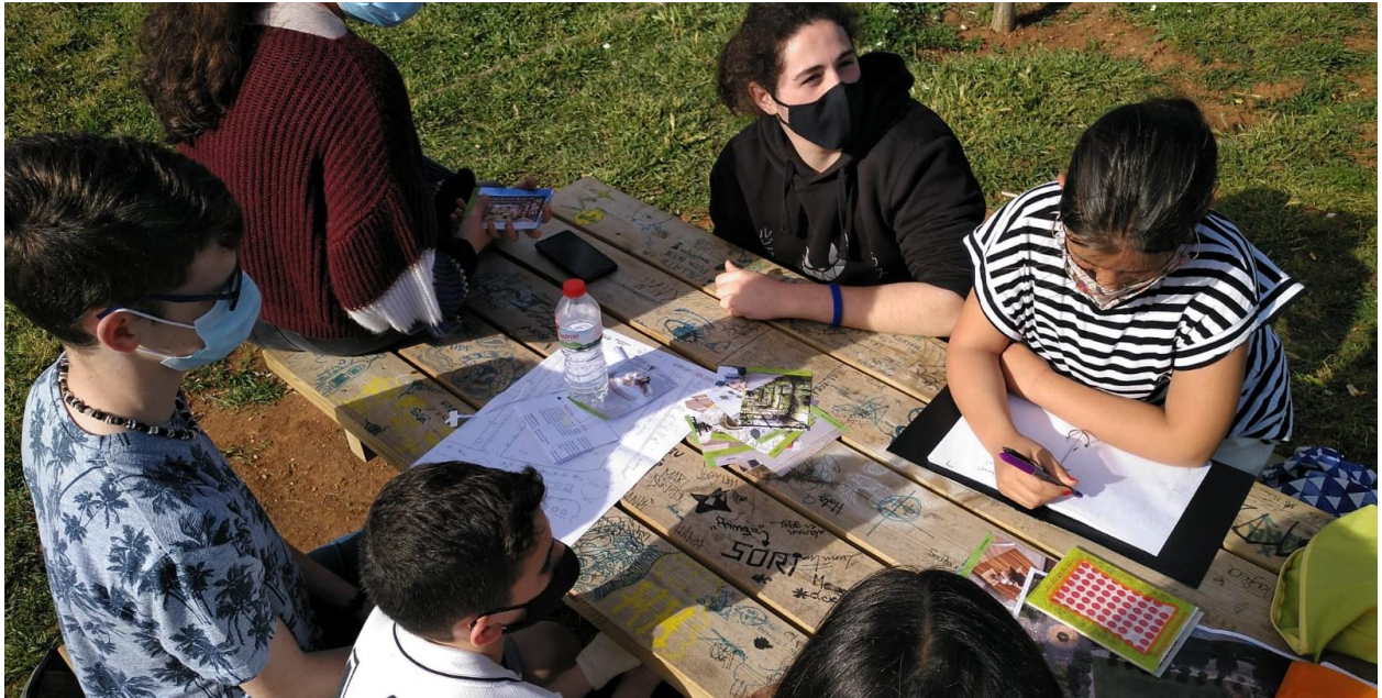
Imatge 3: Triant les característiques del mobiliari urbà

S'ha jugat amb una sèrie d'imatges per saber quins són els gustos dels Consellers i les Conselleres i anar perfilant quines són les característiques que voldrien que tingués el seu mobiliari urbà.