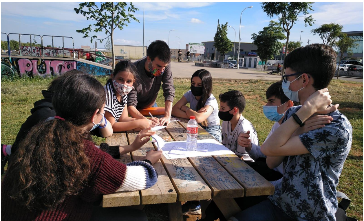
Imatge 1: Consellers i Conselleres d'Adolescents de Castellar fent treball de Camp a l'SkatePark

Seguidament, abans d'acomiarar-nos, hem parlat de com es vol tancar aquest curs.