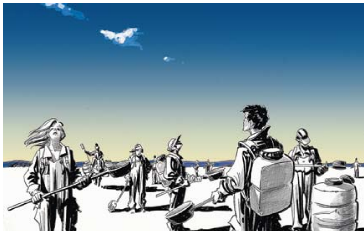
© Caçadors d'aigua. || JOAN MUNDET

La gestió de l'aigua és un tema molt complex. Quan es parla de l'aigua afloren interessos contraposats i conflictes territorials. De fet, l'aigua és un recurs que tots gestionem, tant la població com l'administració, cadascú hi ha de posar de la seva part per fer un ús òptim evitant el malbaratament. Aquest cas tan irresponsable que es va fer públic fa uns dies, el de la fuga de la canonada Cardedeu-Trinitat, ens fa avergonyir. És hora d'arreglar les canonades, de recuperar les connexions subterrànies que van directament a claveguera, les aixetes que degoten,