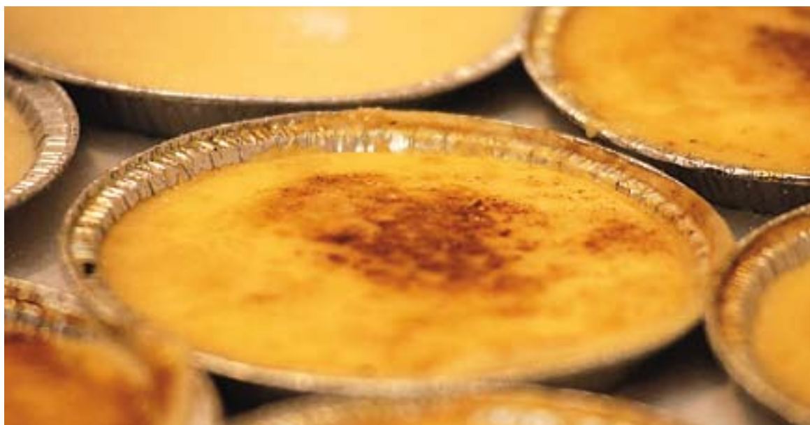
⊙ La crema catalana que es va repartir l'any passat durant la festa de Sant Josep.

Al matí i a la tarda es podran visitar 55 parades de productes artesans vingudes d'arreu de Catalunya i Europa (bàsicament França), tot i que set d'elles són de Castellar. Totes les parades estaran col·locades a la plaça Major i a la plaça del Mercat i vendran embotits, formatges, ametlles, mel, herbes remeieres, coques i pa, olives, caramels naturals, anxoves, vins i caves, salses,