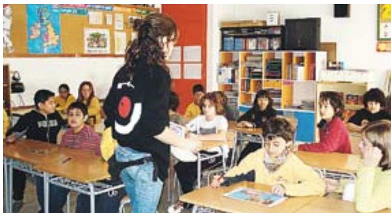
Taller d'estalvi d'aigua al curs de 5è A del CEIP Bonavista.

talvi d'aigua. Durant quatre dies, estudiants de Ciències Ambientals han explicat als nens i nenes de Castellar la quantitat d'aigua que gastem i la poca consciència que de vegades tenim les persones d'aquest consum excessiu.