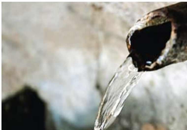
⊙ Una font de Castellar del Vallès. || J.G.

Davant d'aquesta situació, el consistori ha demanat als ciutadans que facin un bon ús de l'aigua de xarxa. Així, es recomana no fer servir aigua de boca per regar jardins, vials o voreres i no rentar els vehicles amb mànega. A més, es recorda que les rentadores i els rentavaixelles treballin a la seva màxima capacitat. Canalís ha deixat clar que "de moment només es tracta d'una recomanació, però més endavant es pot convertir en una prohibició si la situació s'extrema" . En aquesta línia, l'Ajuntament repartirà als domicilis de Castellar més de 8.000 reductors volumètrics per la cisterna del vàter; una mesura que busca reduir el volum d'aigua que es gasta a les llars per aquesta qüestió.