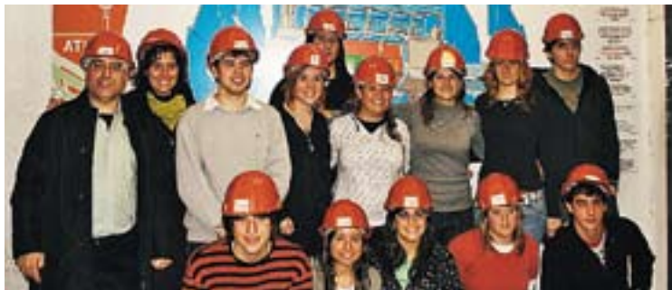
Alumnes de l'IES Castellar a les instal·lacions del CERN.

Del 7 al 10 de març, els alumnes de segon de Batxillerat de l'IES Castellar van viatjar a Ginebra (Suïssa) per visitar un dels centres d'investigació més importants del món en física fonamental, el Centre Europeu