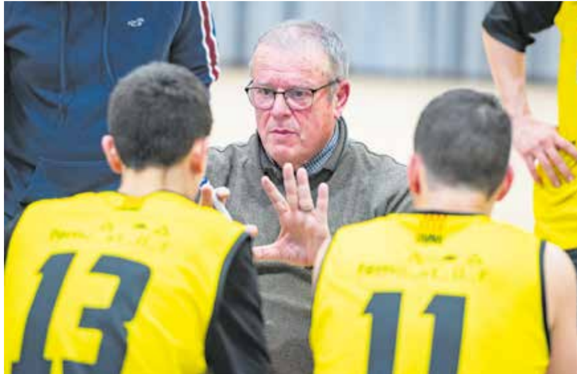
Bordas no ha pogut salvar l'equip, tot i estar a punt de fer el miracle, després d'una gran ratxa de victòries amb un equip desfet. || A.S.A.

Es va donar confiança als jugadors, potenciar la seva empatia, ubicar-los al seu lloc natural per potenciar el rendiment, el treball que es va aportar, començant a entrenar dur, sense tenir minuts de gràcia, sinó minuts de ren-