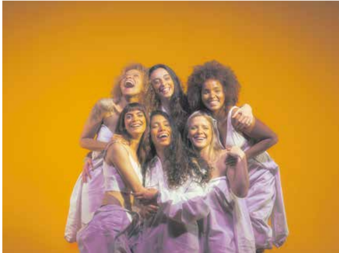
Las Karamba actuen a Castellar divendres que ve, 14 de juliol, a la plaça d'El Mirador.

Sobre el festival FemFestival, creuen que falta molt camí per recórrer i que és important tenir en compte la dona, que no es prioritzi, sinó que les tinguin en compte