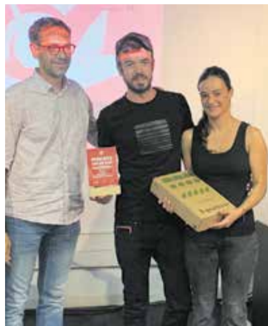
D'esquerra a dreta, els responsables de La Masia del Racó i de la pastisseria Muntada, rebent el premi del jurat.