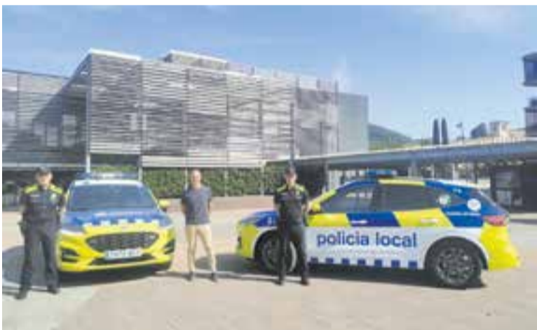
Dos policies i el regidor de Seguretat Ciutadana amb els nous vehicles.

La Regidoria de Seguretat de l'Ajuntament de Castellar continua d'aquesta manera amb la línia de contractació d'aquest tipus de vehicles, amb l'objectiu de fomentar la mobilitat sostenible. ✦ || REDACCIÓ