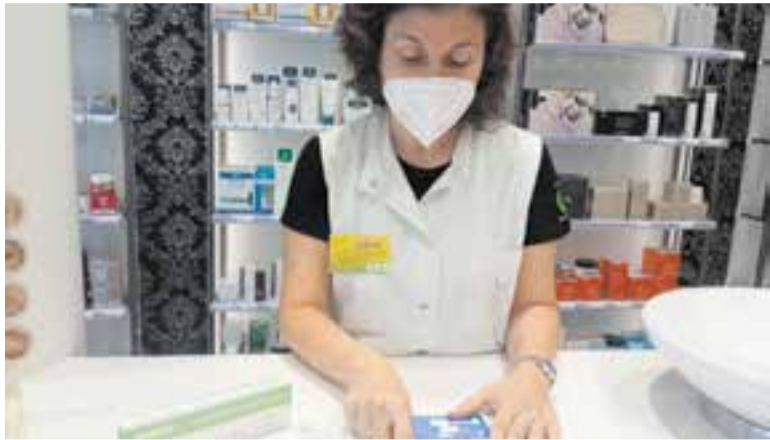
Una farmacèutica dispensant un test d'antigens.

El Consell de Ministres d'aquest dimarts va aprovar el reial decret que acaba amb la crisi sanitària per covid a Espanya i, per tant, a l'obligatorietat de l'ús de mascaretes en àmbits sanitaris com hospitals, farmàcies, centres de salut o residències.