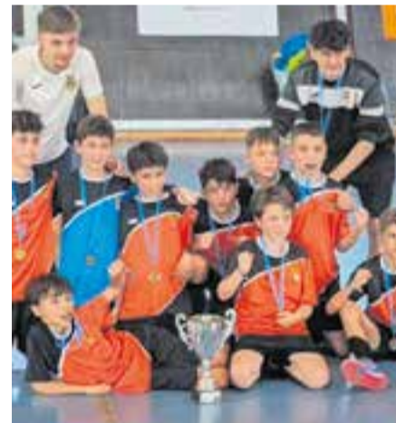
L'aleví A amb la copa de campions.

La base de l'FS Castellar va disputar la Copa Cerdanya, un dels tornejos tradicionals de final de temporada, que es disputa en diferents seus en el nord de Catalunya.