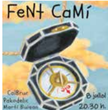
Cartell promocional de Cal Bruc.