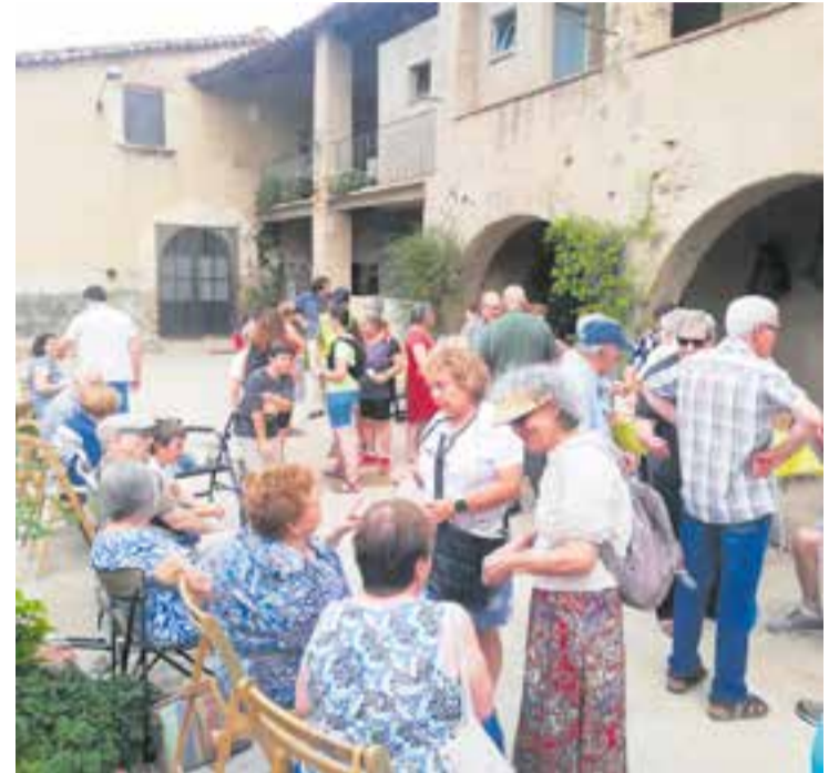
Pati de Can Santpere durant la celebració de Sant Pere. || J. LL.