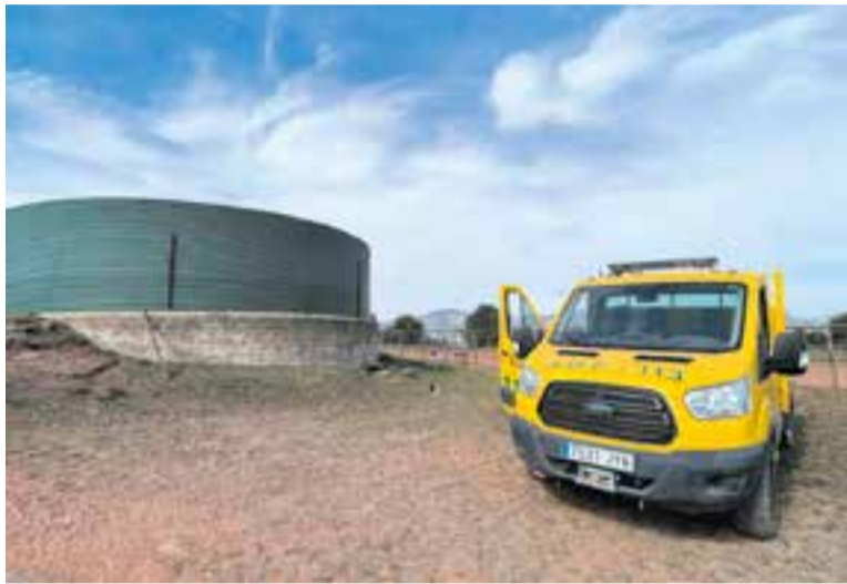
Vehicle d'ADF al costat d'una bassa en una jornada de vigilància.

Els últims xàfec d'estiu, intensos però intermitents, donen una treva als boscos de Castellar després “de set dies seguits amb un perill entre alt i molt alt d'incendi forestal, amb el Pla Alfa 2”, tal com recorden els ADF de Castellar. Una de les novetats d'aquesta campanya d'estiu és que la Diputació de Bar-