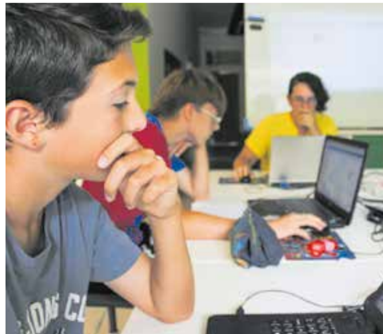
Al casal tecnològic de Codelearn Castellar es fa programació i robòtica. || C. D.

Castellar es pot enorgullir de tenir casals per a tots els gustos, aficions amb què aprendre i viure un estiu ple d'aventures. +