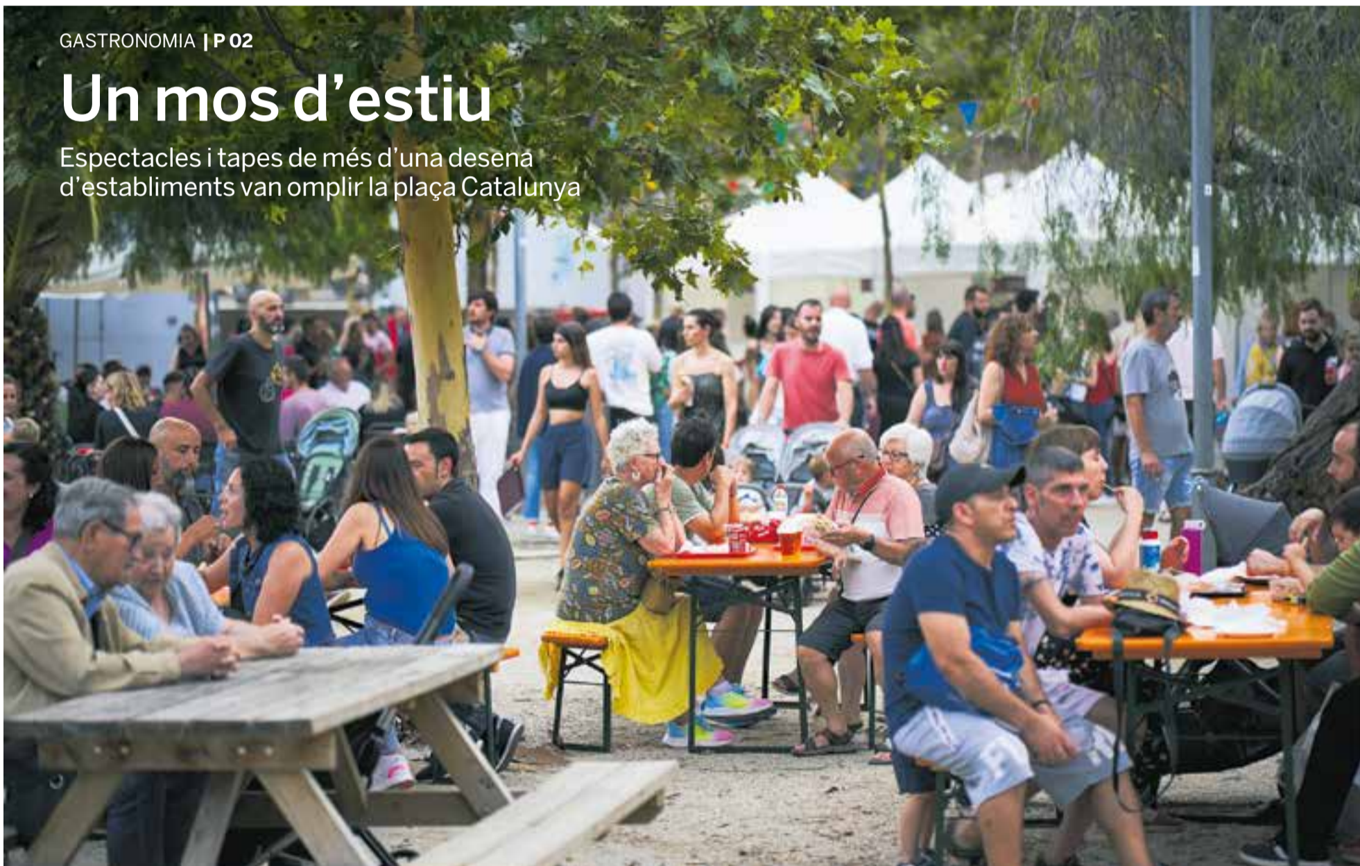
Aquest era l'ambient del Tast d'Estiu divendres de la setmana passada, un vespre en què es barreja la cultura gastronòmica i la festa.

Espectacles i tapes de més d'una desena d'establiments van omplir la plaça Catalunya