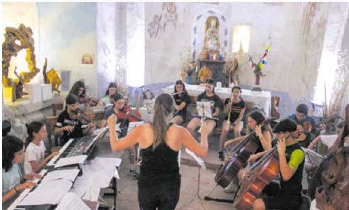
El grup de joves del casal Landscape Music Experience, d'Artcàdia, a l'ermita de Sant Pere Ullastre en una de les sortides.

L'esport també està molt present en els casals d'estiu. A les propostes del projecte Activitats d'estiu , Un estiu enriquit trobem vòlei, bàsquet, futbol, tennis, atletisme, pàdel, escalada, hoquei i fins i tot crossfit. Però també gimnàstica rítmica, una modalitat que està agafant molta força a Castellar gràcies a la bona feina del club Rítmica Clau de Sol. El casal, adreçat a nens i nenes de 5 a 16 anys, és una proposta específica de gimnàstica rítmica però combinades amb tallers de manualitats, jocs de coordinació i agilitat, sortides a la natura i a la piscina. "Ens agrada que tothom, tingui el nivell que tingui, participi amb nosaltres. Fem activitats esportives,