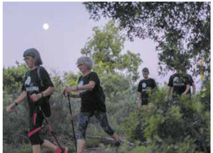
A dalt, participants de Sotalalluna per la pista cap a l'Alzina Balladora. A sota, camí cap a Can Cadafalch.