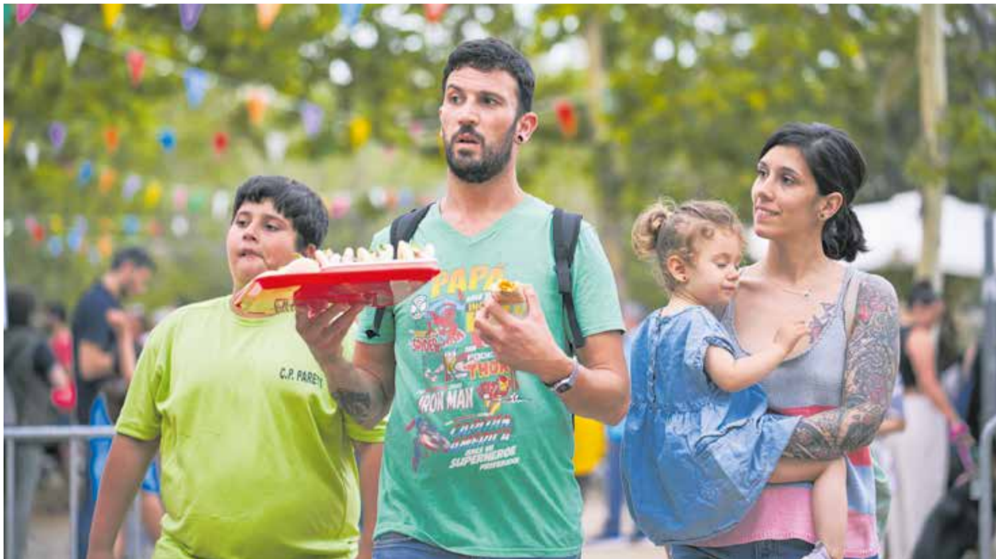
Nombrosos castellarencs i castellarenques es van acostar a la plaça Catalunya per tastar les tapes que van elaborar 11 establiments de la vila durant els dos dies que va durar l'activitat.

Més d'una desena d'establiments van oferir les seves delicioses tapes a la plaça Catalunya, que va acollir quatre espectacles