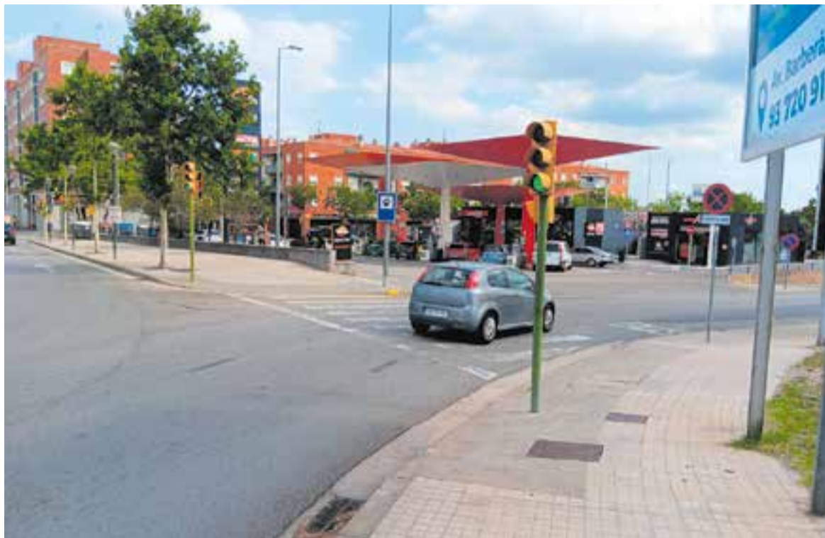
Un cotxe accedeix a l'enllaç de l'Avinguda Matadepera de Sabadell amb la Ronda Oest, que haurà de connectar la Ronda Nord. || J.R.

Com ja s'havia informat fa unes setmanes, el finançament provindrà de l'Estat però no de la disposició addicional tercera de l'Estatut, idea inicial del ministeri, i el disseny del traçat no serà d'una via d'alta capacitat per allunyar la idea que es tracta d'un tram