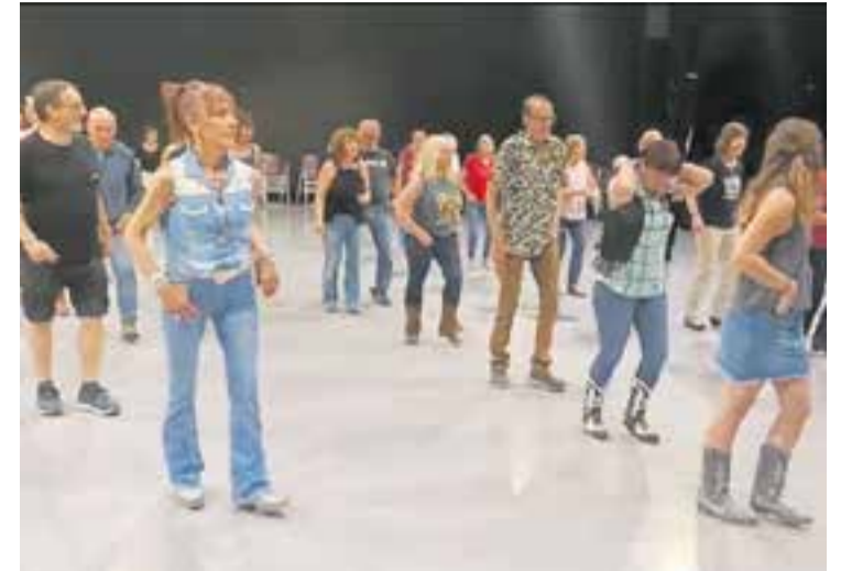
Alumnes d'Amics del Ball de Saló ballant al sopar de final de curs.