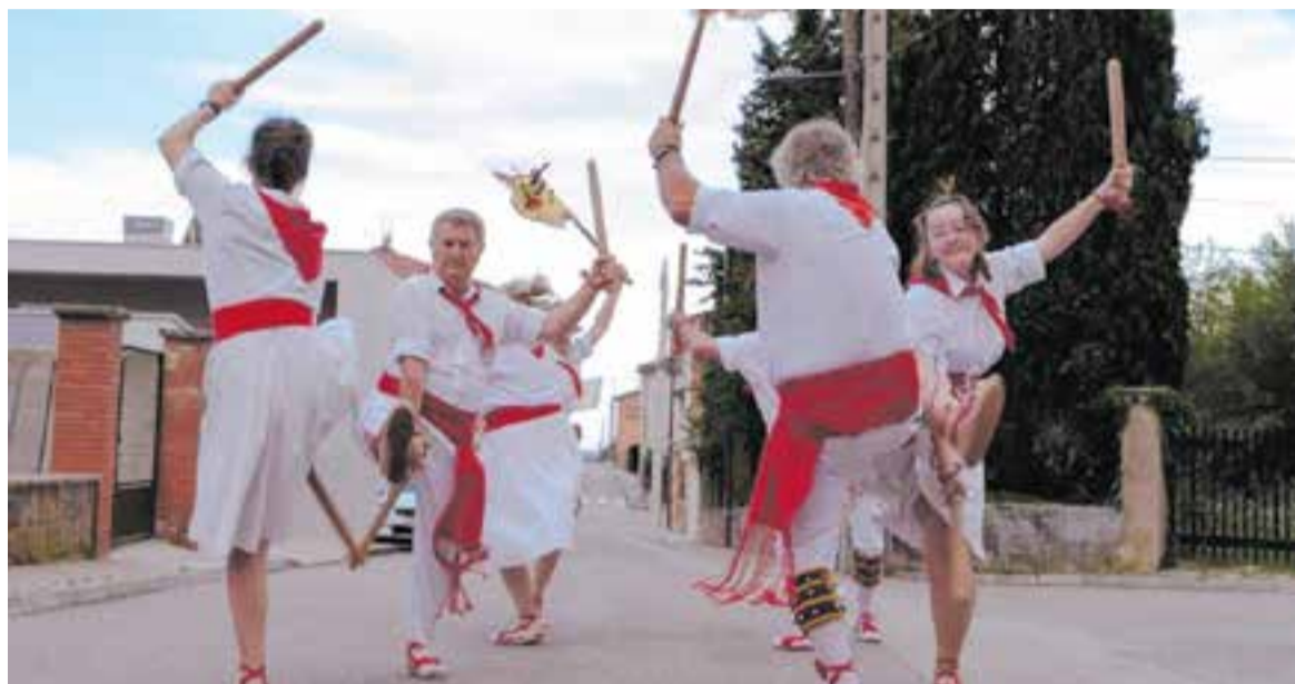
Ballada del Ball de Bastons de Castellar a la 4a Trobada Nacional de Ball de Bastons de Catalunya, a Prats de Lluçanès. || BASTONS

L'entitat finalitza la temporada fent balanç; tornaran per Festa Major