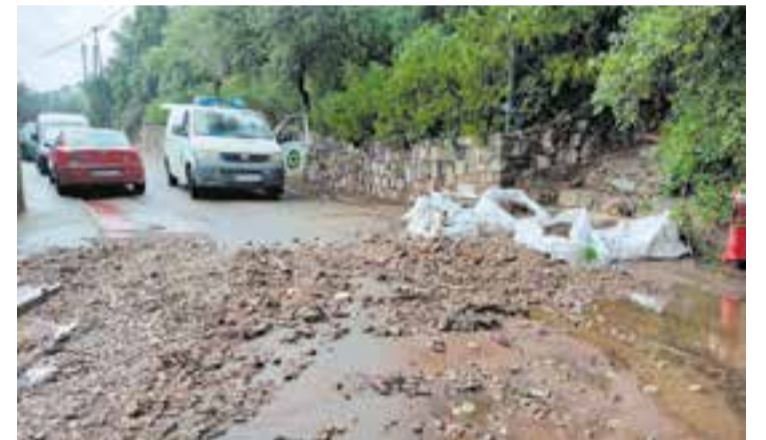
Un mur es va esfondrar a Sant Feliu del Racó per la pluja intensa. || O. MORENO

La primera onada de calor de l'estiu va acabar la setmana passada amb un xàfec intens que a primera hora de la tarda de dijous va sorprendre Castellar. En poc més de mitja hora, l'aigua va causar estralls en punts com Sant Feliu del Racó, on va caure un mur de pedra al carrer de les Vinyes, i també va quedar afectada una torre elèctrica. Tot plegat, a tocar de les escales dels Enanitos. Efectius del SERNA i del Servei Municipal de Neteja, els ADF i els Bombers van treballar de valent per netejar la calçada i restablir la normalitat arreu del municipi. Un altre xàfec intens es va repetir passada la mitjanit, en aquesta ocasió amb tempesta elèctrica. Les xarxes socials van bullir amb imatges de les dues tempestes, amb alguns embornals col·lapsats, torrents intermitents d'aigua i fang en algunes zones, sobretot les més properes al terreny forestal, alguna branca d'arbre trencada per la força del vent i de l'aigua, i el cel il·luminat durant la nit a causa dels llamps. + || R. GÓMEZ