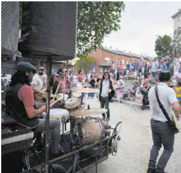
La Dinamo va amenitzar la primera tarda del Tast d'Estiu.

En aquesta ocasió, el divendres a la tarda van sortir des de la plaça del Mercat i, amb una bola de discoteca per bandera, van recórrer els carrers de Sala Boadella, Santa Perpètua i Prat de la Riba fins a arribar a la plaça de Catalunya. Amb l'estampa i el seu ritme benhumorat, encomanadís, van causar una gran ex-