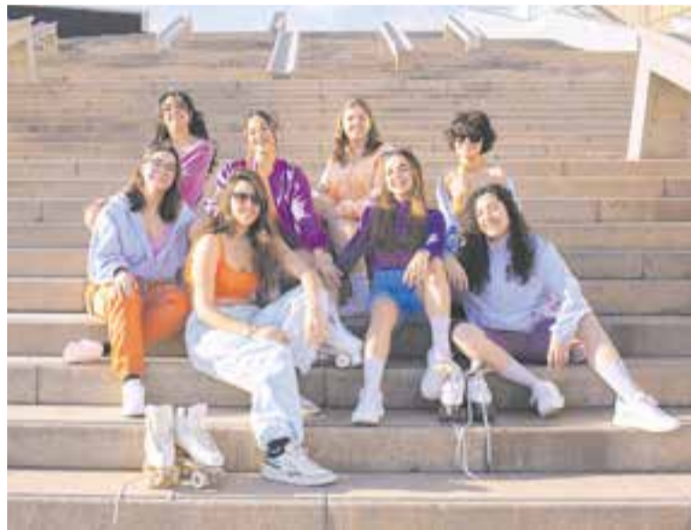
Les Que Faltaband tanquen el FemFestival diumenge 16, a les 22 hores. || IRENE KUROI

Les Que Faltaband actuen diumenge 16, a les 22 hores, també a la plaça d'El Mirador. Són vuit integrants músics i dues tècniques. "Fem versions a partir de temes que han estat escrites, fetes o cantades per dones" , diu Addaia, membre de Les Que Faltaband.