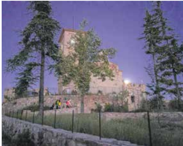
La caminada #Sotalalluna al seu pas per Puig de la Creu.

Així, el Centre Excursionista dona suport a totes aquestes entitats i també agraeix la solida-