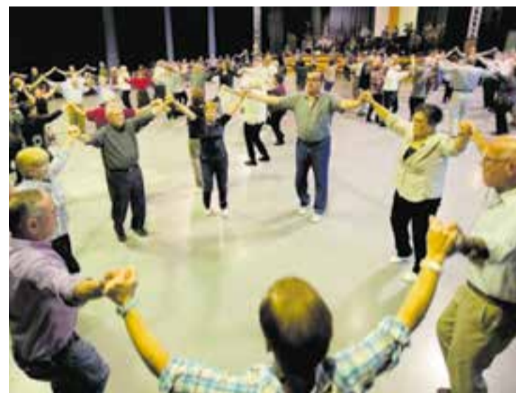
Ballada de sardanes a la Sala Blava de l'Espai Tolrà.

A més de ballar, els organitzadors aconsellen les classes a tothom qui vulgui fer noves amistats i passar una bona estona. † || M. A.