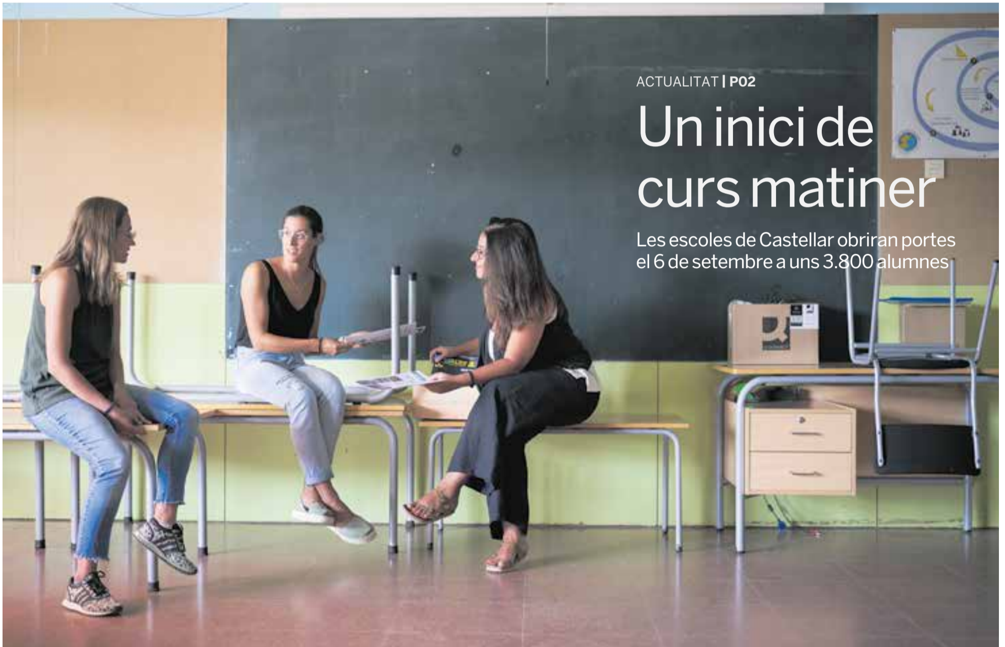
Membres de l'equip directiu de l'Escola d'El Sol i la Lluna reunits en una aula del centre en una imatge d'aquest dimecres.

Les escoles de Castellar obriran portes el 6 de setembre a uns 3.800 alumnes