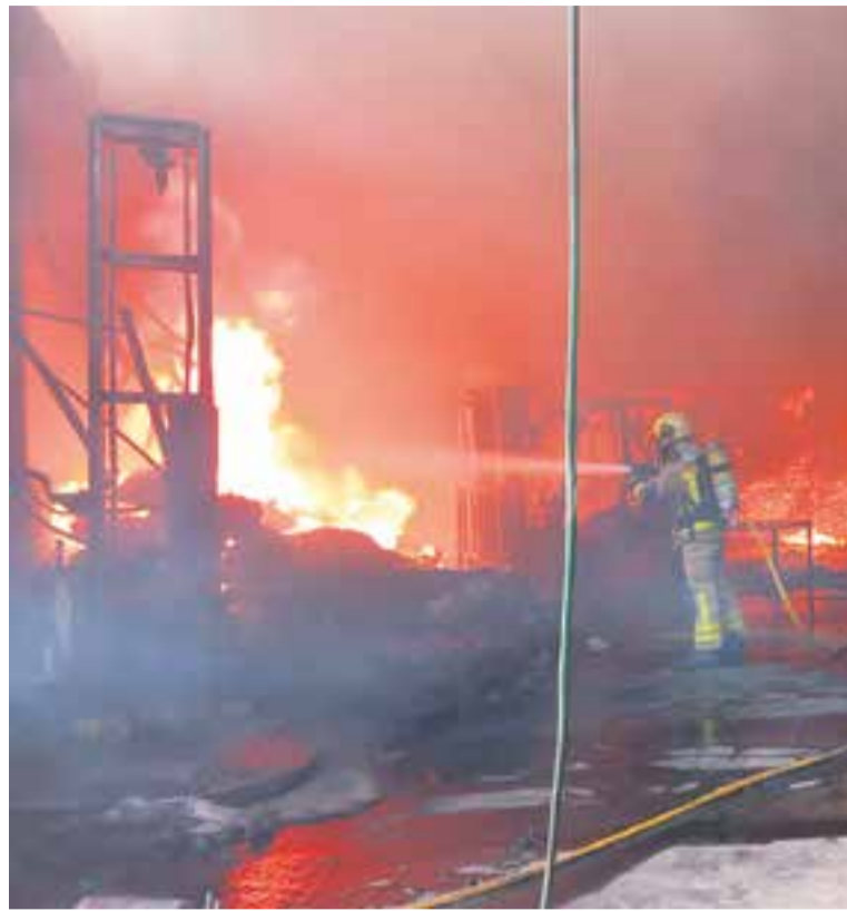
Un bomber treballant el primer dia de l'incendi.

De moment, les causes encara es desconeixen, per exemple si ha pogut ser algun tipus de maquinària o un curtcircuit. Les flames van començar dimarts a primera hora a l'interior de les instal·lacions del magatzem de Llenyes i Carbons Ponç, situades a prop del cementiri de Castellar, al Serrat del Vent. L'empresa ha fet públic a través de les xarxes socials un comunicat que afirma que la