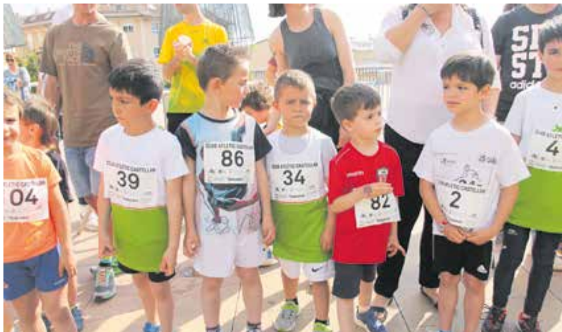
Els més petits tornaran a ser protagonistes de la Cursa Popular, un clàssic de la Festa Major. || A. SAN ANDRÉS

El CAC arrenca la temporada amb un dels actes més nombrosos