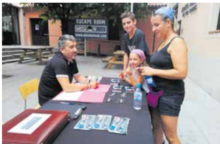
Escape room dut a terme a la biblioteca per Festa Major en una foto d'arxiu.