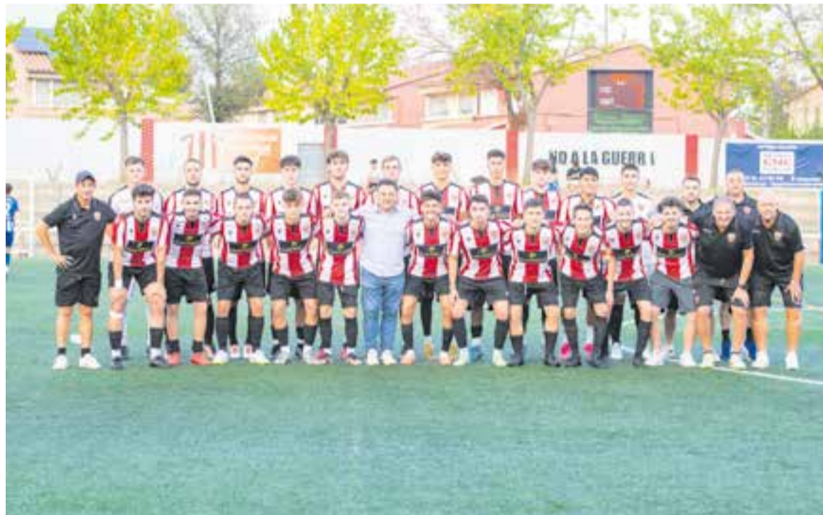
La plantilla de la UE Castellar 23-24 a l'estadi Joan Cortiella amb tot l'equip tècnic i directiu dimecres a la tarda. || A. S.A.

Per apuntalar aquesta faceta, l'equip de Roldán i Santy Fernández s'ha reforçat amb alguns dels millors