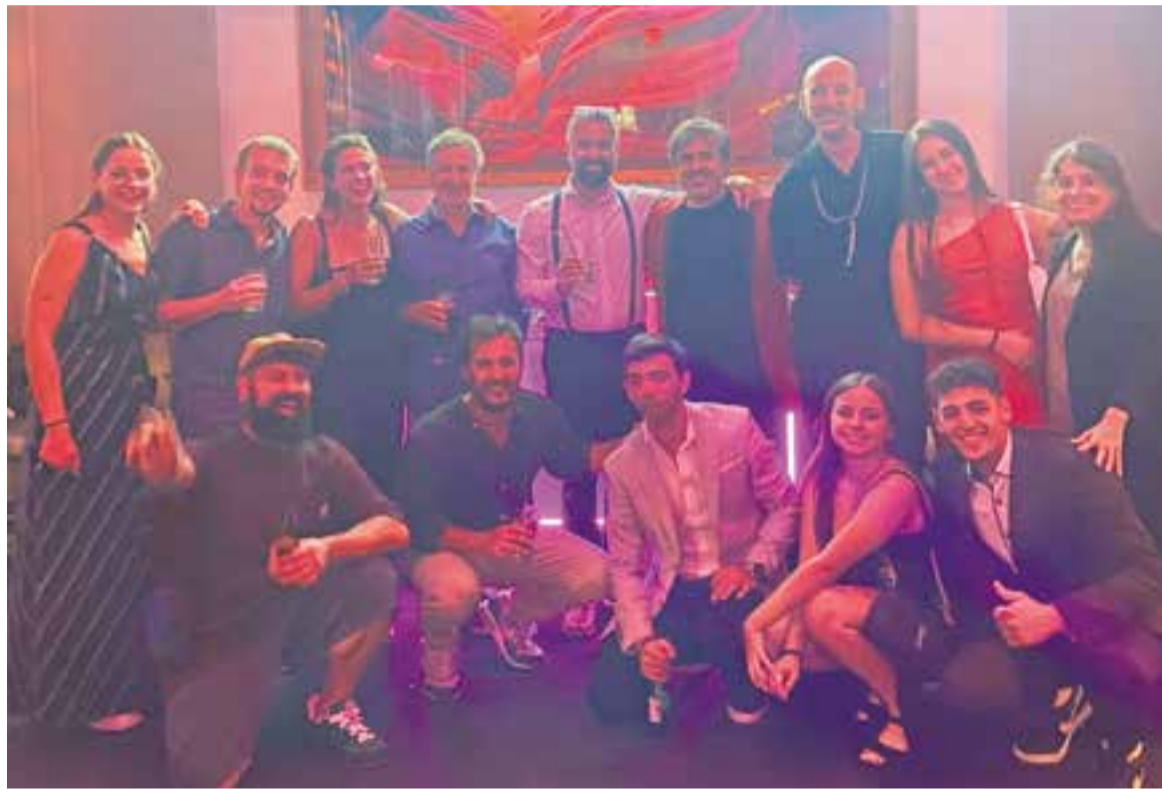
Equip i amics del Mago Pop a Nova York, entre els quals, sis castellarencs que han treballat amb el mag per arribar a Broadway.

A partir d'aquell moment, ambdues parts van seguir en contacte. L'equip del Mago Pop va mirar altres teatres, però molts havien tancat i molta gent havia perdut la feina. Per