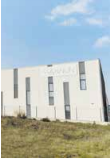
Planta de Hannun a Castellàr.

Hannun, el grup de mobles i decoració sostenibles amb seu al polígon del Pla de la Bruguera des de març d'aquest any, ha anunciat l'adquisició del 51% del capital social de We Do Wood, reconeguda companyia danesa de disseny i producció de mobles minimalistes amb força presència a Escandinàvia i Dinamarca. S'espera que aquesta adquisició es formalitzi com a màxim fins a finals d'octubre després de l'anunci de la signatura de l'acord d'adquisició, no vinculant, entre les dues companyies.