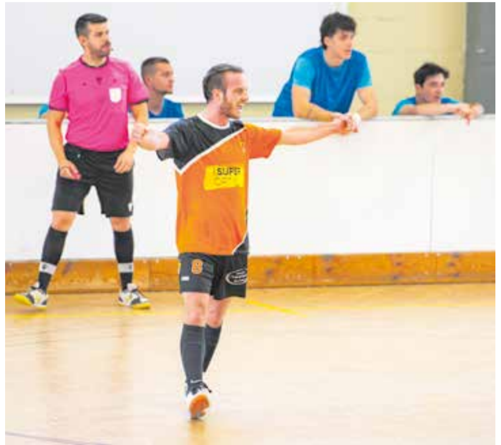
L'equip vol arrencar amb la mateixa eufòria de final de temporada, on va aconseguir salvar la categoria. || A. S.A.

Aquest dissabte (18.30 h), l'equip s'enfrontarà al CEFS Manlleu de Divisió d'Honor en el primer test de pretemporada al Joaquim Blume, mentre que dilluns ho faran contra el juvenil de Divisió d'Honor Nacional del CN Sabadell i dissabte 9 de setembre contra l'Escola Pia de Sabadell de 2a B. El 30 de setembre iniciaran la lliga visitant al Terrassa FC. →