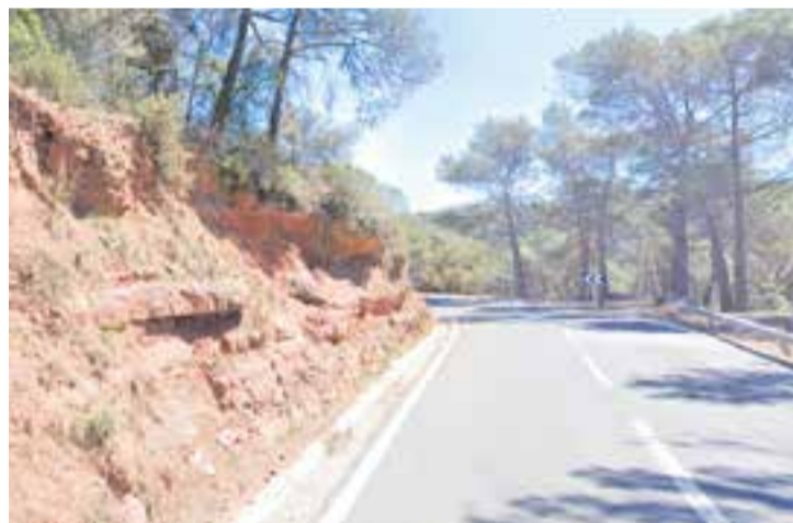
L'obra, que millorarà la seguretat, abastarà 12 km de longitud de la B-124. || GOOGLE

A més a més, es milloraran dos encreuaments amb la BV-1249 (la carretera que connecta la B-124 amb Sant Feliu del Racó) i els accessos a les urbanitzacions existents i la pacificació de la travessera de Castellar del Vallès. La redacció d'aquest projecte es licita per un import de 262.000 euros i un termini de 10 mesos. + || REDACCIÓ