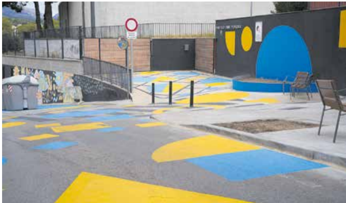
Als voltants de les escoles s'ha habilitat un entorn pacificat. A la imatge, l'espai que s'ha habilitat al voltant d'El Sol i la Lluna. || Q. P.

L'altra novetat d'aquest curs és el nou currículum a totes les etapes educatives, una mesura que s'ha d'acabar d'implantar el curs que ve. Es tracta d'un instrument que servi-