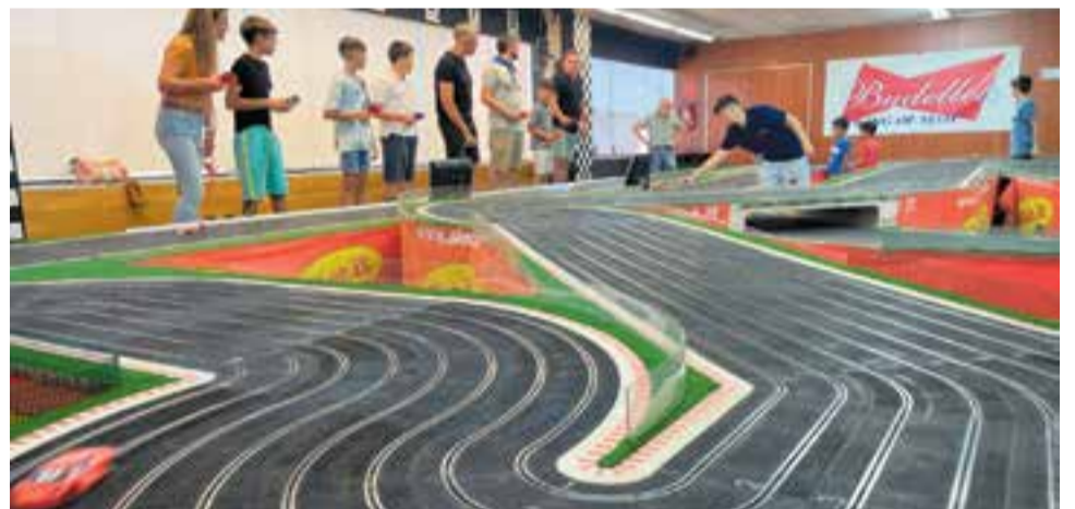
A dalt, la Cursa Popular dels petits continua creixent. Al centre, les ràpides del CEC. A baix, les curses dels Budellets al local del Pla de la Bruguera.

La publicitat no és cara. Només costa diners.