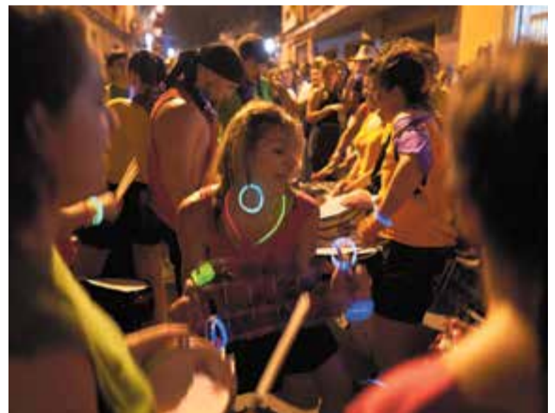
De dalt a baix i d'esquerra a dreta: plantada dels gegants durant la Cercavila de diumenge; un dels músics del grup The Txandals en la seva actuació a les Barrakes; un infant i el seu pare segueixen el concert de Reggae per Xics; moment espectacular del correfoc infernal i ambient jove la nit del Correlokals.