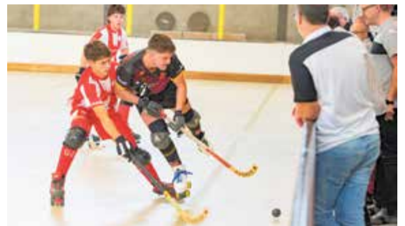
Arrenca la temporada per a l'HC Castellar a Primera Catalana.