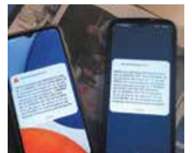
Dos mòbils amb l'alerta.

A les 12 en punt de dijous va sonar una alarma als telèfons mòbils intel·ligents que es trobaven en aquell moment a Castellar del Vallès. Es tractava d'una prova d'alertes de Protecció Civil que consistia en un missatge de text acompanyat d'un fort so que va finalitzar quan l'usuari va prémer el botó d'acceptar. S'advertia a tota la ciutadania de l'àrea metropolitana que es tractava d'un simulacre i que no calia trucar al 112. Protecció Civil va confirmar que entre un 85% i un 90% dels mòbils de les zones on es va fer la prova van rebre el missatge. La Generalitat enviarà una enquesta per avaluar com ha funcionat el simulacre. ➤ || REDACCIÓ