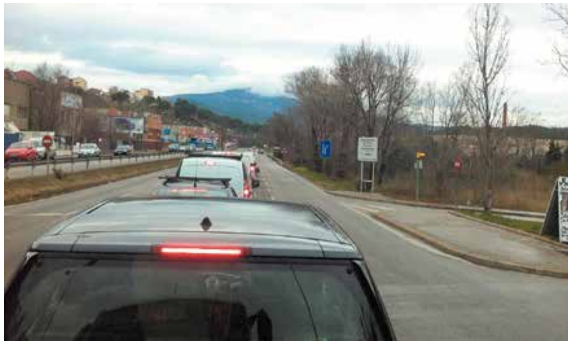
Cues en direcció a Castellar a l'altura del polígon La Llanera, on connectaria la Ronda Nord abans del pont.

En concret, segons ha avançat el Diari de Sabadell i ha confirmat l'Agència Catalana de Notícies (ACN) de fonts municipals, la proposta sabadellenca és fer dos túnels de dos carrils per sentit que anirien del Parc Agrari –sortint de l'avinguda de Matadepera al límit del terme de Sabadell– fins a la carretera de Prats. Per tant, la proposta se centra en el tram de ronda dins del terme de Sabadell que arribaria des de Terrassa soterrada pel bosc de Can Bonvilar. La ronda tindria una bifurcació per connectar amb la Ronda Oest i amb la carretera de Prats (l'enllaç amb Castellar). La proposta assenyalava que els túnels en direcció a Castellar tindrien un pendent aproximat d'un 3%, segons l'informe de l'Ajuntament de Sabadell.