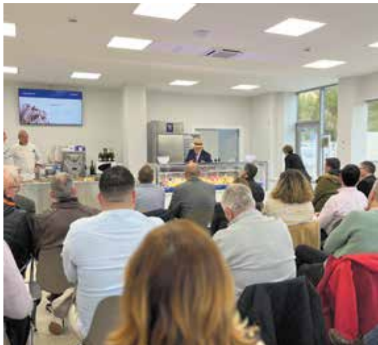
La sala de demostracions d'Aromitalia Ibérica el març d'aquest any.

L'empresa està en una nau que ja estava construïda al carrer Prio-