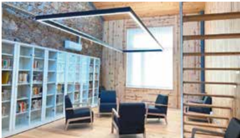
El nou espai ampliat de la biblioteca.

Gràcies a les obres, l'equipament ara compta amb una superfície nova de 140 metres quadrats distribuïda en dos nivells, fet que permet l'habilitació de dues sales d'estudi amb capacitat per a 30 persones a la planta baixa. A la primera planta, s'ha habilitat l'espai de treball destinat al personal de la biblioteca i, a més, s'ha habilitat un pati intern per a activitats, amb un porxo al fons. ➤ || REDACCIÓ