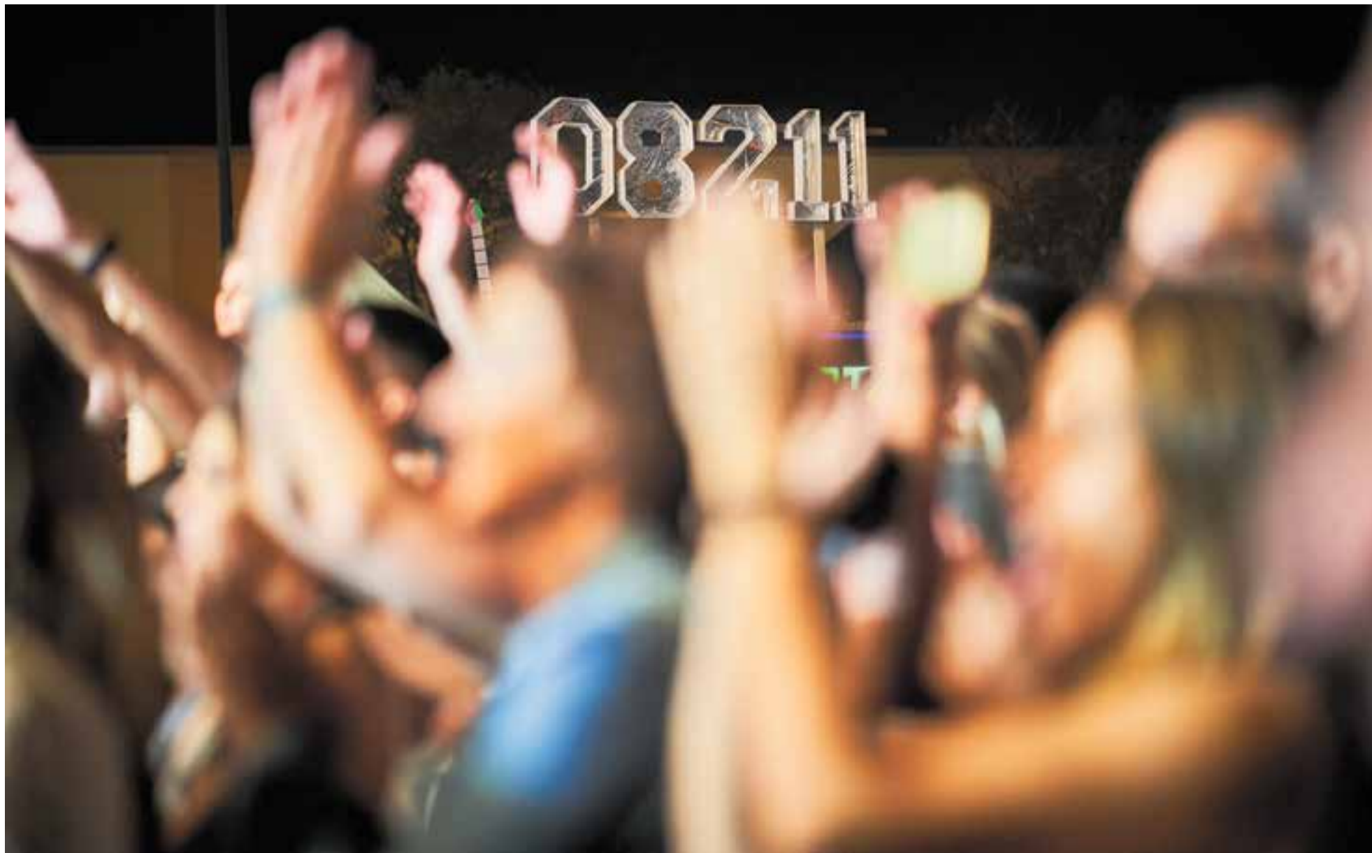
El codi postal de Castellar del Vallès, el 08211, va guanyant protagonisme simbòlic i es pot veure tant en samarretes com en decorats del Vilabarrakes, com mostra la imatge.

Una de les millors festes majors dels darrers anys queda marcada per la mort d'un home dimarts per una caiguda