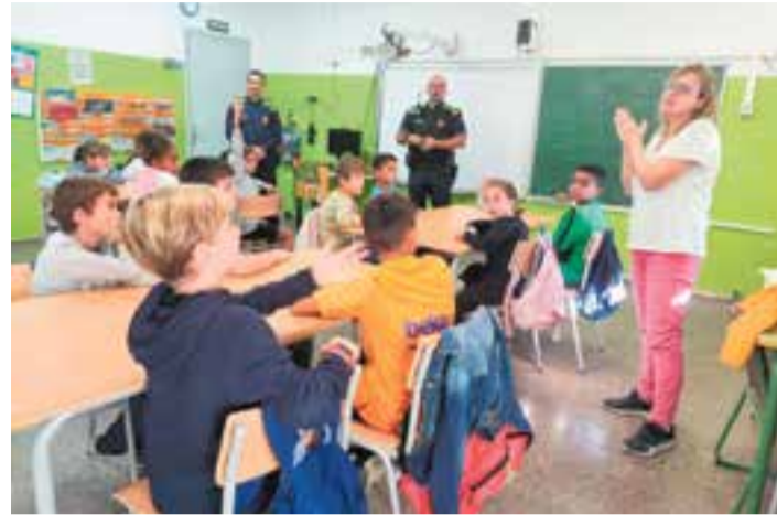
Un dels tallers de mobilitat celebrats l'any passat a l'IE Sant Esteve.