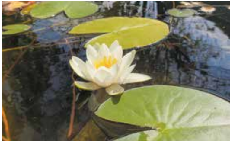
Nenúfars 'Nymphaea alba', del Delta de l'Ebre, a l'estany del Viver Tres Turons.

Les plantes aquàtiques representen el grup ecològic més amenaçat de tota la flora catalana. De fet, els ecosistemes aquàtics són els que estan perdent més biodiversitat a