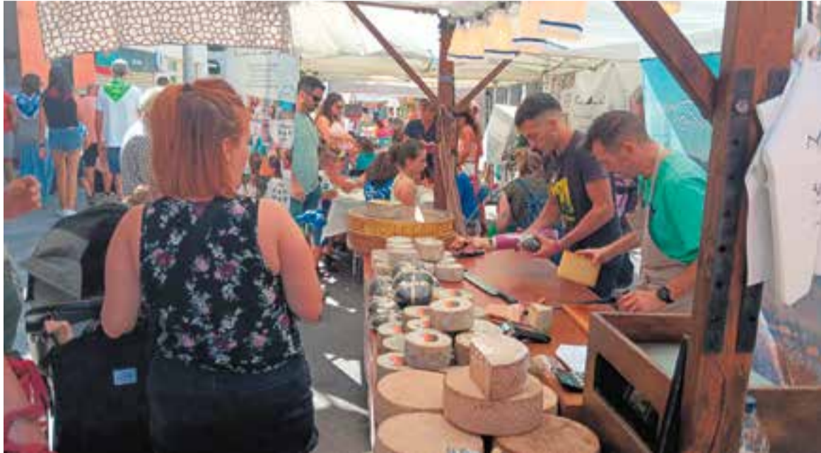
Aquest era l'ambient diumenge al migdia al carrer Sala Boadella durant la celebració de la Fira Street Market.