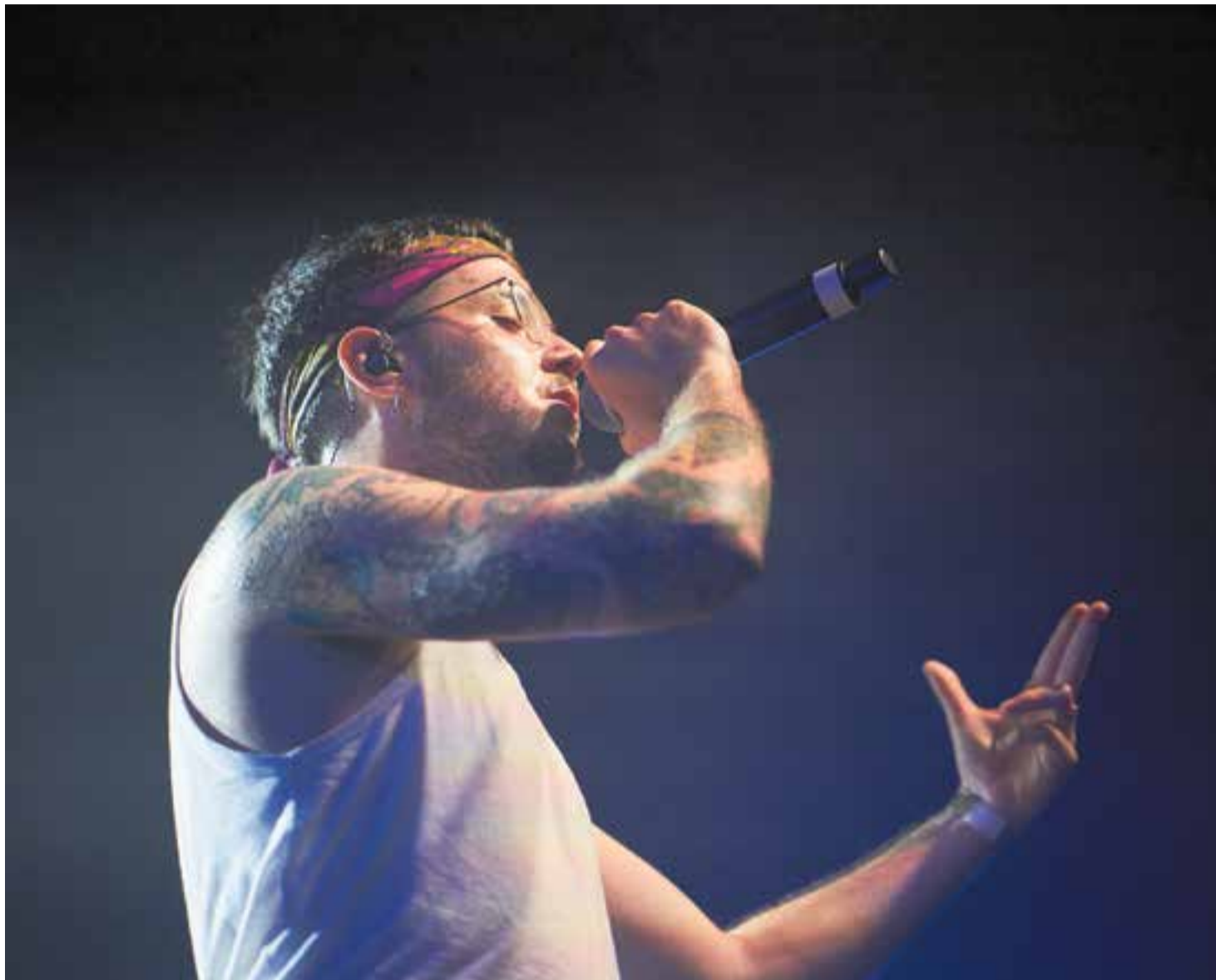
Lildami va entregar-se al públic castellarenc al concert de Festa Major, diumenge passat.

A Lildami, de compromisos als escenaris no n'hi falten, de moment, com ho demostra la gira de concerts que ha anat fent durant tot aquest estiu. Per a uns quants fans, el concert en directe de Castellar va servir per veure'l per primer cop en carn i ossos, més enllà de la pantalla de televisió. ➔