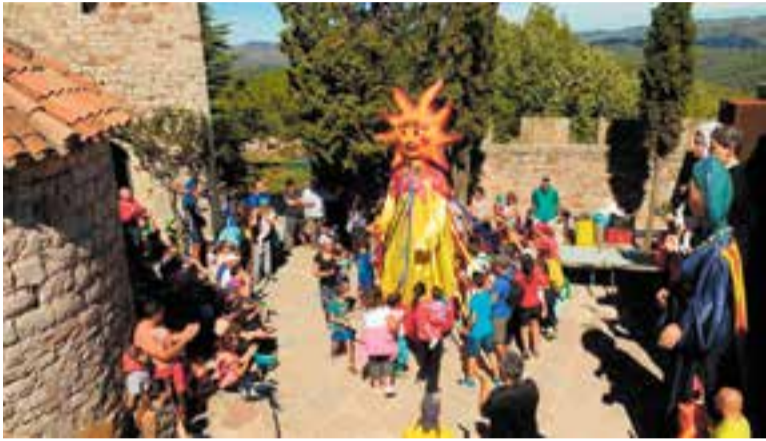
Els Gegants de Castellar en una de les trobades de tardor al Puig de la Creu.

El Puig de la Creu ha previst diverses activitats per a diumenge al matí