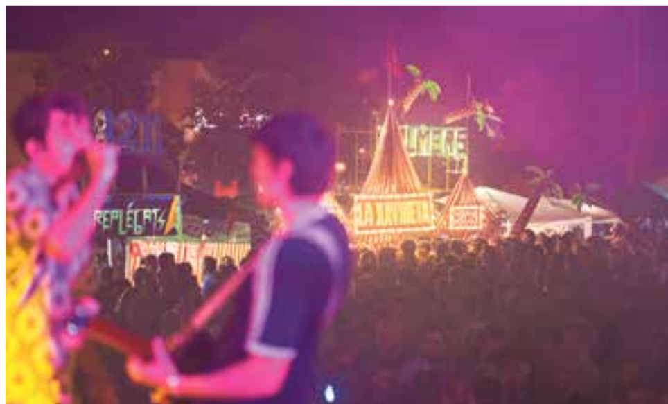
Vilabarrakes durant el concert de Sexenni. Al fons, la barraca guanyadora d'enguany, La Xavineta.

Fent el concurs, segons el col·lectiu Vilabarrakes, "es genera una mica de competició interna per fer que les barraques quedin ben boniques". En aquest sentit, hi ha col·lectius que ja treballen en la decoració de la seva barraca des de dos mesos abans. ➔ || M. A.