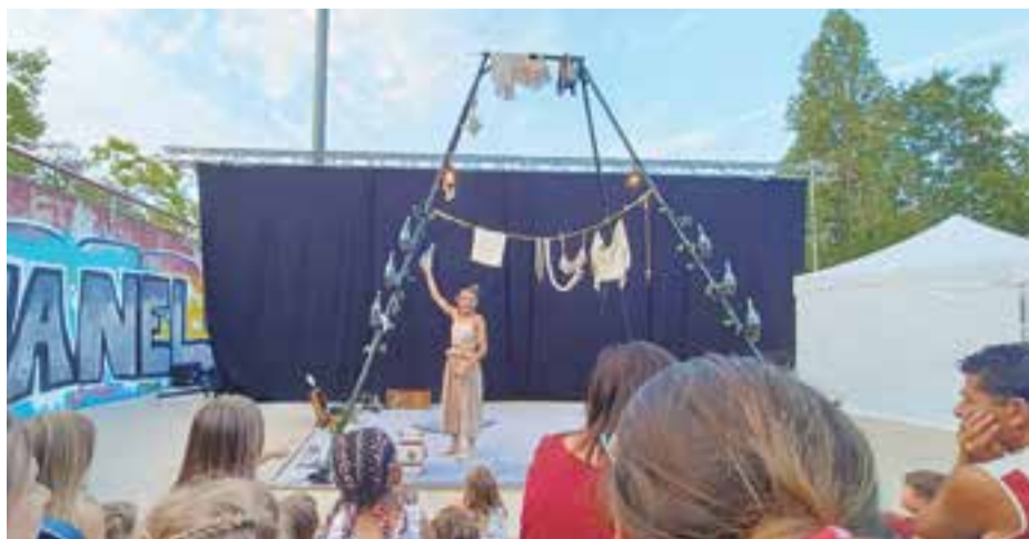
'Els viatges de la Bowa' de La Gata Japonesa van sorprendre el públic a la plaça de Catalunya.