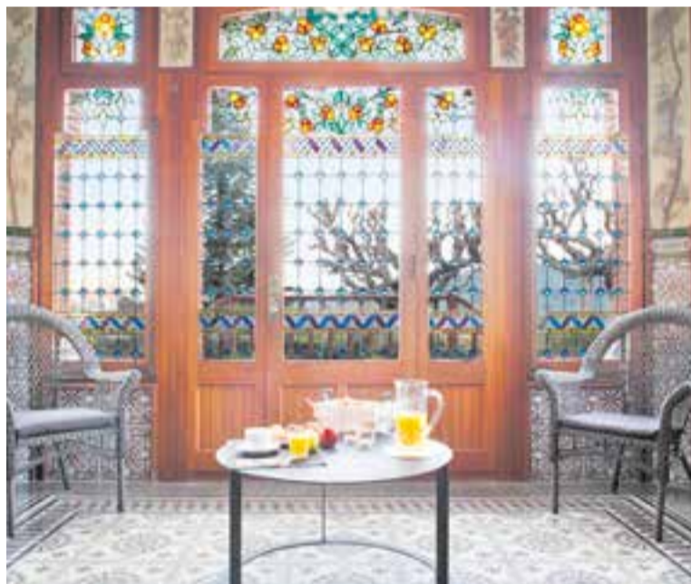
La masia Can Borrell i un dels salons amb vidrieres modernistes.

L'edifici principal és de 938 metres quadrats distribuïts en tres plantes. La casa compta amb un espectacular vestíbul amb belles vidrieres, que condueix a un saló-menjador ple de detalls modernistes. A continuació, trobem una gran cuina, un lavabo elegant de cortesia i la capella privada. A la planta superior hi ha un saló amb llar de foc i sortida a una terrassa, així com set dormitoris dobles, sis de tipus suite i tres amb un saló