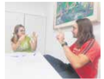
Dos alumnes durant la classe.