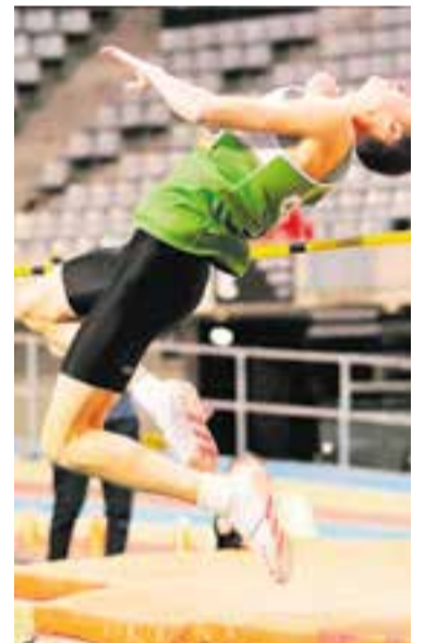
Un atleta del CA Castellar.

El club verd, mitjançant la seva Junta Directiva, en data 3 d'octubre del 2023, va acordar convocar l'assemblea general ordinària per al divendres 27 d'octubre del 2023 al gimnàs de les pistes municipals d'atletisme. L'acte se celebrarà a les 18.45 hores en primera convocatòria i a les 19.15 hores en segona, amb l'ordre del dia següent: lectura i aprovació de l'acta anterior, llicències, quotes de soci adult i precs i preguntes. Des del club verd es prega la màxima assistència per la importància dels temes a tractar. ✦ || REDACCIÓ