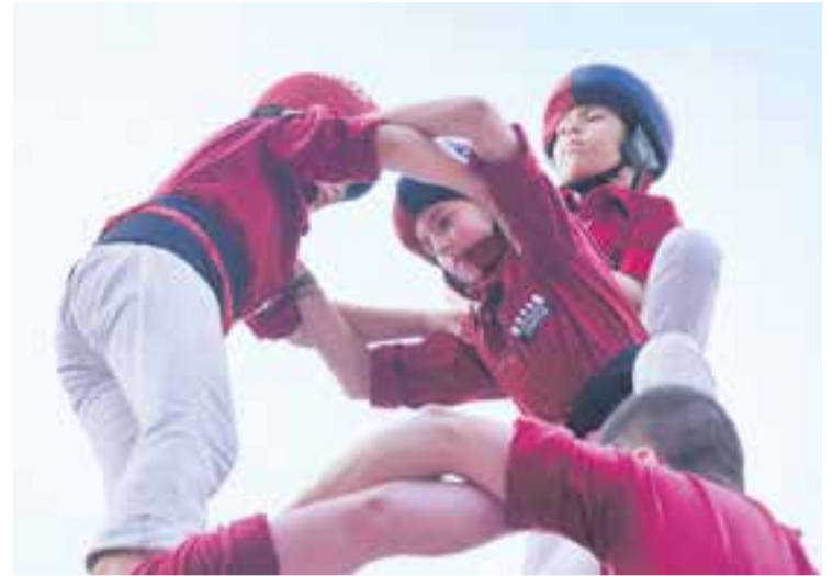
Els acotxadors i l'enxaneta dels Capgirats, a punt de carregar un castell.