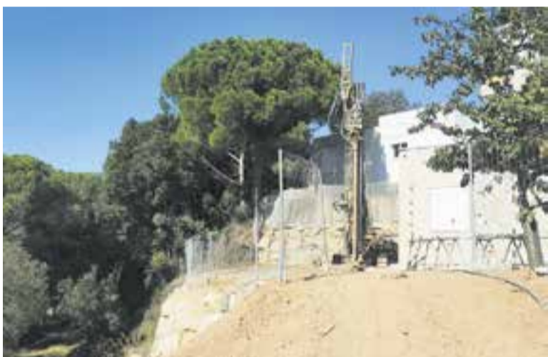
Les obres d'estabilització del talús del carrer de Santa Maria de Villalba. || AJ. CASTELLAR

Les inversions per als propers mesos a Sant Feliu del Racó i les urbanitzacions superen el milió d'euros i també inclouen les reformes del local social de Can Font i de la piscina del Casino del Racó. ➔