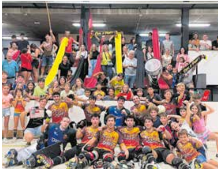
Els jugadors celebrant la victòria al pavelló Pedrosa