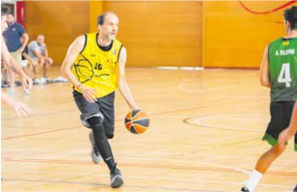
El CB Castellar va entrar en joc a Sabadell i no va poder amb el Sant Nicolau B. || A. SAN ANDRÉS