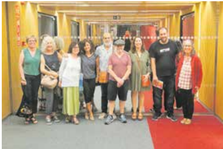
Membres del Club Cinema Castellar a la Setmana de Cineclubisme Català.