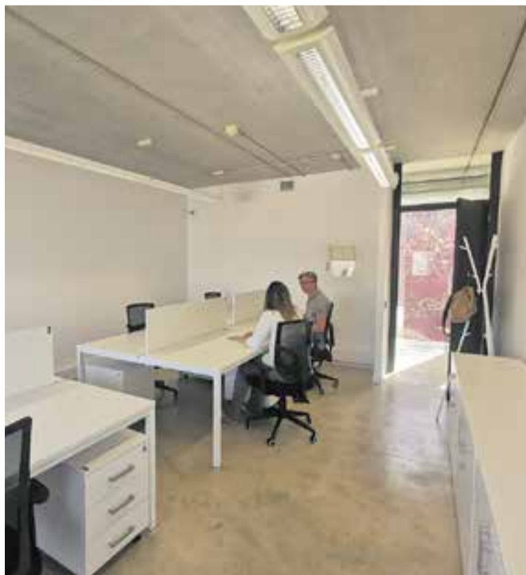
Imatge del nou espai que es farà servir per al cotreball. || AJ. CASTELLAR

Promoció Econòmica i Ocupació, Rubén Peñalver, l'espai que permetrà acollir sis persones s'ofereix amb un preu assequible d'uns 60 euros al mes, també "domiciliar l'activitat empresarial i dona accés a tots els espais comuns del Centre de Serveis, com poden ser les sales de formació o de reunió" .