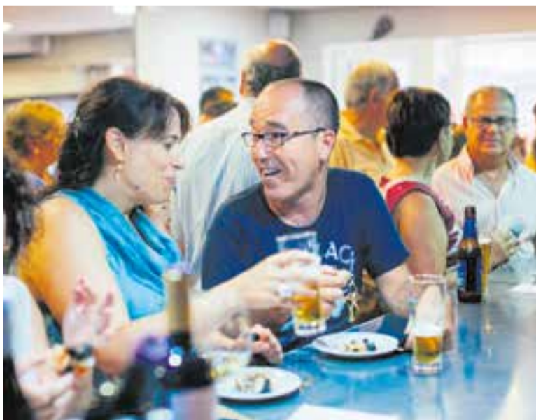
Castellarencs en un establiment de la vila en una imatge d'arxiu.

Està al lloc 93 dels municipis amb més de 1.000 habitants a Catalunya