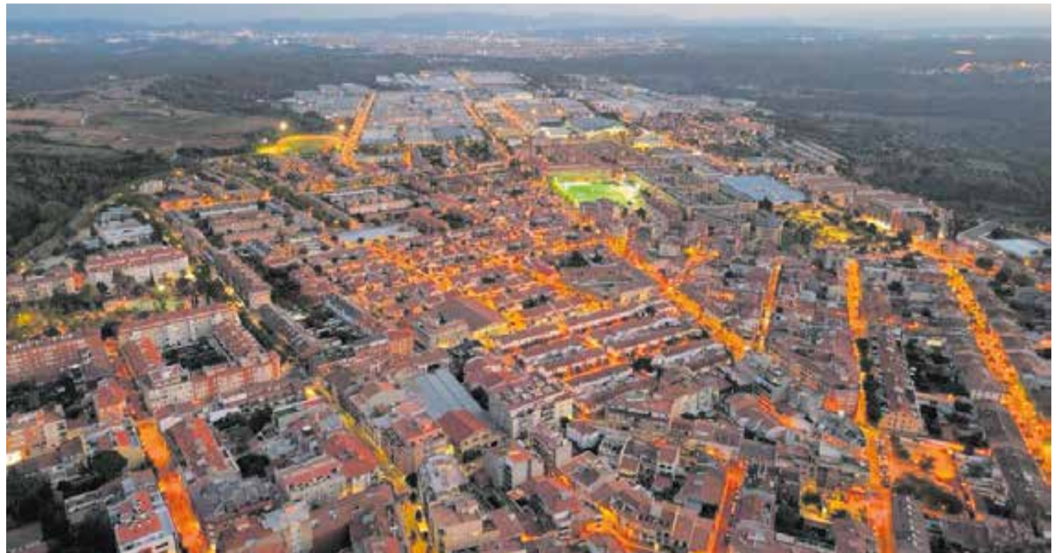
Vistes aèries de Castellar del Vallès al vespre en una imatge aèria de fa pocs dies. || J. CÁRCELES

El 2022 el preu de compravenda comarcal se situa en 2.375,00 €/m 2 de mitjana, inferior al de la província de Barcelona (2.759,11 €/m 2 ) i superior al del conjunt