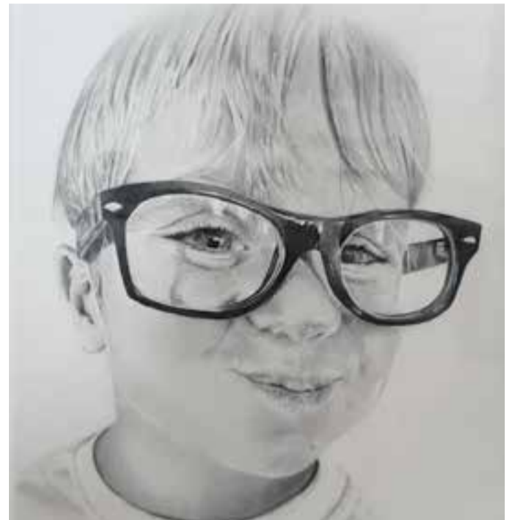
Un dels quadres d'Àngel Sánchez que es pot veure al Calissó.

A la seva primera exposició al Calissó Cultural presenta una sèrie de retrats que destaquen per la seva simplicitat i elegància en el traç. Com el seu nom indica, Lights and Shadows , és a través de les llums i les ombres que aconsegueix representar la volumetria dels cossos. + || M. A.