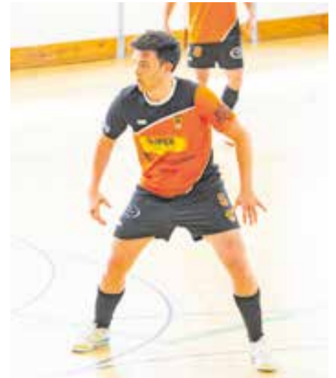
L'FS Castellar encara no s'ha estrenat en Lliga. || A. S.A.

L'FS Castellar va sumar la segona derrota consecutiva en l'estrena de la Lliga al Joaquim Blume. Els de Darío Martínez van caure per 4-5 contra el Girona, que es va emportar la victòria a un minut del final, quan el 4-4 semblava definitiu. Els taronges van manar al marcador durant tota la primera part, després de remuntar el 0-1 aconseguit pel rival al minut 5, però els gironins van capgirar en dos minuts, al 29 i el 30, i van aconseguir el 3-4, que els de Martínez van igualar al 33. Amb un 4-4 que va semblar que seria el resultat definitiu, els gironins van sorprendre a tothom marcant el gol de la victòria a segons del final i deixant sense cap punt els castellarencs. L'equip acumula el segon zero de l'any i es manté a la part baixa de la taula, abans de visitar la Unió Santa Coloma, un altre equip en hores baixes i que encara no ha puntuat. + || A. SAN ANDRÉS