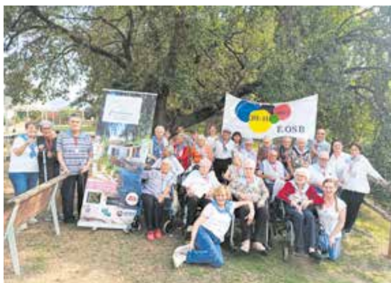
L'equip de la Fundació Obra Social Benèfica a Sant Antoni de Vilamajor.

vida és un xou i la salut mental hi és molt present, el 28 d'octubre passarem una tarda d'espectacle que ens farà vibrar en positiu. Riure, recordar, connectar, i celebrar els 25 anys de Suport Castellar SM, i els 20 anys de servei de Club Social, a la sisena edició del Festival SoM salut mental" , expliquen des de l'entitat. Hi participaran el grup de música de SM Sabadell Krek'n'tu, la coral Pasa a Pas, AME moviment, grup de teatre Arc de Sant Martí, i Suport Castellar SM. El preu de l'entrada serà de 5 euros. +