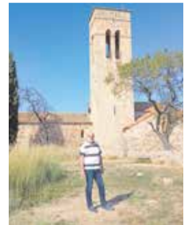
Joan Juni a Castellar Vell.

Una de les propostes que ha presentat Junts per Castellar per als pressupostos de l'any 2024 és la de recuperar els treballs de les excavacions arqueològiques de Castellar Vell. Des que l'any 2007 es van abandonar, no s'han continuat fent les excavacions a l'esplanada que es troba tant al davant com al voltant de l'edifici principal de l'església. "És per això que celebrem que amb la nostra iniciativa d'incorporar-ho als pressupostos, el PSC recuperi per primer cop en el seu govern els treballs de noves prospeccions", explica la formació en un comunicat. Com es va poder veure a la presentació pública dels pressupostos de la setmana passada, "amb la nostra sol·licitud s'ha introduït una partida de 40.000 € per reprendre l'activitat d'investigació en aquestes excavacions". Segons Junts, la seva proposta "vol mantenir els treballs en els propers anys". ➔ || M. A.