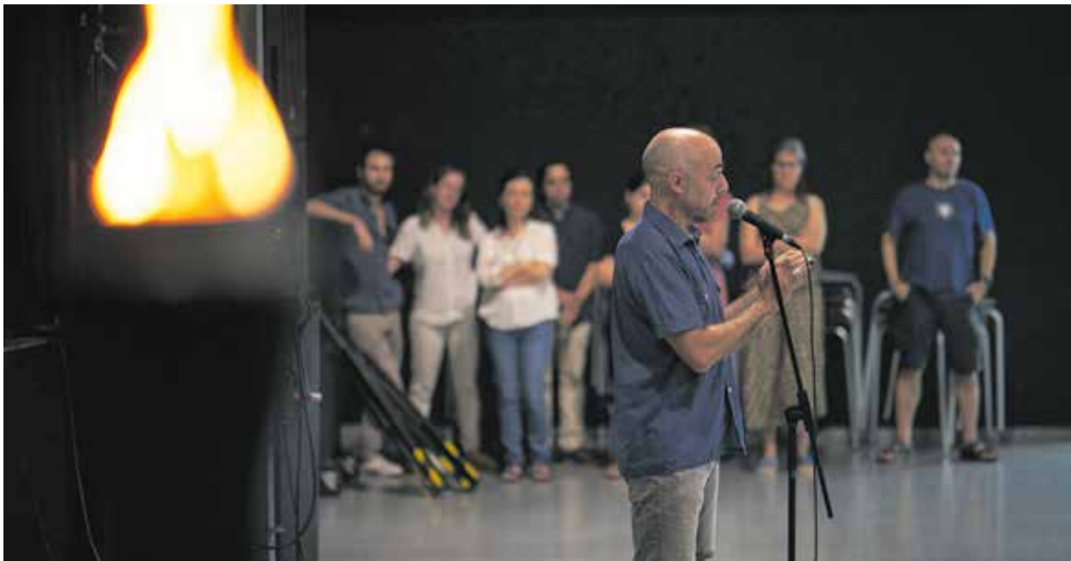
La lectura del manifest del Correllengua, enguany escrit per l'actriu i activista Carme Sansa, a la Sala Blava de l'Espai Tolrà, al costat de la flama.

La CAL va organitzar l'acte central del Correllengua dissabte a la Sala Blava de l'Espai Tolrà, amb molta cultura popular