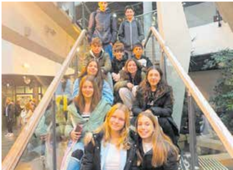
Alumnes del Casal amb estudiants portuguesos i estonians.

Un grup d'alumnes del Col·legi El Casal format per nois i noies de segon, tercer i quart d'ESO i dues professores han viatjat a Estònia per participar en les activitats del projecte My Actions, Our Future. Aquest és el projecte d'Erasmus+