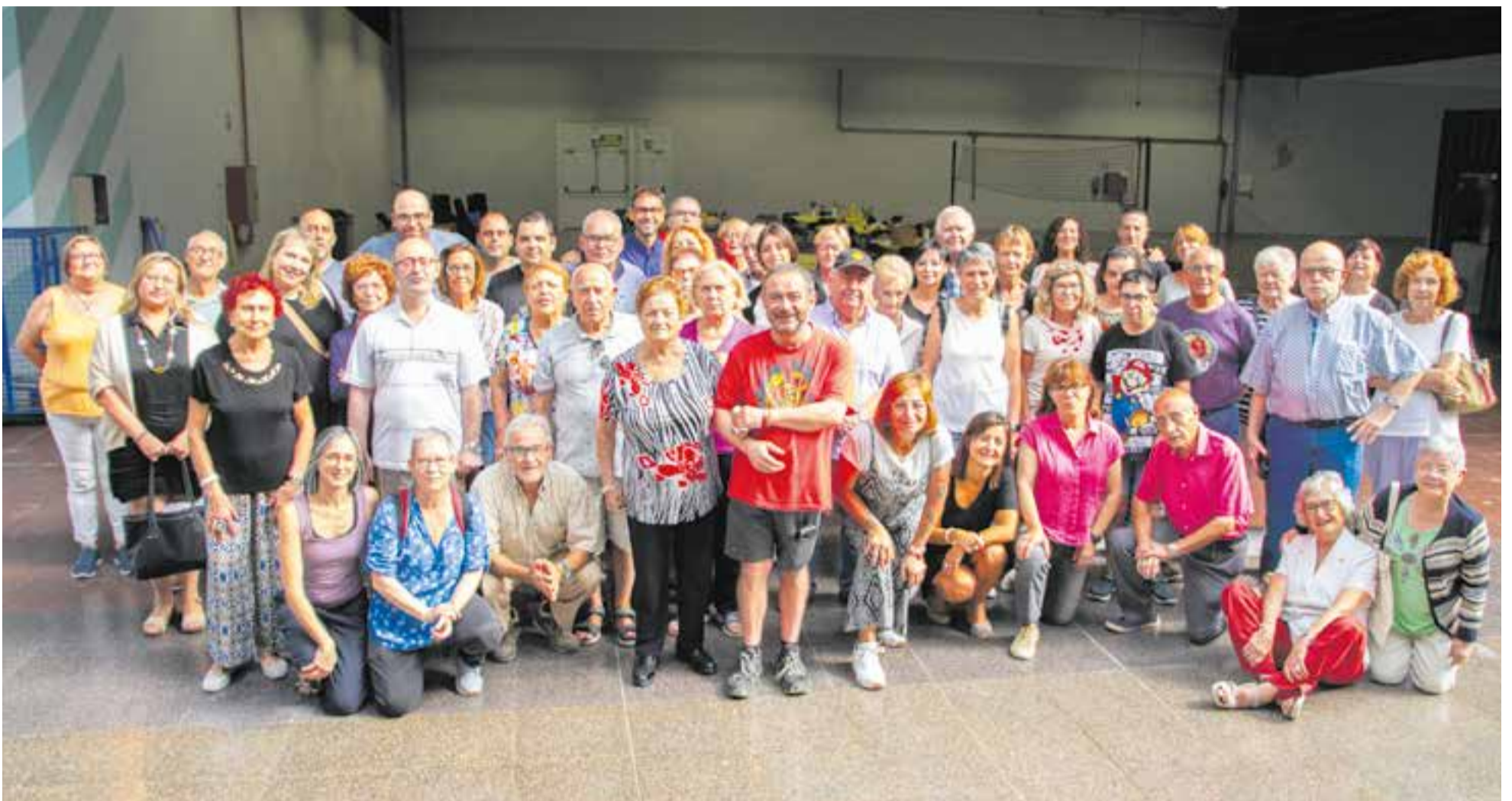
Els assistents a l'arrossada, dimarts passat, a l'Espai Tolrà: socis de l'entitat, usuàries i usuaris, i autoritats municipals. L'arrossada va ser elaborada per L'Amanidor de CIPO. || C. DÍAZ SALUT MENTAL | P 06

El 2022 s'han fet a Castellar 270 compravendes d'habitatges i 234 contractes de lloguer