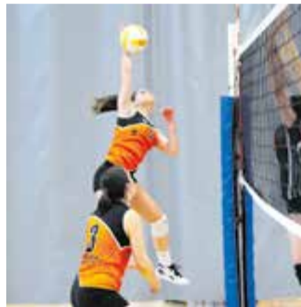
Primera victòria del femení en Lliga. || M. CASALS

L'equip femení d'Arnau Pérez s'estrena amb una victòria al tie-break contra el CV Salou, mentre que el masculí de Lucía Bregar torna a caure per tercera jornada consecutiva amb el CN Sabadell. Les de Pérez van sumar els primers dos punts després d'aconseguir superar per 3-2 (16-25/25-19/22-25/25-15/17-15) en el tie-break per 17-15, després d'un partit molt igualat a l'Espai Tolrà, contra un dels rivals més potents de la Lliga. En el cas del masculí, els de Bregar van caure per 1-3 (25-22/23-25/22-25/14-25) en el derbi vallesà contra el CN Sabadell, on tot i guanyar el primer set i estar molt igualat en el segon i el tercer, l'equip no va poder fer front als nedadors, que es van emportar el quart i definitiu per 14-25. + || A. SAN ANDRÉS