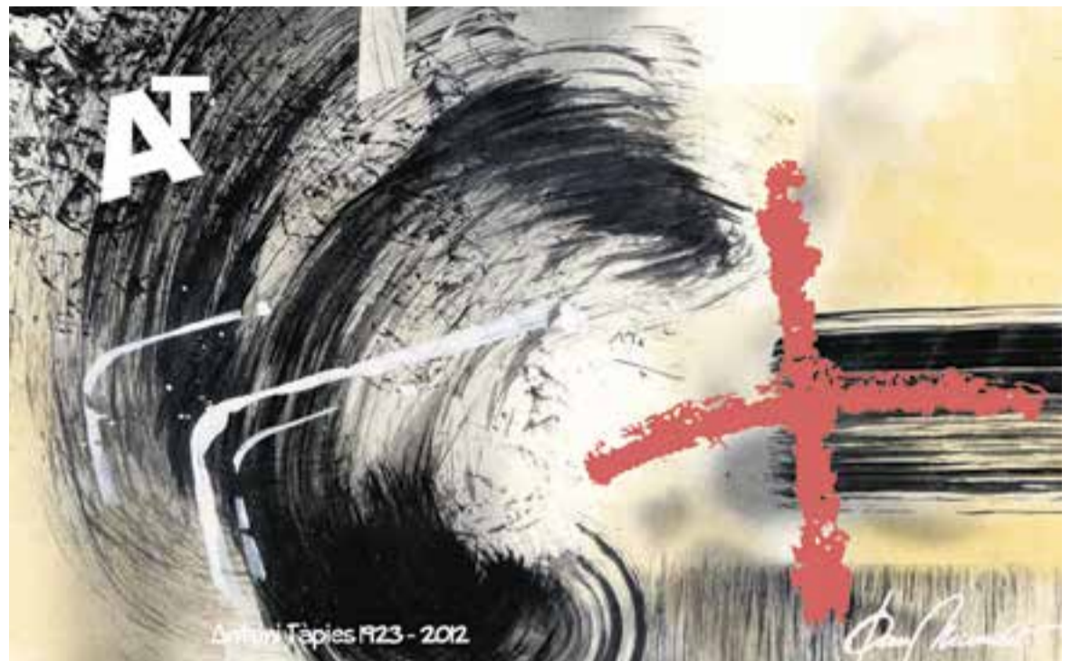
© Tàpies centenari. || JOAN MUNDET

“L'obra de Tàpies reflectí els problemes de l'ésser humà que s'han mantingut inamovibles”