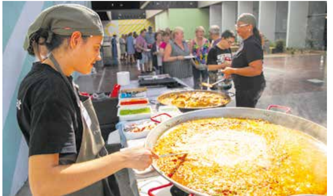
A dalt: arrossada a l'Espai Tolrà, dimarts passat, amb la comunitat que forma part de l'entitat per celebrar el 25è aniversari de Suport Castellar. A baix: inauguració del Club Social de Suport Castellar, fa vint anys.

Justament, una de les tasques que ha dut a terme l'entitat en aquests 25 anys és fer xarxa amb els agents socials, culturals i educatius de la vila. Per exemple, lideren un projecte que es desenvolupa als centres educatius de Castellar, tant de primària com instituts, en referència a la pedagogia i la sensibilització a les aules, per dotar d'eines i recursos els joves.