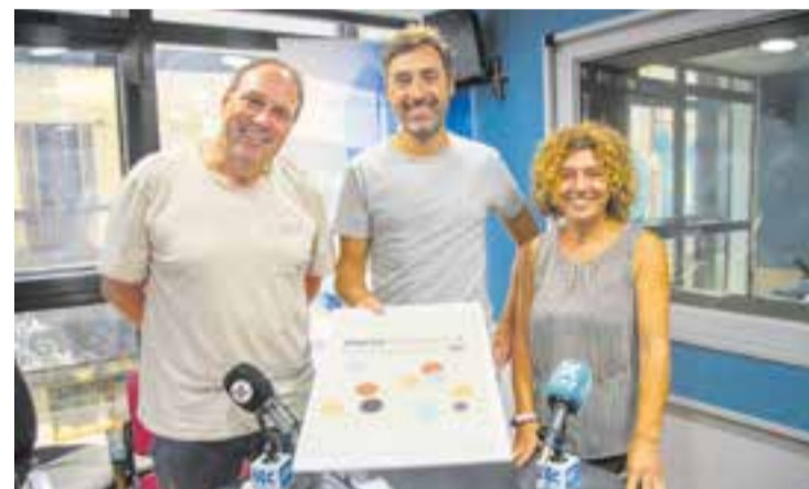
Part de l'equip de Ràdio Castellar encarregat de l'InfoPòdcast. || L'ACTUAL

Ràdio Castellar enceta, en col·laboració amb La Xarxa, l'InfoPòdcast de Castellar, una peça informativa que resumeix les notícies més destacades de la setmana a la vila. Es tracta d'una nova aposta de l'emissora municipal per generar continguts digitals en una nova era de la comunicació per als formats d'àudio. Amb una estructura àgil i dinàmica, en poc menys de 3 minuts, l'emissora municipal ofereix cada divendres a les seves plataformes (lactual.cat i a les seves xarxes a Facebook; Twitter, ara conegut com X, i Instagram) un pòdcast elaborat pels serveis informatius i presentat i conduït per Carles Díaz. Aquest divendres, es llançarà el segon capítol. De fet, el pòdcast no és un format aliè a Ràdio Castellar, aquesta temporada voluntaris de l'emissora aposten per aquest tipus de contingut en programes com Les Dames del Crim , Tres quintos o el veterà A les portes de Troia . † || REDACCIÓ