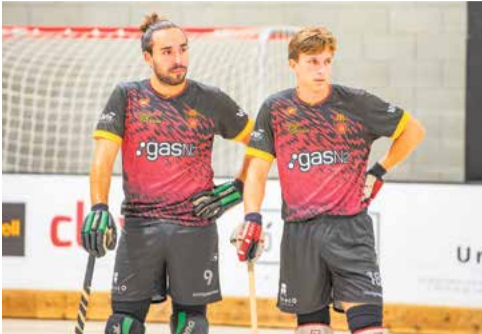
L'equip masculí no vol perdre de vista les places d'ascens a Nacional Catalana.

Després de tancar l'any amb la multitudinària presentació al Dani Pedrosa, l'HC Castellar torna a la competició aquest cap de setmana amb la disputa del partit entre el CH Ripollet i el sènior, amb l'únic objectiu de l'ascens a Nacional Catalana.