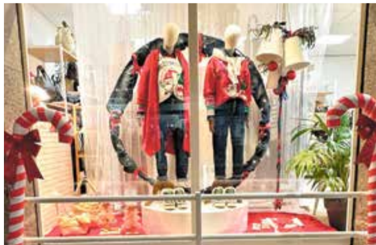
A dalt, l'aparador de Llullu Cakes i a sota, l'aparador de Sílvia Moda.

A més, entre totes les persones que van votar pel seu establiment preferit s'ha sortejat un val per valor de 100 euros que s'haurà de bescanviar a Sílvia Moda i Complementes en el decurs dels tres mesos següents a la data de lliurament de premis, que es donaran en els primers mesos d'aquest any 2024.