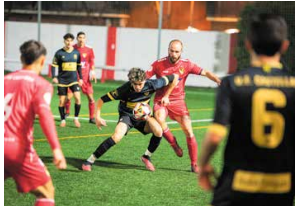
L'amistós entre el Castellar i el Terrassa va servir com a preparació per la jornada de diumenge.

Havent tancat l'any de la millor manera possible, la UE Castellar vol tornar a la competició oficial amb una nova victòria en un camp conegut, el de la Pirinaica, on es va deixar l'ascens fa dues temporades.