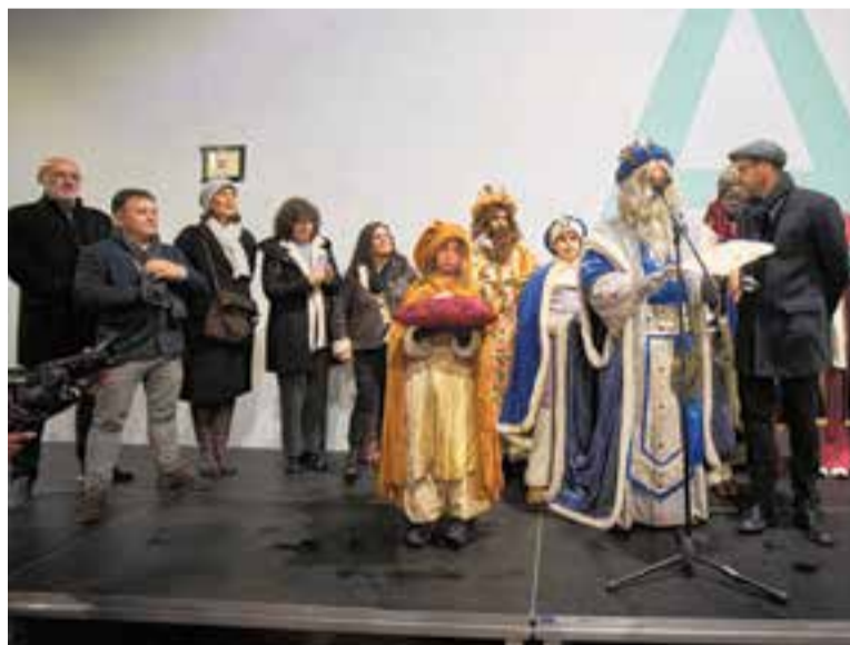
Intervenció del rei Melchior en presència de les autoritats municipals.