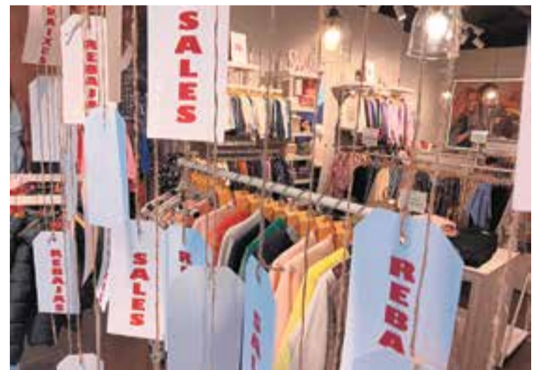
L'aparador de rebaixes de la botiga Herois Castellar.

L'Organització de Consumidors i Usuaris (OCU) recorda que en rebaixes el que han d'abaixar són els preus i no els drets. Un dels més clars és que els productes han d'haver estat en l'oferta de l'establiment durant almenys un mes i han de mostrar el preu original al costat del rebaixat, o bé indicar de manera clara el percentatge de la rebaixa. A l'hora de comprar, cal evitar les compres compulsives i conservar sempre el tiquet de la compra, necessari per poder reclamar.