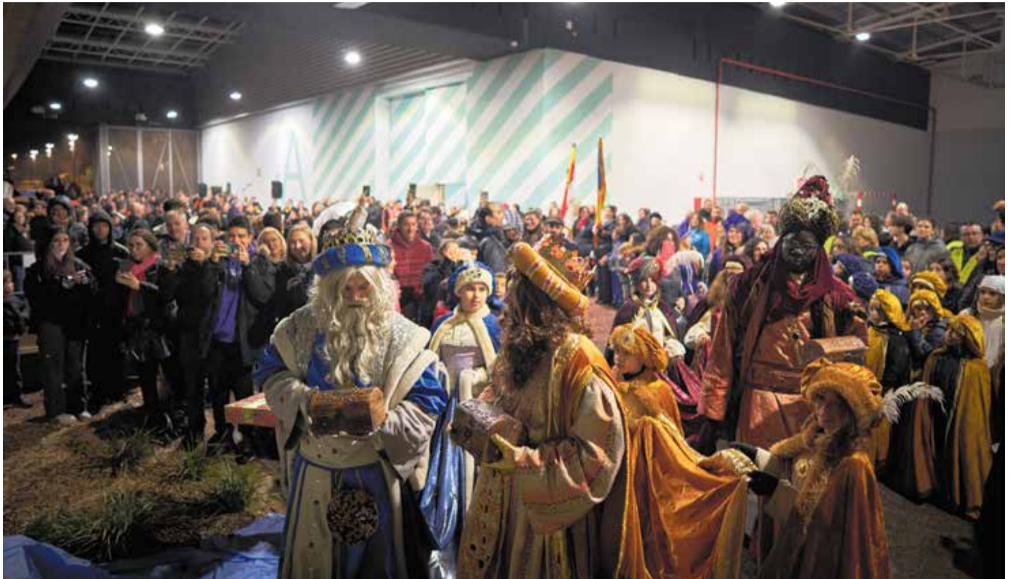
Ses Majestats els Reis Mags d'Orient, ja a l'interior de l'Espai Tolrà, s'acosten al naixement per oferir els seus presents envoltats dels castellarencs i castellarenques en una imatge inèdita a causa de la pluja.

La pluja va fer modificar el recorregut i traslladar a l'Espai Tolrà l'adoració i l'entrega de la clau màgica als Reis