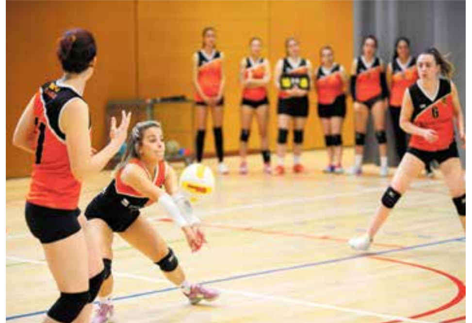
L'equip femení tindrà força difícil, tot i que no impossible, accedir a la fase d'ascens. || MARC CASALS

Amb dues i quatre jornades pendents per al masculí i el femení dels sèniors de vòlei de l'FS Castellar, l'emoció està servida per als dos conjunts, que volen lluitar per l'ascens i evitar la lligueta de descens.