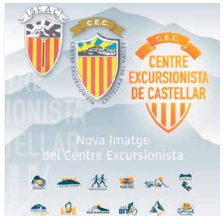
A la imatge, l’evolució de l’escut del CEC i els logotips actuals de les seccions. || CEC

L’objectiu del canvi d’imatge és el de mostrar una entitat moderna, actualitzada i oberta al poble, on les seccions també es vegin integrades a l’entitat perquè siguin fàcilment identificables. + || M. ANTÚNEZ