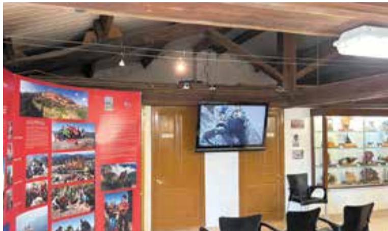
Exposició de pessebres de la Castellassa al primer pis del Grup Pessebrista. || J. J.

La majoria d'aquests pessebres es conserven a la seu del Centre Excursionista de Castellar i formen una col·lecció única i colorista. La xerrada es completarà amb una visita al primer pis del local del Grup Pessebrista on s'exposen els pessebres (o fotografies) que s'han pujat, fins a 58. ✦