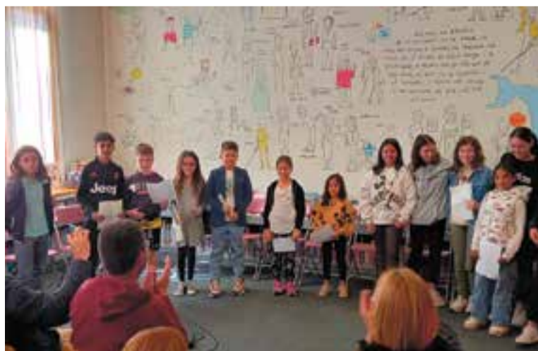
Un dels actes celebrats a la Biblioteca Municipal durant l'any 2023. || BIBLIOTECA

llibres, per a nens i nenes a partir de 9 anys. L'Atrapallibres és una iniciativa impulsada pel Consell Català del Llibre Infantil i Juvenil, que pretén coordinar les entitats integrants del Consell en tot allò que sigui d'interès i benefici comuns. També busca promoure, recollir, programar i executar projectes, iniciatives i accions que afavoreixin la promoció i difusió del llibre per a infants i joves, i la promoció de la lectura en la infància i el jovent, promoure també la reflexió, l'anàlisi i els instruments de coneixement sobre el llibre infantil i juvenil a partir de recursos diversos i, de forma molt especial, per mitjà de la publicació periòdica de la revista