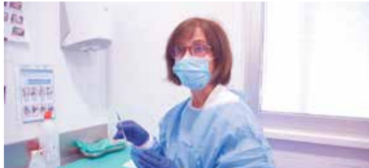
Imatge d'arxiu de la preparació d'una vacuna contra la covid al CAP Castellar

Segons dades del Departament de Salut, a la nostra Regió Sanitària la distribució de virus mostra que el de la grip és el més freqüent (38,2% de les