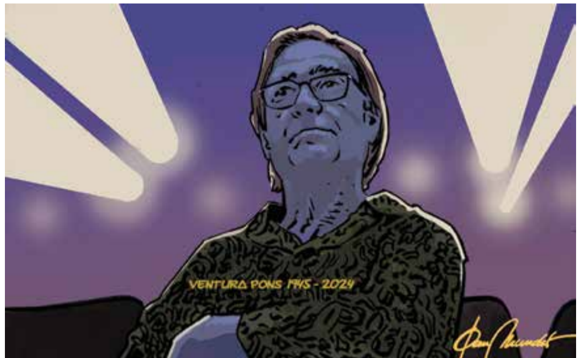
© Ventura Pons.

estripades ( Què t'hi jugues Mari Pili? , 1991) i pel·lícules d'autor que situen el text per sobre de l'artifici, com passa a l'adaptació de E. R. , de Josep Benet i Jornet ( Actrius , 1997). Totes aquestes pel·lícules interpretades per un repartiment d'actors i actrius consagrats (Anna Lizarán, Rosa María Sardà, Nuria Espert). La seva filmografia és una confirmació tardana d'una veritat negra que plana per sobre de la cultura catalana: no reconeixem gaire el nostre