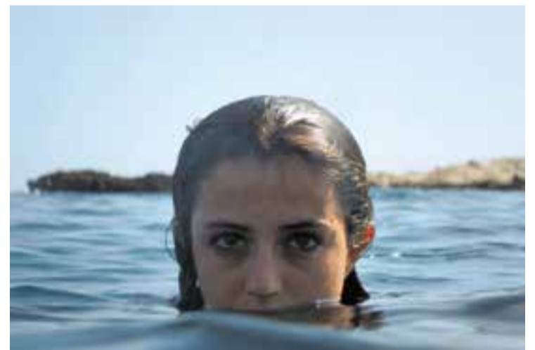
Fotograma de 'Creatura', la pel·lícula programada pel 21 de gener

A més, també s'ha previst que, des de finals de gener i durant tot el mes de febrer, tinguin lloc les projeccions del BRAM! escolar, que arriben a pràcticament a tot l'alumnat de la vila, des d'13 fins a 2n de Batxillerat. Aquesta iniciativa es du a terme a través dels serveis de la Guia Didàctica de l'Ajuntament. + || REDACCIÓ