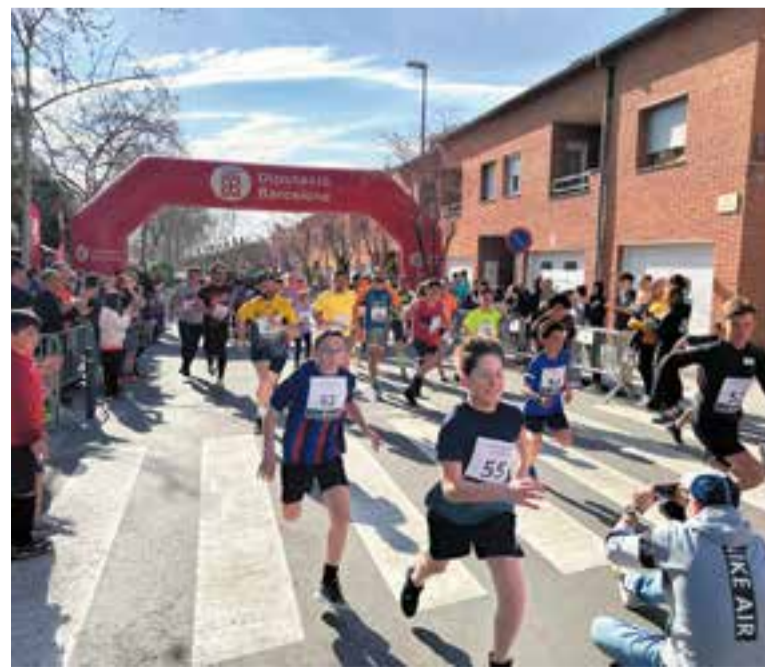
Una imatge de la cursa solidària de l'any passat.

L'any passat, prop de 160 persones van participar en la primera edició de la cursa, organitzada en aquella ocasió pels alumnes de 6è de primària i 3r d'ESO de l'Institut Escola Sant Esteve, una activitat que es va fer l'11 de març. Aleshores es van recaptar fons per a la neurorehabilitació infantil amb l'objectiu de facilitar la inclusió social. Els diners es van destinar a la Sala Puigverd, una entitat sense ànim de lucre que des de fa més de 30 anys atén famílies amb fills amb lesions neurològiques. La jornada va superar totes les expectatives, gràcies a voluntaris i col·laboradors. En aquest sentit, la Sala Puigverd va convidar a participar-hi persones amb tota mena de diversitat, que van compartir asfalt amb atletes del Club Atlètic Castellar, infants, mestres i desenes de castellarencs més. +