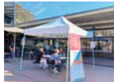
Punt informatiu al mercat.

Segons informen des del Consell Comarcal, hi ha algunes modificacions al que hi havia establert fins al 30 de novembre: d’entrada, la novetat principal és que s’allarga el termini de presentació de sol·licituds fins al 30 de juny del 2024. També s’augmenta la dotació econòmica de la convocatòria i, en tercer lloc, s’incorpora la possibilitat de sol·licitar dues bestretes per al programa d’ajuts a les actuacions de rehabilitació d’edifici: d’una banda, la possibilitat la