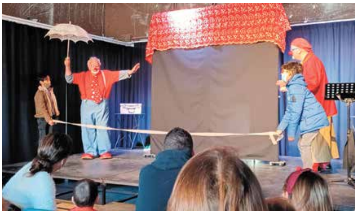
Moment de l'espectacle 'Muacs, petons de pallaso', que ja es va representar a l'Alcavot l'any 2022.

mentals tradicionals, s'examina la naturalesa del bé i del mal a través de les lluites del diable amb l'àngel Gabriel, "i afegeix una perspectiva contemporània sobre la tan freqüent infligida càrrega de dolor i sofriment de la humanitat als seus semblants", comenta Ruiz.