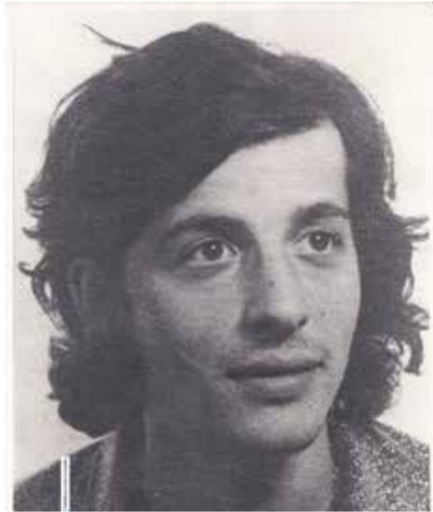
Enguany, fa 50 anys de la mort de Salvador Puig Antich; també en fa 100 del naixement de la ràdio a Catalunya.