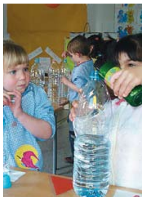
© P3 de l'escola Sol i Lluna fent experiments.