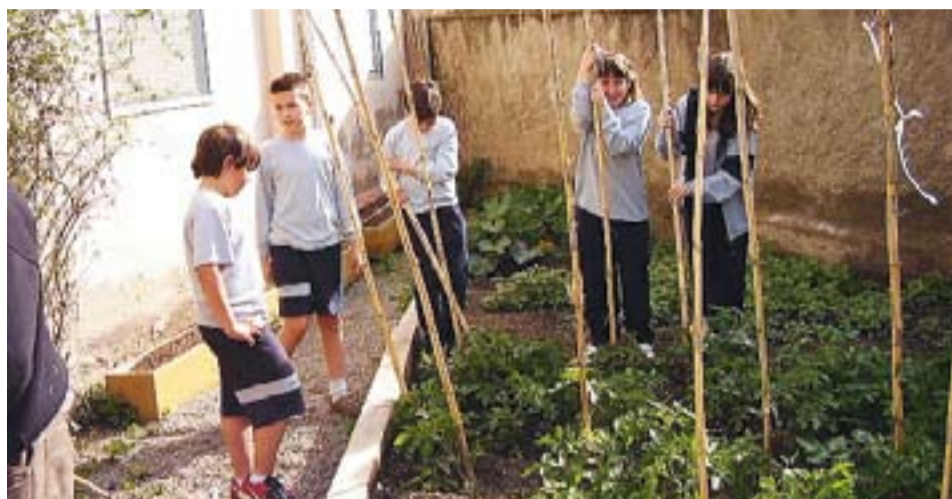
Alumnes de l'escola Immaculada, al pati de l'escola, on tenen cura d'un hort.