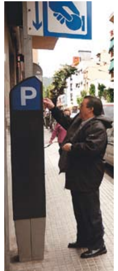
Parquímetre de Sala Boadella.

per aquest any 2008" , segons va explicar Lomas. Després, s'han aplicat els coeficients previstos a les bases del concurs públic d'adjudicació. Així s'han calculat unes quotes de més de 6.000 euros per l'aparcament, 2.300 per al supermercat i de prop de 200 euros per al bar. Des de l'oposició es va demanar la creació d'una comissió que d'aquí un any pugui valorar si les previsions aprovades "es corresponen amb la realitat" , i en cas que no sigui així, es reajustin les quotes "a l'alça o a la baixa" , segons Permanyer. +