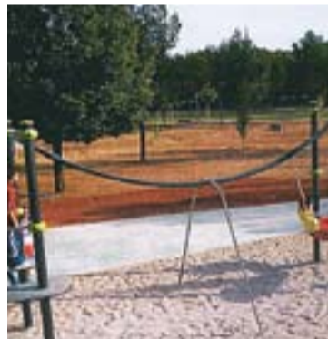
© Dos dels jocs escollits pels infants per a l'àrea lúdica. || CEDIDES