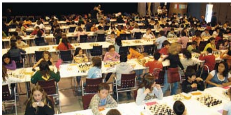
© Campionat d'escacs dels alumnes de 6è de l'Escola Sant Esteve, celebrat el 30 d'abril.