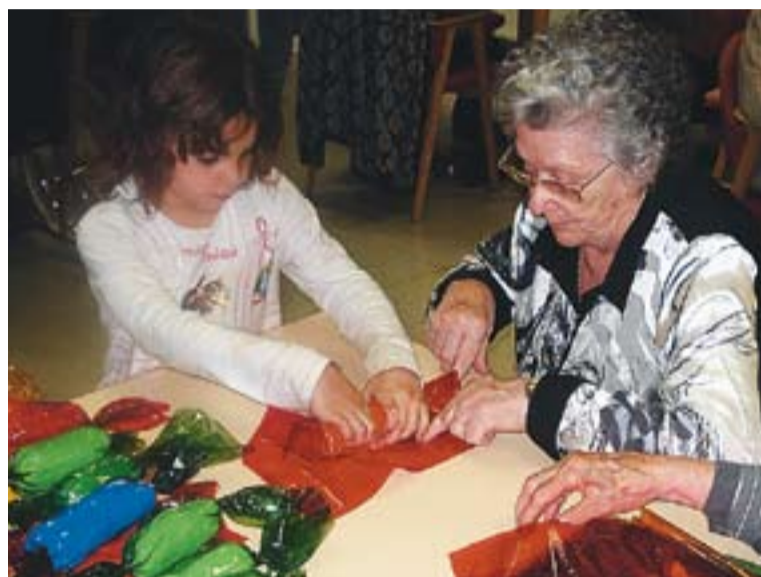
Àvies i infants van prendre part del taller d'engalanament i festes que organitza l'Obra Social Benèfica.