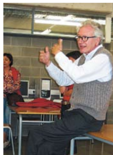
© Xerrada "Mirant el cel", a l'IES Puig de la Creu.