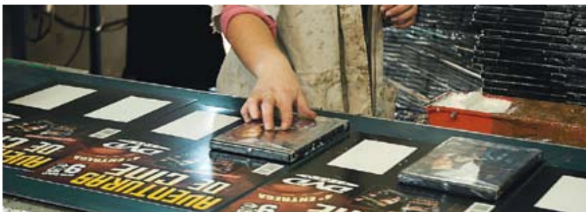
Part d'una de les cadenes d'embalatge que funcionen al TEB Castellar.

La plantilla del centre de Castellar del Vallès es mantindrà íntegrament