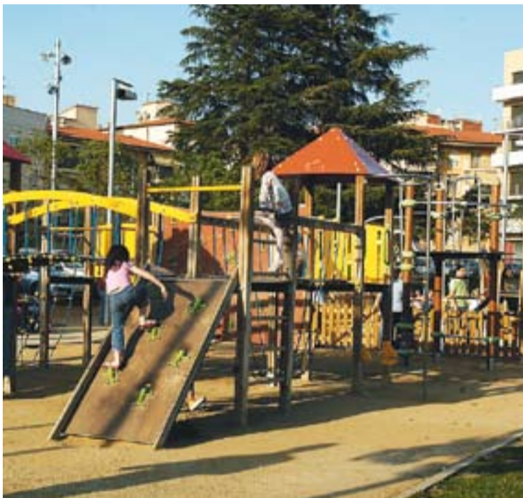
Una imatge de la zona lúdica de l'Espai Tolrà.

Ara els partits polítics i el Consell Escolar hauran de posar en marxa aquest futur Consell. En aquesta comissió, hi participarien els nens i nenes de 5è i 6è de primària del municipi. +