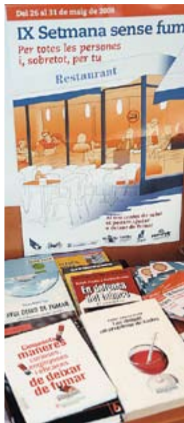
Taula informativa del tabac.

El passat dilluns es va presentar la Setmana Sense Fum, que s'ha allargat fins dissabte. Es van distribuir diversos materials a la Biblioteca, Serveis Socials i Salut, DPEIO i Ajuntament. S'hi poden trobar cartells de la semFYC (Sociedad Española de Medicina de Familia y Comunitaria), díptics informatius elaborats per la Federació de Salut Comunitària de Catalunya, punts de llibre i uns fulls on, tothom qui ho vulgui, pot escriure-hi les seves reflexions, els seus comentaris, les opinions que li suggereix la setmana i, fins i tot, poemes.