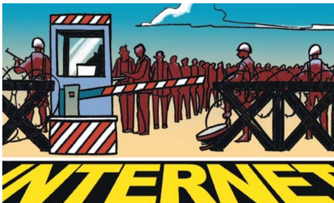
© Nous horitzons. || JOAN MUNDET

Avui, una connexió a Internet, entre naps i cols, no costa menys de 35 € al mes. Telefónica, una empresa privatitzada que encara gaudeix de tants privilegis com prestigi entre els seus clients (potser perquè cap empresa de comunicacions ha pogut mai competir-hi en igualtat de condicions en telefonia fixa), ho fa per