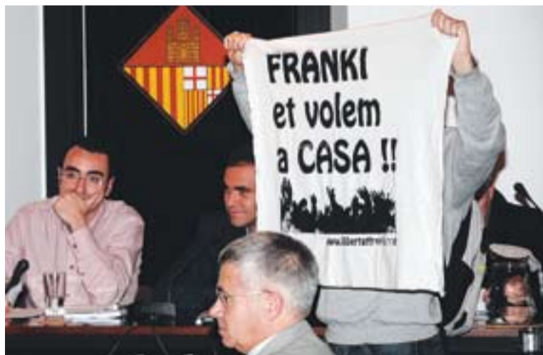
© Un membre de l'Assemblea mostrant una pancarta en defensa de Franki. || J.G

Francesc Argemí, conegut com a Franki, va protagonitzar part del ple municipal. El grup municipal de L'Altraveu va presentar una moció, a instàncies de l'Assemblea de Joves de Castellar, en la qual es reclamava la llibertat de Franki i l'abolició del delictes d'ultratge a la bandera. Durant la lectura del text, tres membres de l'Assemblea van mostrar unes pancartes en el mateix sentit, i es van repartir fulletons informatius al respecte.