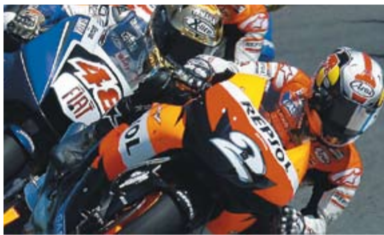
Pedrosa ocupant la primera posició del pilot.

La resistència de Pedrosa va permetre al castellanenc esgarripar uns valuosos 16 punts que el despenen del rival més immediat de Valentino Rossi. Els altres pilots, com Stoner i Lorenzo han d'arriscar més, ja que es troben a més de 25 punts -una cursa de diferència- de l'italià.