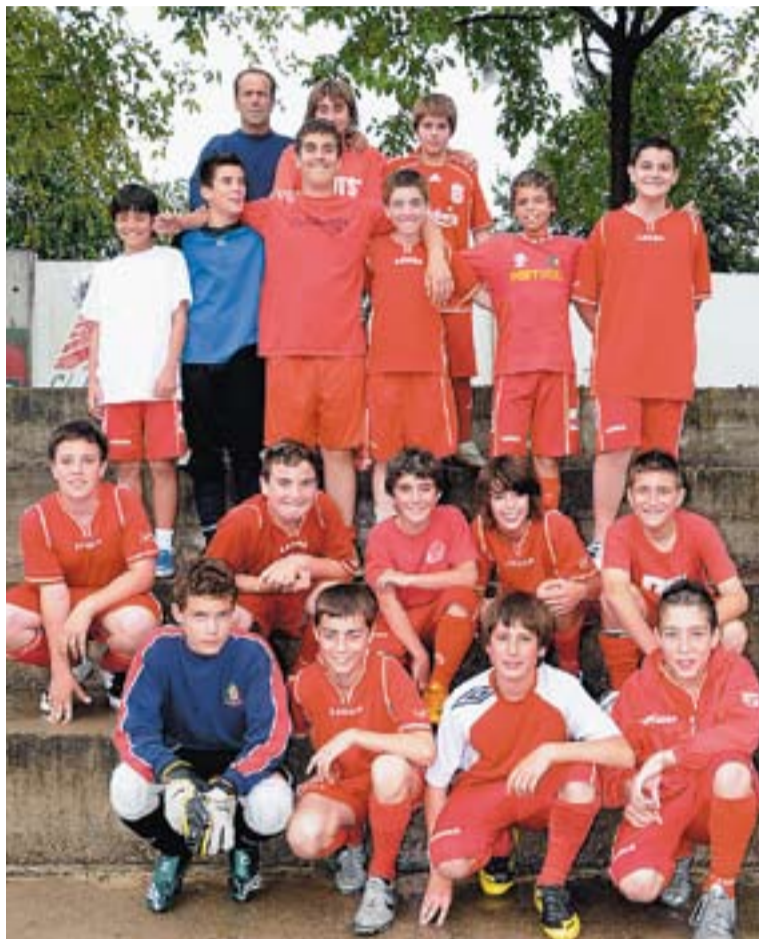
L'equip infantil espera confirmar l'ascens a Primera Divisió.

L'INFANTIL CONTÉ L'ASCENS || Un dels equips que participarà al Torneig Joan Cortiella, l'infantil 'A', està esperant que la Federació Catalana de Futbol comuniqui oficialment tots els ascensos i descensos en les categories de base. En joc, hi ha la plaça dels infantils castellarencs per jugar a Primera Divisió la temporada que ve. L'equip de Paco Jiménez va fer la feina després de vèncer en l'última jornada sense problemes. A partir d'aquí necessitaven que el Ripollet guanyés al Cercle Sabadellenc per avançar l'equip sabadellenc a la classificació i així va ser. L'equip infantil 'A' del Castellar ha estat segon de grup. Millor dit, el dotzè millor segon de Segona Divisió. En teoria, pugen els setze millors segons i per tant, l'equip infantil és oficialment equip de Primera. Només falta la confirmació, que no s'allargarà més endavant del dia 16 de juny. +