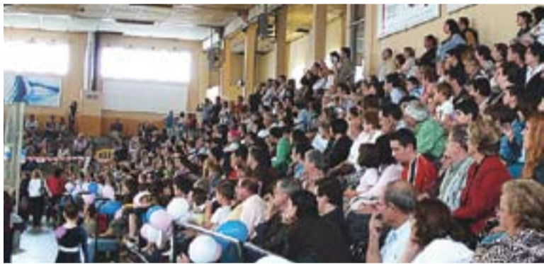
L'aspecte del pavelló Joaquim Blume, diumenge.

Prop de 120 patinadors i patinadores en el Festival de Patinatge Artístic que es va fer a Castellar