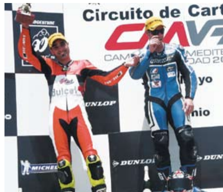
© El castellanenc amb el trofeu com a segon classificat. || X-BIKE

Okada, que va finalitzar penúltim però va poder recollir les primeres sensacions. Malgrat patir molts problemes de tracció en la màxima inclinació de la moto, Okada va destacar que on s'aprofita més el nou motor és en la zona màxima de revolucions, precisament allà on està fallant Honda ara. Pedrosa es decantarà aquests dies per un motor o altre.