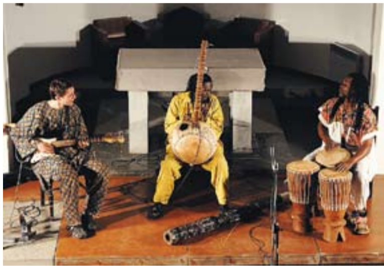
© Moment del Concert de Kora abeteata a la Capella. || JOSEP GRAELLS

La sorpresa del concert, però, encara havia d'arribar. Els nens i nenes de la Coral Sant Esteve van ser convidats a pujar a l'escenari per compartir dues peces amb Kora abeteata. Van demostrar que les seves veus poden tenir, també, el color de l'Àfrica.