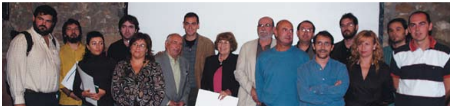
Foto conjunta dels premis del certamen literari Joan Arús 2007.

Els qui vulguin participar a l'apartat de novel·la han de presentar entre 60 i 150 pàgines, a doble espai. L'obra ha de ser escrita en llengua catalana i ser inèdita. En