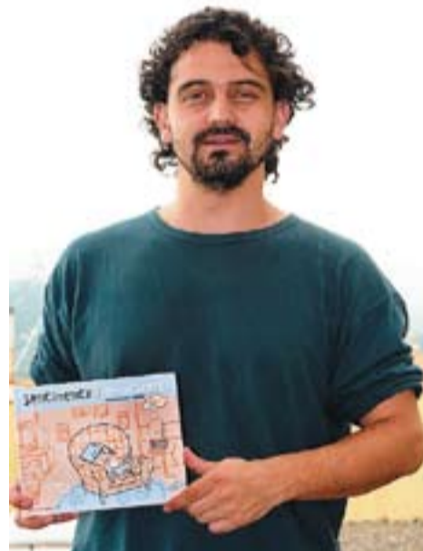
© Dani Coma amb un llibre de cançons.

L'objectiu principal de Poesies amb suc és donar a conèixer, tant a mestres com a pares, el material que s'ha fet per infants i fer-lo útil i manejable. Mercè Galí ha il·lustrat el llibre, fet que encara el fa estèticament més bonic. +