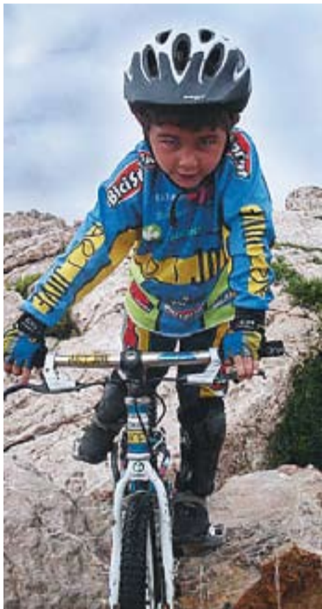
© Alan Rovira a l'Escala. || CEDIDA.

L'Escala era una superfície diferent a les altres, d'aquelles que per la dificultat ja acostuma a agradar als pilots. Les zones estan fetes sobre la roca de platja que es troba a la zona de La Punta, al passeig marítim de l'Escala. Un terreny normalment humit, on encara hi havia més perill de relliscades diumenge, ja que tota la prova es va disputar sota la pluja. I Alan Rovira va vèncer amb 29 punts i va deixar al segon