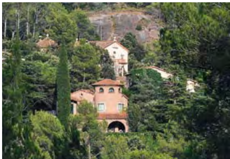
© Imatge de Les Arenes. || JOSEP GRAELLS

El dissabte 6, a dos quarts de dues del migdia, s'ha preparat una sessió d'aquagym a la piscina de la urbanització. A les set de la tarda començarà la cercavila i la corrandà. Ja és tradició que també es faci la presentació del nou batlle de les Arenes. Hi haurà un pregó i es cantarà l'himne de les Arenes. A les deu de la nit hi haurà un sopar de germanor i el ball de Festa Major.