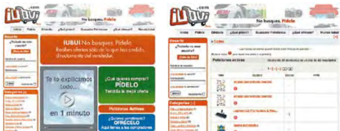
© La pàgina web www.iubui.com .