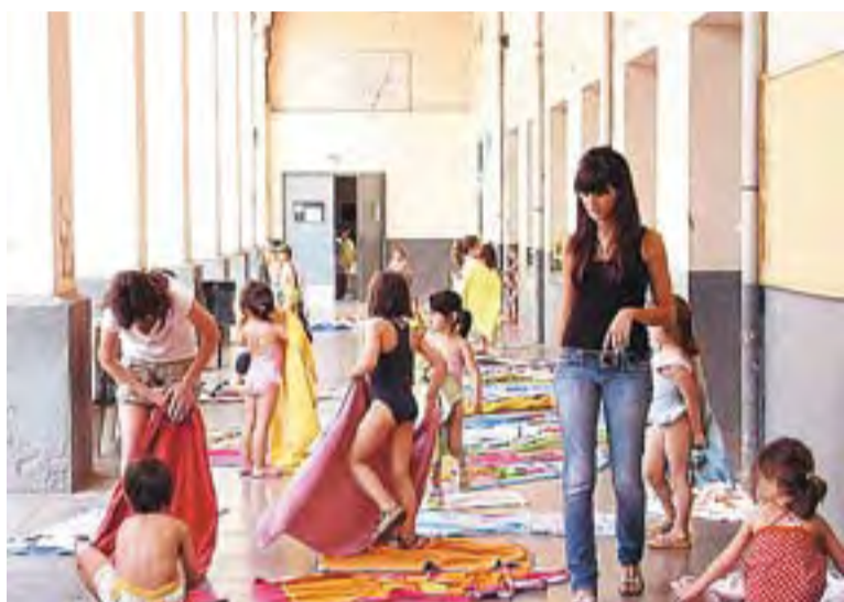
© Imatge dels casals de La Immaculada. || CEDIDA