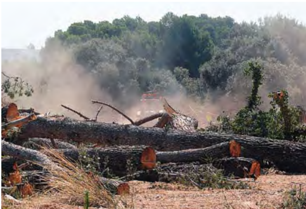
La tala d'arbres és una de les primeres actuacions que s'han fet al polígon de Can Bages.