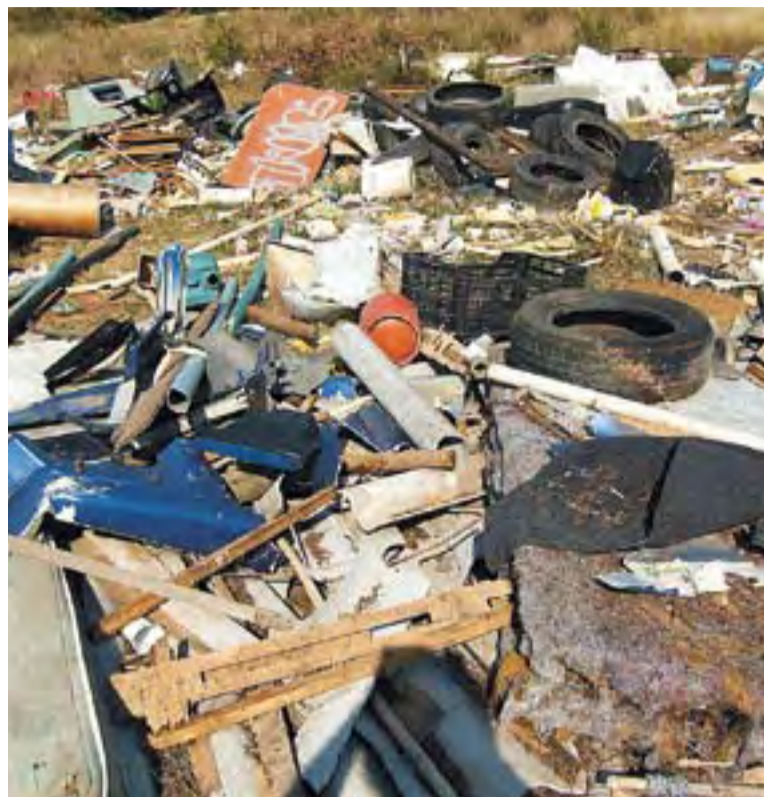
© Un dels abocadors detectats a Can Bages per la Plataforma. || ATUREM CAN BAGES