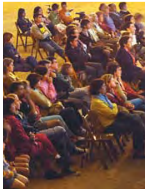
Cinema a la fresca a la plaça Catalunya.

Pel que fa al cinema, els assistents que van acudir a la plaça Catalunya, han vist les pel·lícules Un funeral de muerte , El ultimatum de Bourne , El Orfanato i Cobardes . L'as-