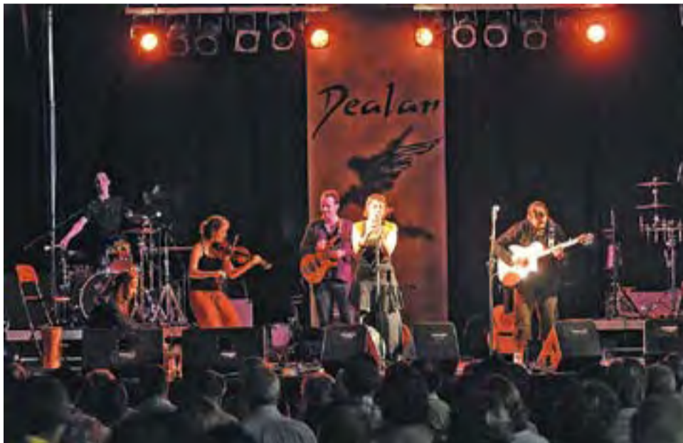
Actuació del grup celta Dealan a les Nits d'Estiu d'aquest passat juliol.