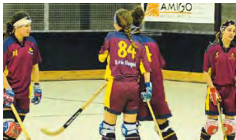
© Les castellanques jugaran a la categoria esperada. || J.G.