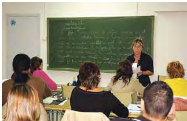
Una imatge d'arxiu d'una aula de l'Escola Municipal d'Adults.

L'escola ofereix un cicle de formació instrumental, ensenyaments inicials en català, castellà, anglès i informàtica, un curs de preparació per a les proves d'accés a cicles formatius de grau mitjà i de grau superior, el curs de preparació per a les proves d'accés a la universitat per a majors de 25 anys, graduat de secundària per a adults, tallers de dinamització sociocultural i un curs per a nouvinguts. Al matí, al centre oferirà un curs d'anglès i, "en funció de com vagi la demanda, també hi haurà un curs de graduat de secundària per adults" , explica la directora de l'Escola Municipal d'Adults, Antònia Pérez. De tota manera, l'oferta formativa s'acabarà perfilant una vegada es completi el procés de matriculació.