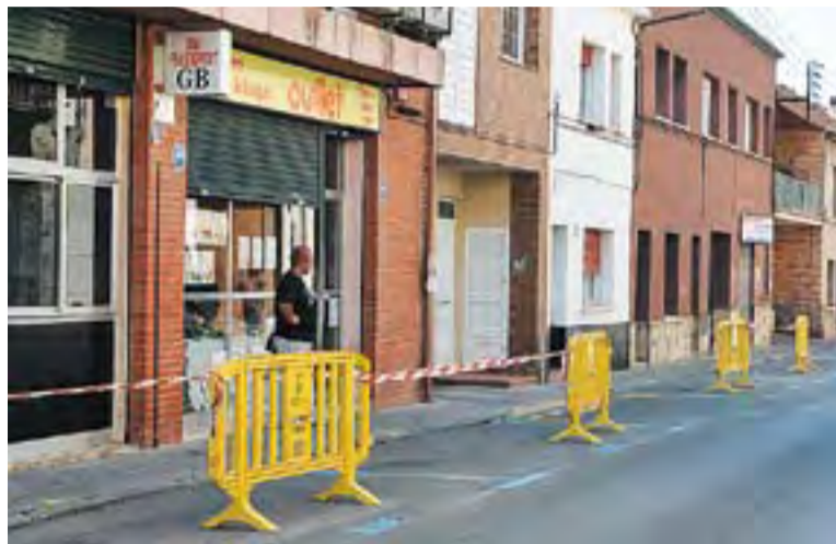
⊙ El carrer Hospital és una de les vies que tindran noves places de zona blava.