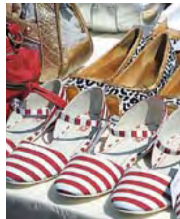
La trobada de puntaires i la Fira d'Estiu de l'any passat.