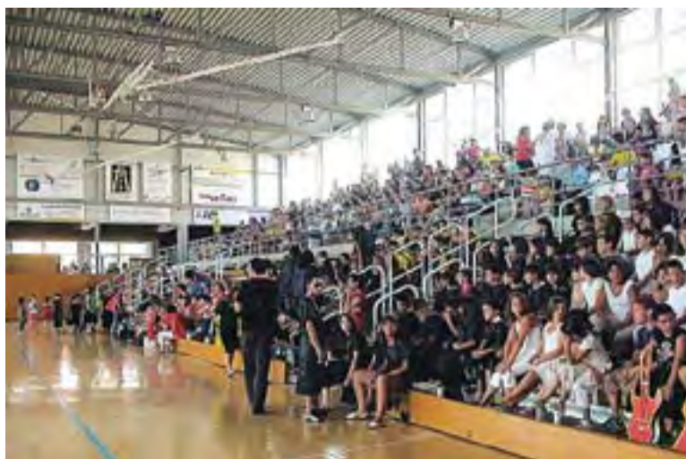
La festa final dels casals d'estiu organitzats per l'Ajuntament.

i que ha estat impossible poder contactar amb ells per a conèixer les dades d'assistència final.