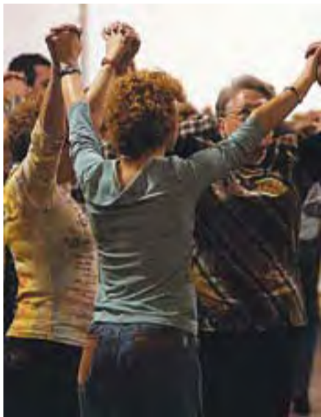
Moment d'una ballada de sardanes.