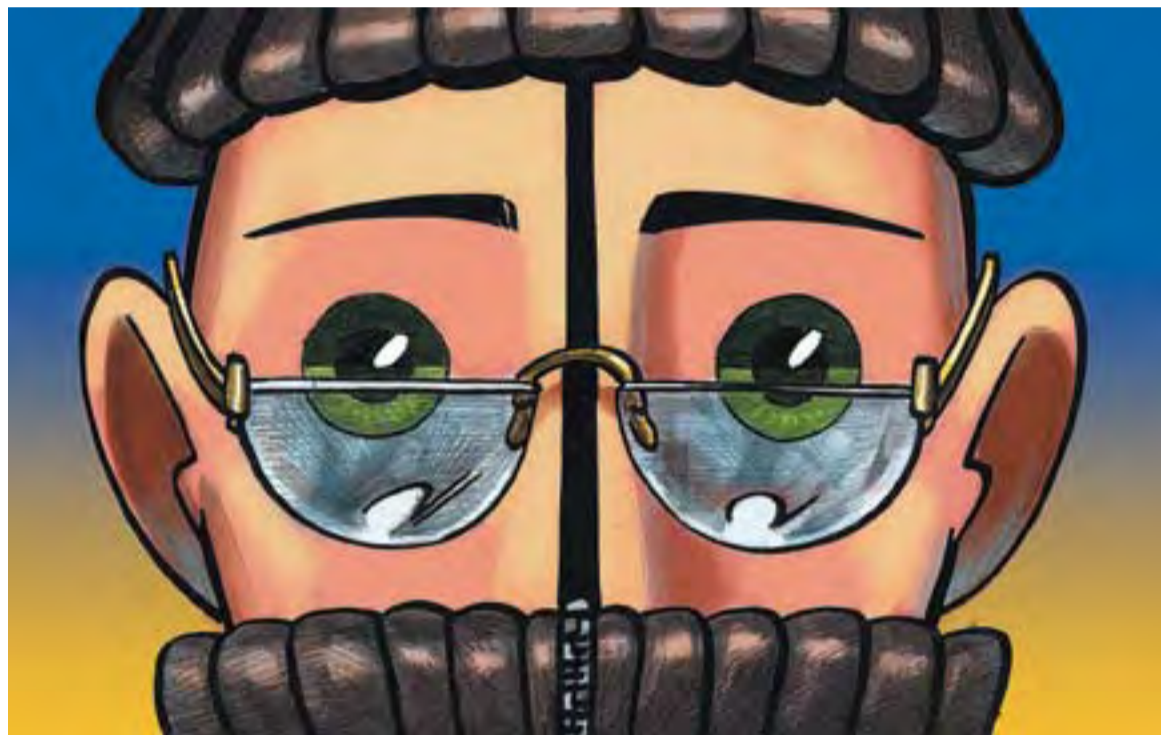
© La raça humana i els humans. || JOAN MUNDET

Cap d'aquests enginyers millora la situació de la dona perquè el problema del sexisme no rau en el llenguatge sinó en la societat. Si volem posar-hi fi hem de canviar la realitat, no pas el llenguatge que els parlants hem utilitzat durant segles. Faria bé la ministra de lluitar per la igualtat, enfrontant-se a les causes reals de la desigualtat i oblidant-se de voler incloure noves paraules al diccionari. ✦