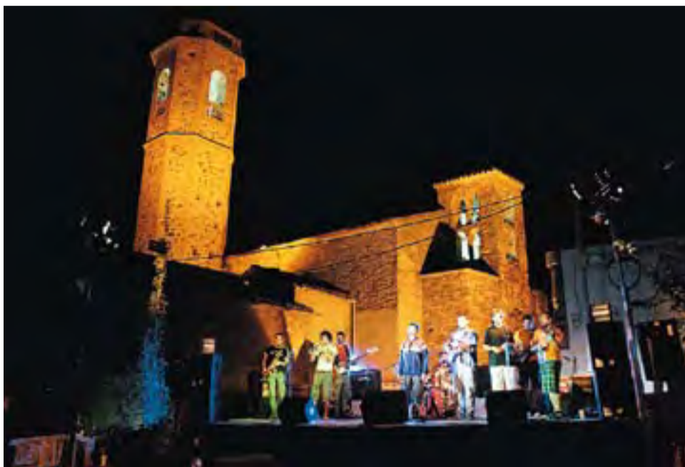
El concert de La Tropa, Van de Vinatxo i X-Anima.

A les cinc de la tarda es van iniciar els jocs inflables al Camp d'en Serrat i el correfoc, que va començar a les deu.