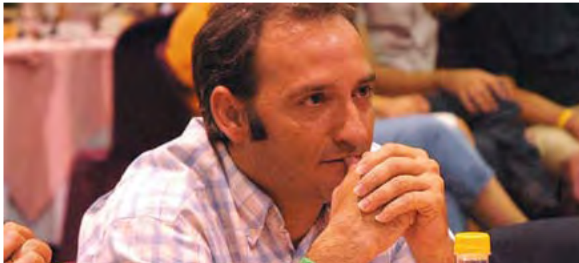
© Xavi Romance ja pensa en preparar l'inici de temporada amb l'Athlètic Castellar. || JOSEP GRAELLS

INTENCIONS || L'Athlètic Castellar ja s'ha començat a entrenar