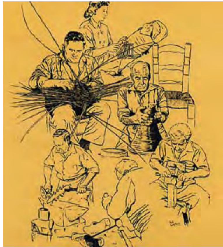
© Placa commemorativa que es col·locarà el proper 14 de setembre. || CEDIDA

Des de fa quatre anys, aquesta mostra se celebra a l'Espai Tolrà, fet que ha millorat i engrandit l'aforament i distribució de les parades i ha permès un millor accés del nombrós públic que hi assisteix any rere any. ✦