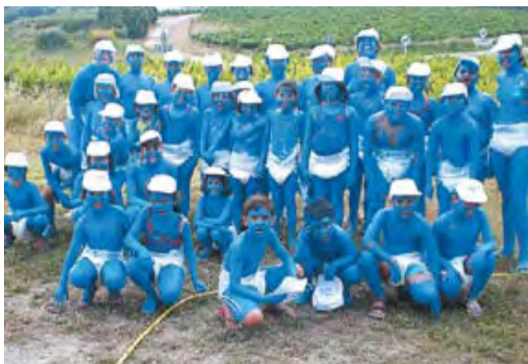
© Imatge de les colònies del Moviment de Colònies i Esplai. || CEDIDA

L'Esplai Sargantana, que depèn del Centre Excursionista de Castellar, també ha programat casals durant el mes de juliol, tot