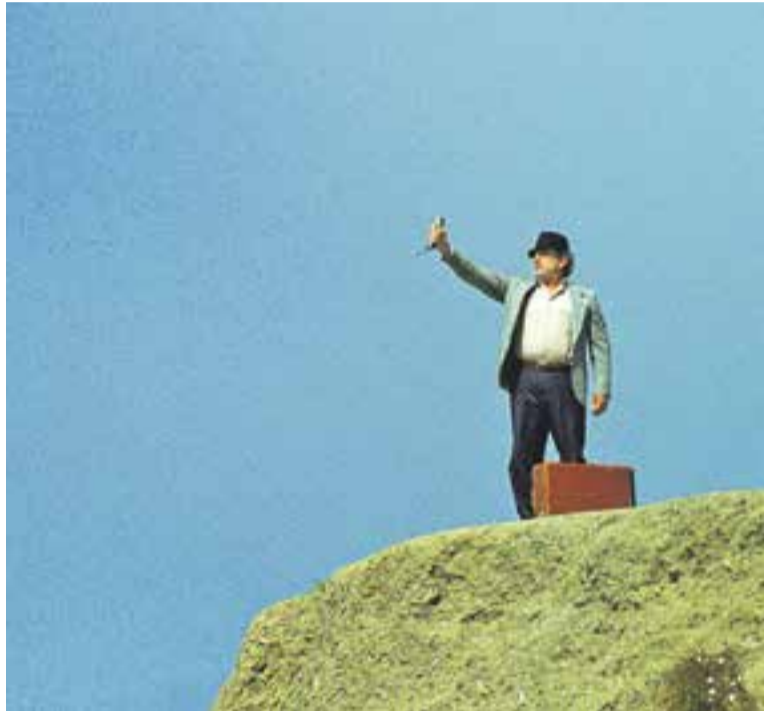
Una fotografia de la pel·lícula 'Toastmaster'.

PREMIS I RECONeixEMENTS || Toastmaster ha obtingut ja alguns reconeixements, entre els quals el premi del públic a la Mostra de Cinema Armeni de Los Angeles, i tres distincions al Festival de Cinema de Màlaga. En ser una pel·lícula rodada als Estats Units amb la comunitat armènia, per tant, amb presència de trets culturals diferenciats, suscita respostes molt diferents segons el país o la regió on es projecta. Malgrat tot, allà on s'ha projectat ha aconseguit el reconeixement del públic i la crítica, i el director confia que aquí també tindrà una bona rebuda. De moment tot l'equip està molt content amb la trajectòria: "Totes aquestes bones crí-