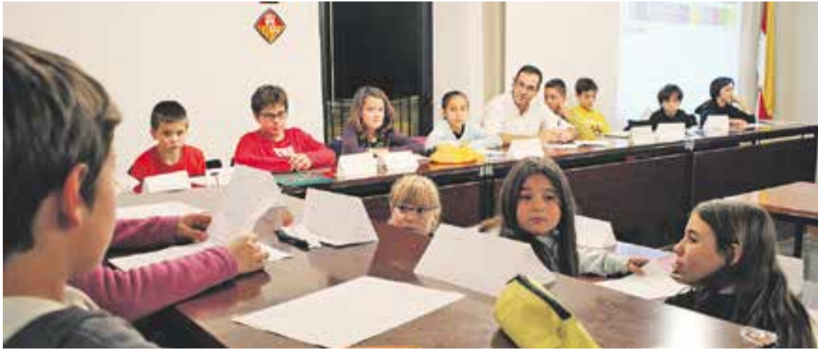
Primera sessió del Consell d'Infants 2014-2015 a Ca l'Alberola.