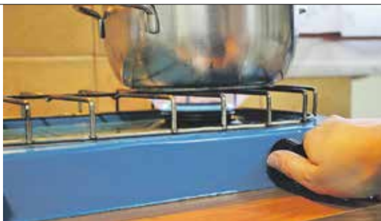
Un fogó portàtil en una casa de Castellar del Vallès.

Els indicadors per detectar un a mala combustió dels aparells és d'una banda, el color de les flames que canvia de blau a groc, i no és estable, o si apareixen taques grogues i marrons al voltant de la