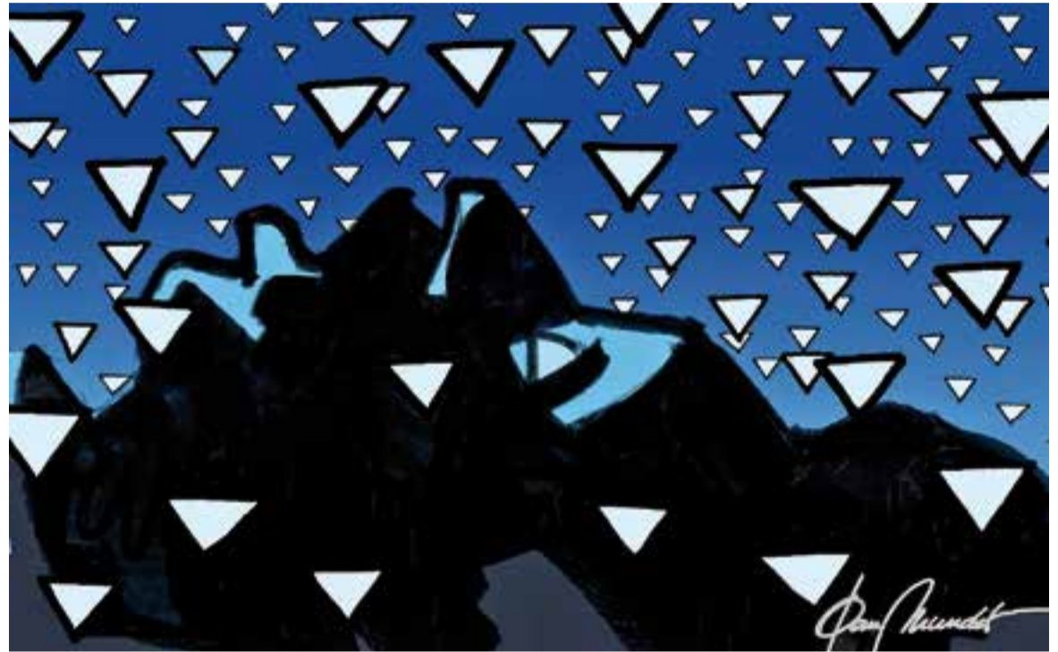
© La mateixa pedra. || JOAN MUNDET

de valors on no hi entra la violència de gènere. Tranquil·la, vaig seure a esmorzar. Davant, el diari, que anunciava que avui, 25 de novembre, es recordava que al llarg d'aquest any