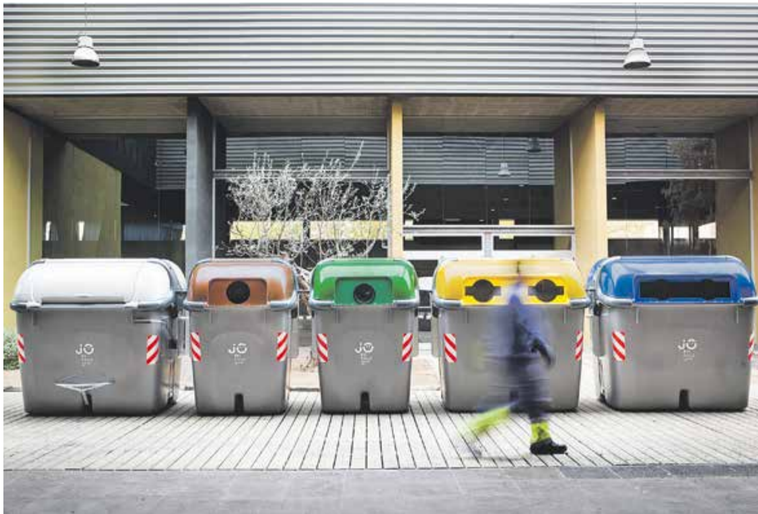
Filera dels cinc tipus de contenidors que es començaran a instal·lar als carrers de Castellar a partir de l'1 de desembre.

FER DISSABTE || L'empresa concessionària Fomento de Construcciones y Contratas (FCC) posarà en marxa a principis de desembre un