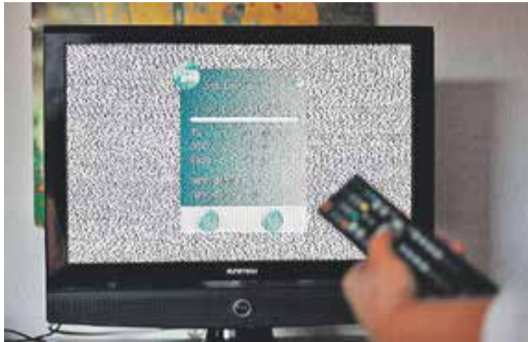
Una espectadora resintonitzant els canals de la TDT a casa seva.

COM ES RESINTONITZA || En la majoria de televisors la sintonització es fa de manera automàtica. Només s'ha de buscar amb el comandament la tecla "menú" i seleccionar "instal·lació" o "configuració" (segons els models) i situar-se a l'opció "buscar canals" o "sintonització automàtica de canals". Després d'una estona, tots els canals apareixeran a la llista i només s'hauran d'ordenar segons les preferències de cada usuari. En televisors més antics la recerca no és automàtica i s'ha d'anar buscant un per un.