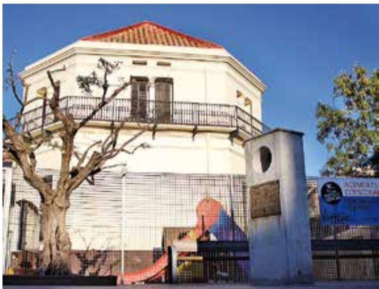
Detall i vista general del monòlit situat a la ctra. de Sentmenat.