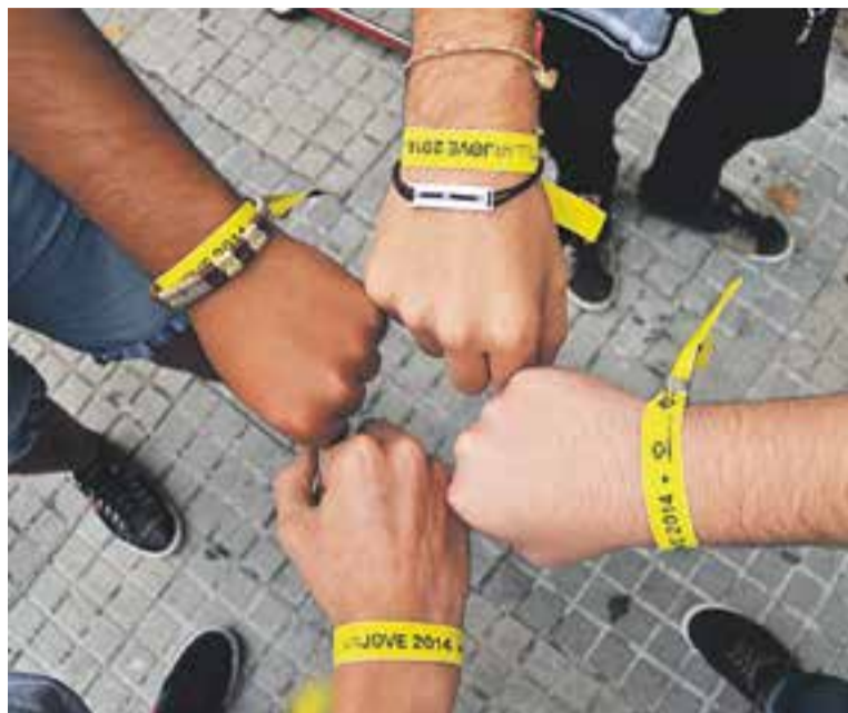
Joves de Castellar amb les polseres grogues.