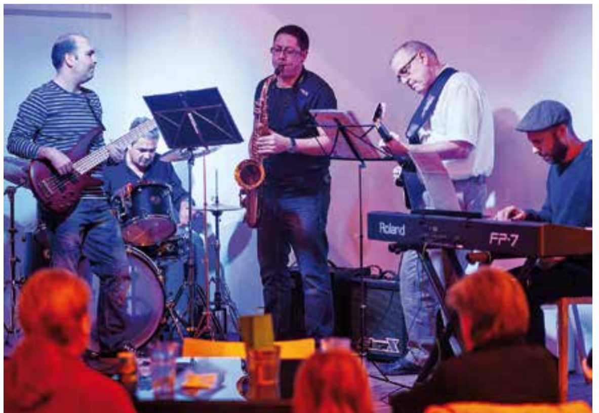
© El combo adult de funk i jazz de Torre Balada, en el concert de Santa Cecília, dimecres passat. || Q.PASCUAL

MÉS MÚSICA || Dijous passat va ser el torn de les guitarres, que en format combo, van convidar al públic del Calissó a viatjar per països com Macedònia o Irlanda, a l'hora que també van interpretar peces catalanes i temes de música moderna a ritme de pop i funk. Aquest vespre, a partir de les 19 hores, tindrà lloc el darrer concert en motiu de Santa Cecília. El Cor de Gospel de l'EMM Torre Balada, que va néixer fa dos cursos, serà l'encarregat de tancar la programació especial a Cal Calissó. +