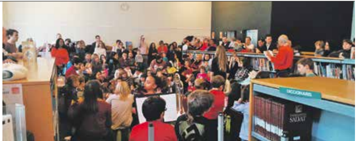
Un moment de L'hora del conte, dissabte passat a la Biblioteca.

història dels instruments musicals, a la vegada que n'anaven repassant els diferents sons. Va ser a través del llibre gegant El conte dels instruments , fet pels alumnes d'Artcàdia, i que va narrar un avi amb la col·laboració de la seva néta. + || REDACCIÓ