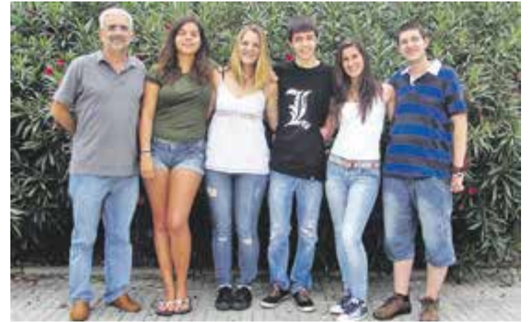
© Els alumnes autors del vídeo amb el seu professor, Albert Alfonso || CEDIDA