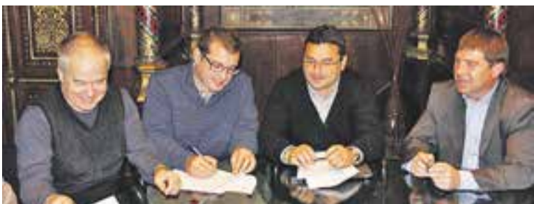
Els representants polítics de Castellar i Sabadell signen l'acord.

una comissió formada per tècnics dels dos ajuntaments que han permès definir exactament els límits de l'àmbit territorials de cada municipi. Segons informen des de l'Ajuntament de Castellar, des que el passat mes de gener Castellar va aprovar iniciar l'expedient per establir els límits del seu terme, ja s'ha signat l'acord de delimitació amb el municipi de Sant Llorenç Savall i, dijous, amb el de Sabadell. Restaran pendents els de la resta de municipis limítrofs (Matadepera i Terrassa, amb qui ja s'està a punt de signar, i Sentmenat, municipi amb el qual es continuen els treballs tècnics). El procés de regularització del terme municipal s'inclou dins els treballs de revisió del nou Pla d'Ordenació Urbanística Municipal. El punt de partida d'aquests treballs han estat unes actes de replanteig que daten del 1880, segons detallen fonts municipals. || R. G. +