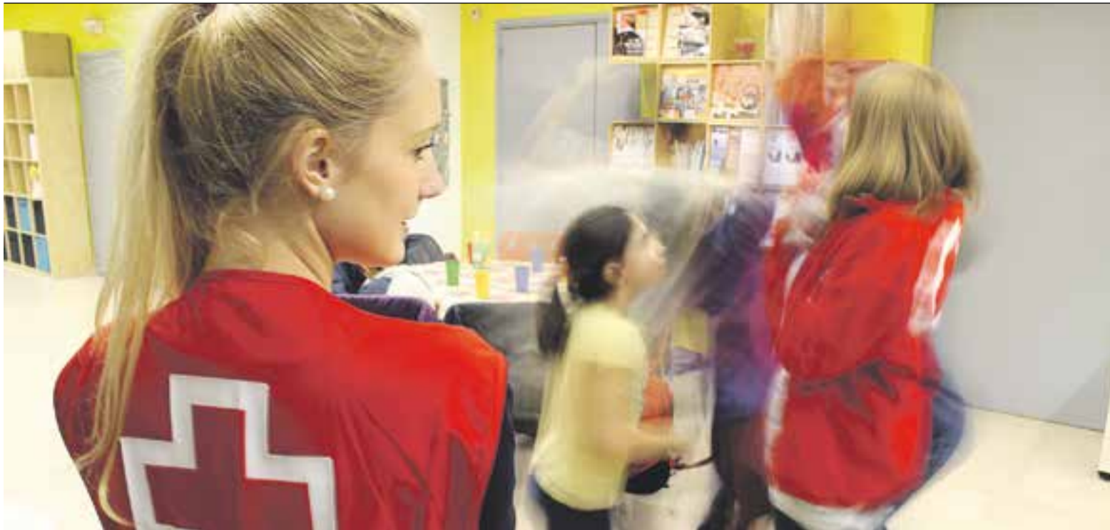
© Fins que s'arrangi el local de la plaça Llibertat, el projecte d'Èxit Escolar es fa al local del PIPAD, a la plaça Major. || C. DÍAZ