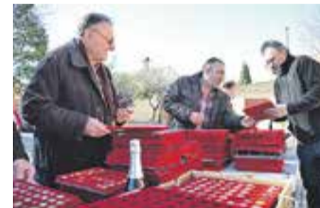
© Un moment de la trobada. || O. MORENO

La trobada va tenir una gran afluència de públic i s'hi van aplegar col·leccionistes del Vallès i d'arreu de Catalunya, com Sabadell, Terrassa, Barcelona, Vic, Tona, Navàs o Roda de Ter. + || O. MORENO