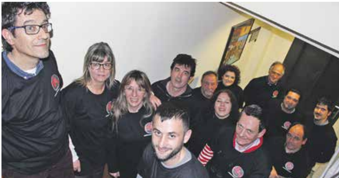
Membres de la RAF després de l'assemblea que fan cada dilluns a Cal Botafoc.

El col·lectiu Recerca Activa de Feina (RAF) arriba al seu primer any de vida