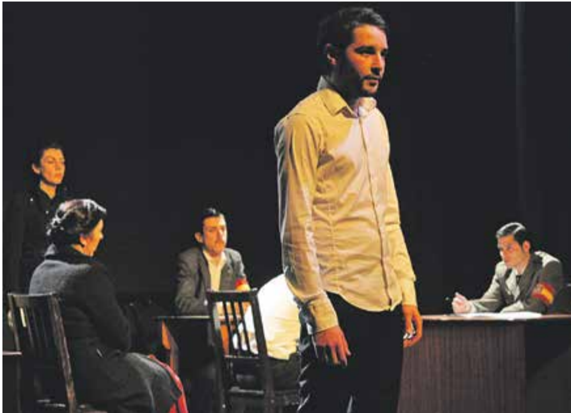
Una escena de 'Les trompetes de la mort'.