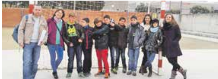
© Ryrko amb alguns alumnes. || ARXIU

Alumnes de sisè, pares, mares i mestres es van voler reunir amb molta