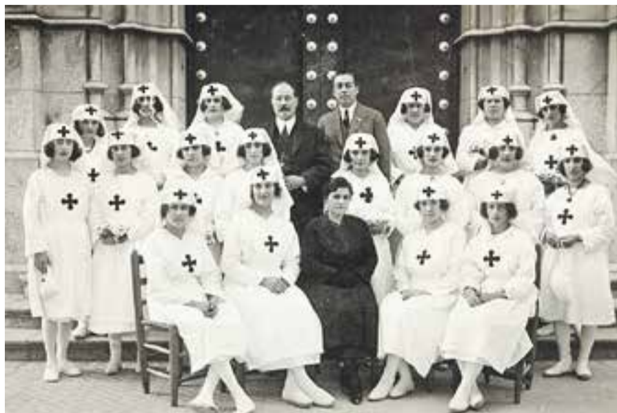
AUTOR: ALBERT RIFÀ FONTS: FAMÍLIA QUER-VILARDELL

CADA SETMANA, UN NOU FASCICLE DEL COL·LECCIONABLE AL TEU QUIOSC, PAPERERIA O LLIBRERIA