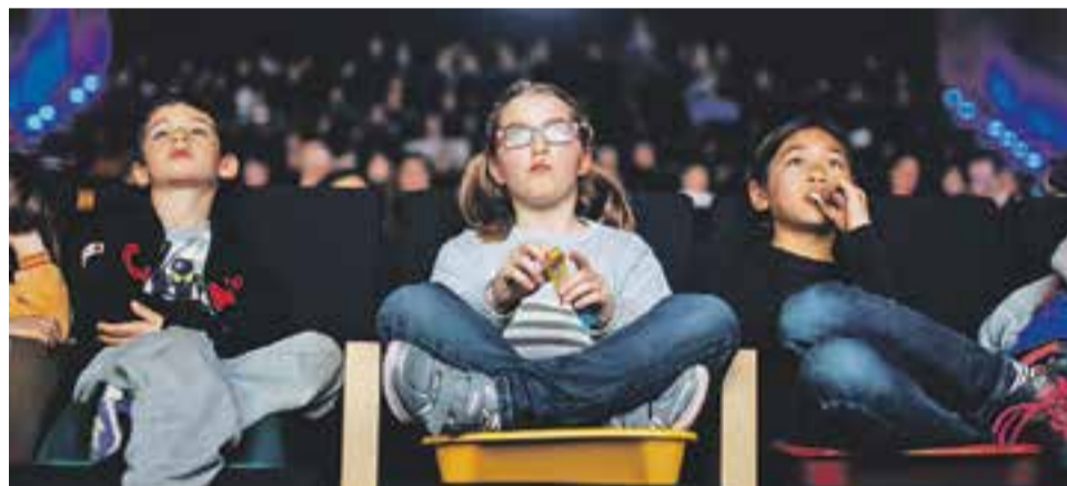
© Tres imatges d'infants que van participar al BRAM! d'aquest any. || Q. PASCUAL

vestíbul de l'Auditori també hi havia reservat un racó de lectura pels nens i nenes que preferien llegir i estar més tranquils.