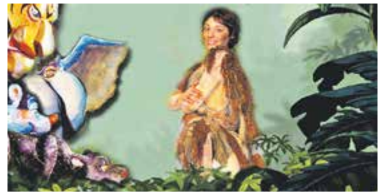
© El decorat de l'obra està pintat a unes teles. || CEDIDA

El retorn de 'Les trompetes de la mort' es va embolcallar d'un públic receptiu i entusiasta, que va sortir satisfet després de les funcions. Aquells que vulguin fer memòria i entendre el que van passar les víctimes de la guerra civil, encara són a temps de veure la representació teatral aquest cap de setmana, quan es duran a terme les dues últimes funcions. +