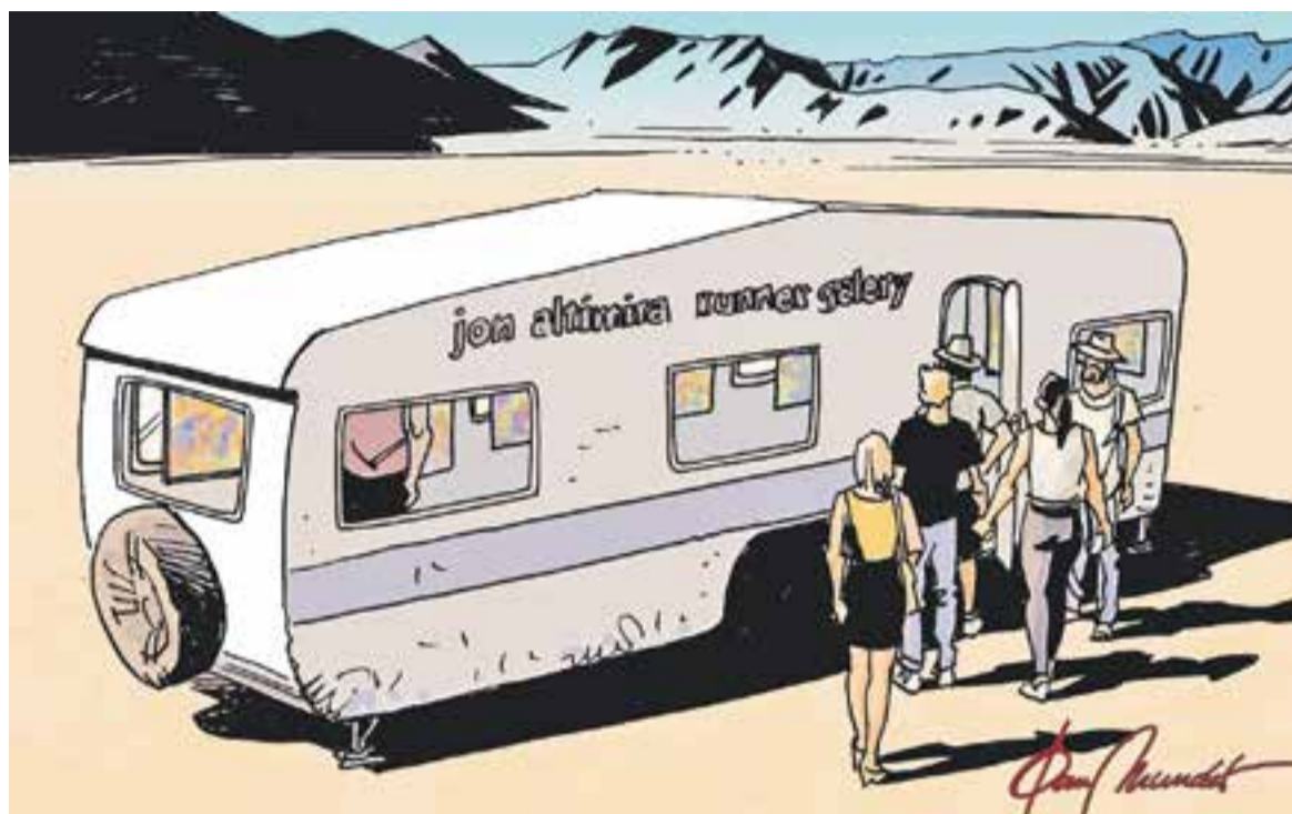
© Runner gallery. || JOAN MUNDET

ART-HOME que és així com s'anomena la casa-vitrina, esdevé una casa on s'hi viu i que es visita. M'hi porta el meu nebot, jutge de l'audiència de Liège quan li dic que m'agradaria exposar a