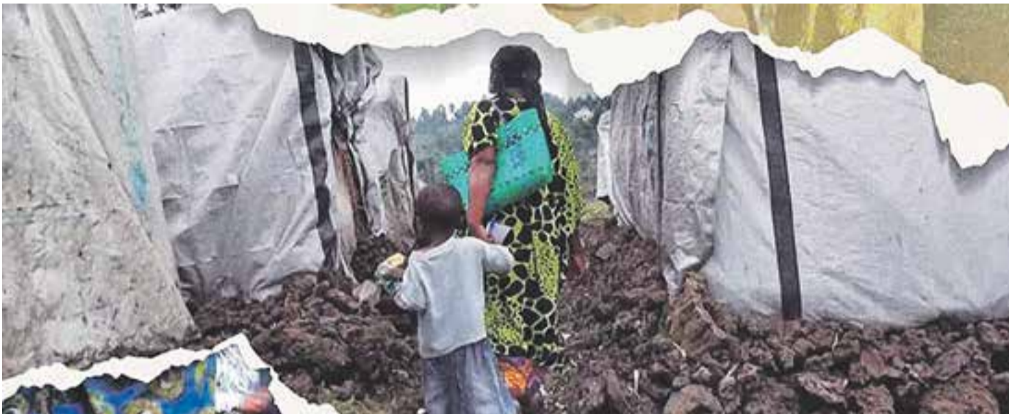
© Fragment del cartell promocional de "Uchungu Na Tumaini", documental que es projectarà el proper 12 de març || CEDIDA

Cinema, teatre, tallers i música commemoraran fins el 13 de març el Dia Internacional de la Dona