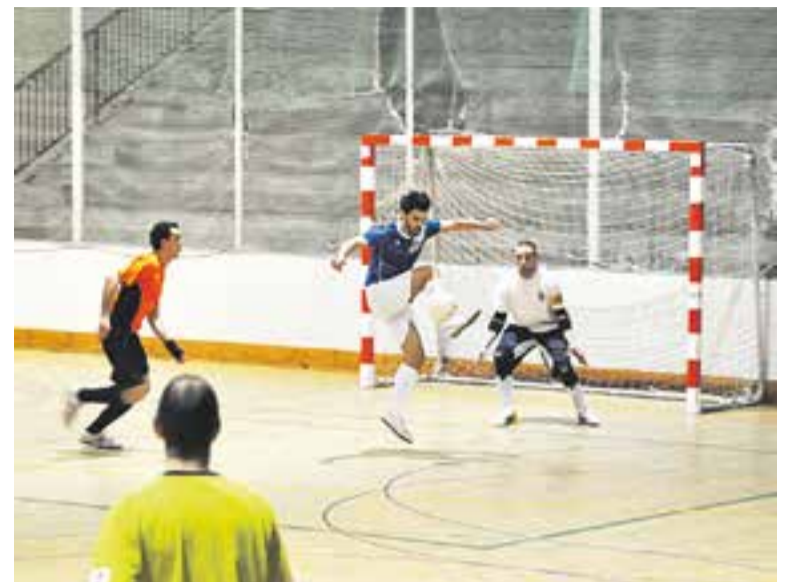
L'Arenys va aprofitar els errors defensius del FS Castellar.

“No només és el problema de la defensa, ja que ens han marcat a la contra que és com ens fan molt de mal. Treballarem molt per canviar la situació” va afegir Jiménez. +