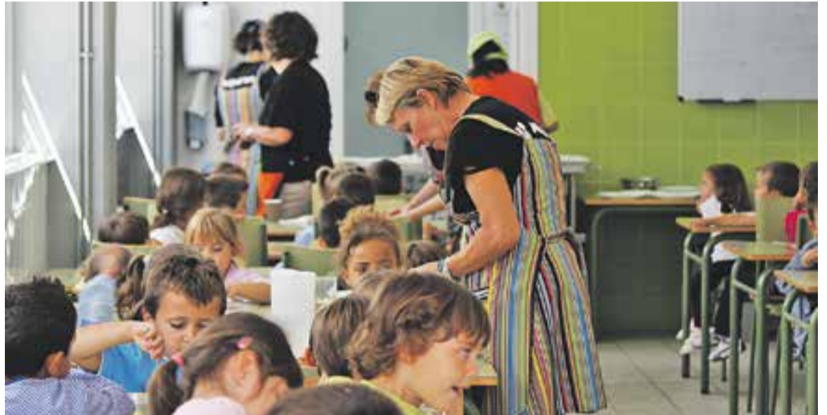
Unes monitores servint el dinar en el menjador de l'escola Sant Esteve.

EL SAD I EL PIPAD || D'altra banda, el Servei d'Atenció Domiciliària (SAD), un servei a domicili adreçat a persones amb manca d'autonomia, va ser utilitzat l'any passat per 91 usuaris, Quant al Punt