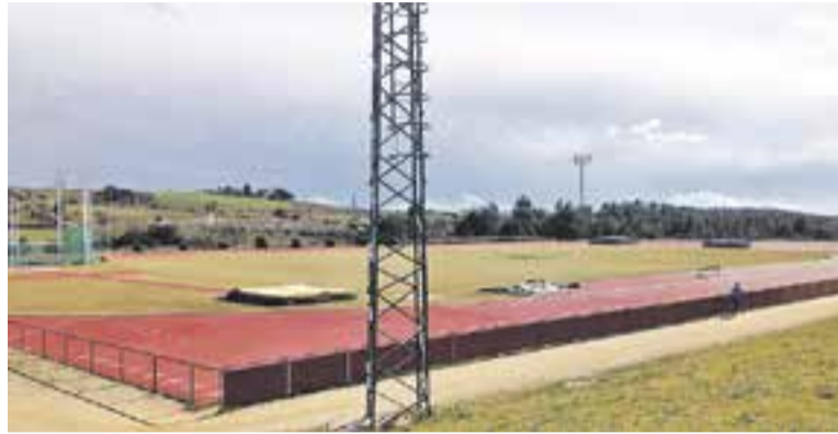
Imatge actual de les pistes d'atletisme.