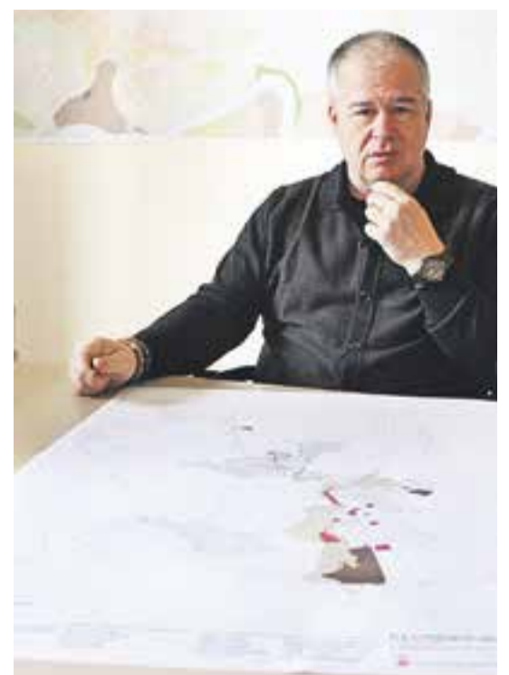
© Pepe González, regidor comissionat del POUM. || J. RIUS

El Catàleg de Béns a Protegir recull més de 200 elements de Castellar a conservar, preservar, protegir i posar en valor perquè formen part del patrimoni arquitectònic, arqueològic, ambiental, paisatgístic i natural de la vila. +