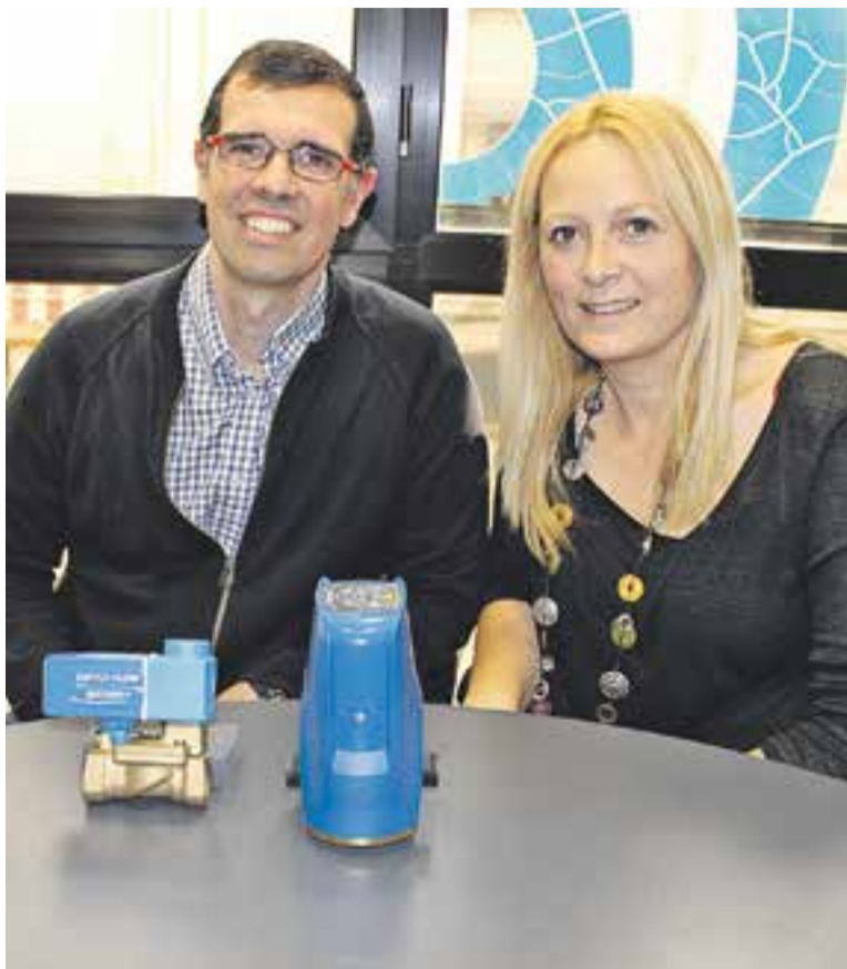
© Salvador Esteban i Núria Rambla, de l'empresa castellarenca Smart Dam. || J. RIUS