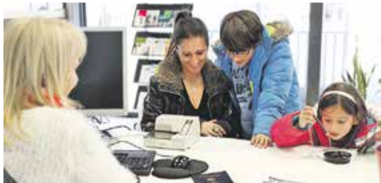
© Una usuària al SAC, ubicat a El Mirador. || A.PÉREZ

Després del SAC, i en segon lloc, figuren les visites a l'Organis-