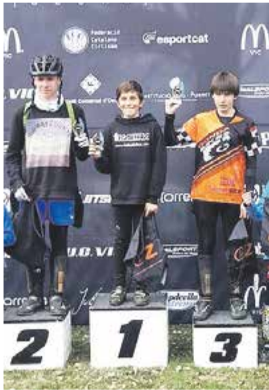
L'Alan Rovira en acció a Folgueroles

A falta de només dues proves (Taradell i Calldetenes) per la finalització del campionat, Rovira es confirma com un dels màxims aspirants a guanyar aquest campionat. ➔