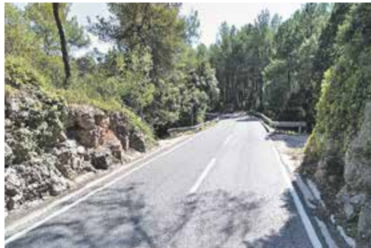
El punt quilomètric de la B-124 on va passar l'accident.