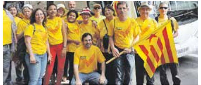
© Toni Solano, ajupit, amb altres membres de l'ANC el 19 d'octubre passat || CEDIDA

ENTITATS | ASSEMBLEA NACIONAL CATALANA (ANC)