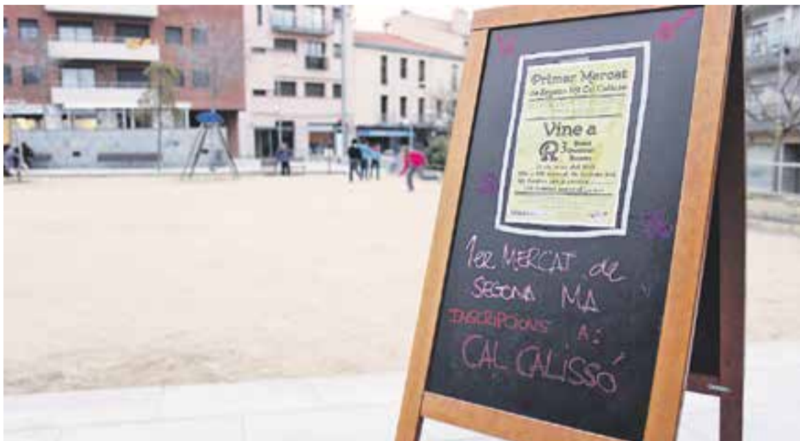
Un cartell que recull l'activitat que tindrà lloc aquest diumenge a la plaça Calissó