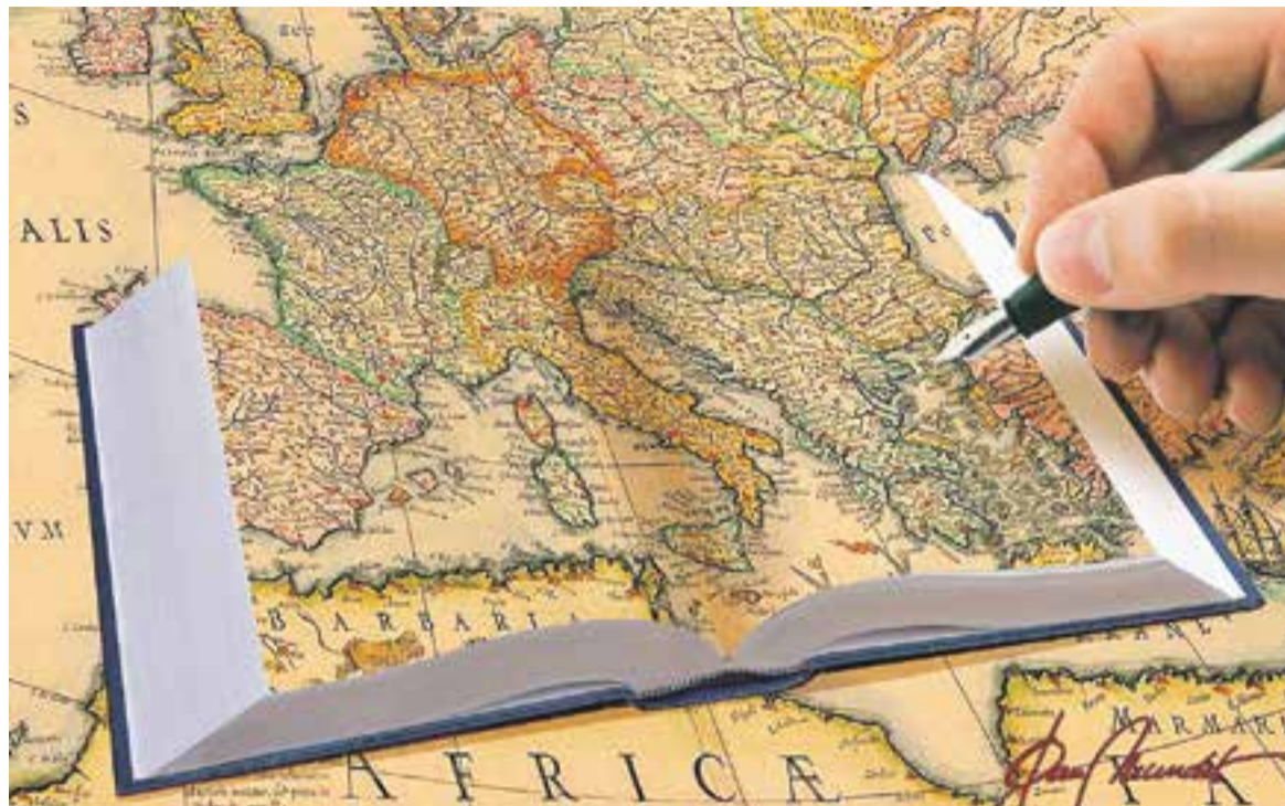
© Jacint Torrents. || JOAN MUNDET

En Jacint hi narra els contactes que hi va tenir amb amics i coneguts, els paisatges que va veure i els escriptors d'aquelles ciutats