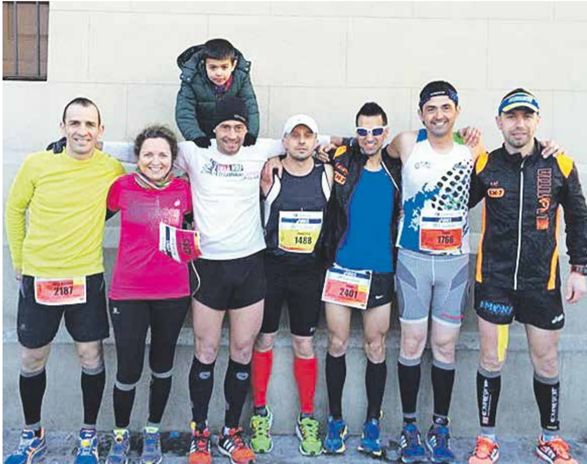
El Club Atlètic Castellàr va tenir una nodrida representació a la Marató de Barcelona 2015.