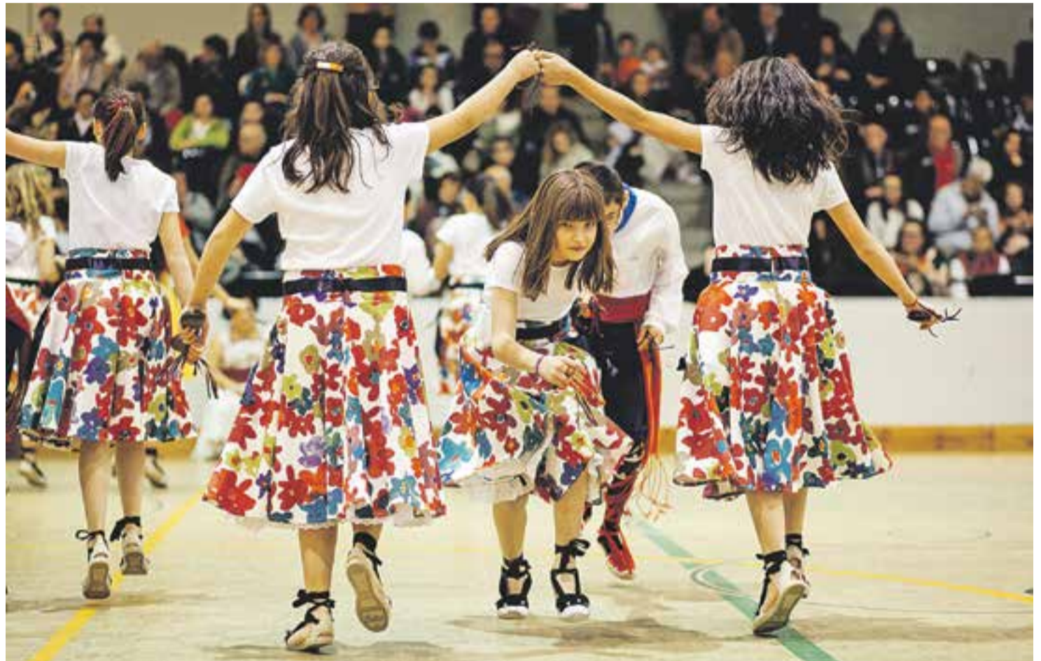
La Colla Infantil durant la ballada al pavelló Joaquim Blume.