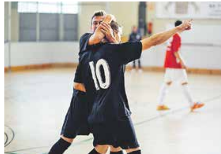
© Un Athlètic 04 en ratxa i encara amb opcions de salvació || QUIM PASCUAL