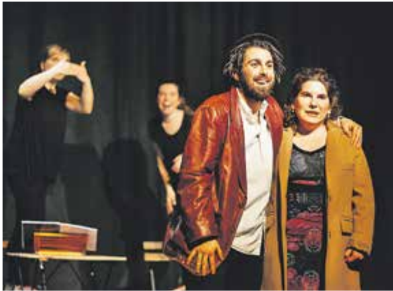
© Els actors i les intèrprets, durant la funció. || Q. PASCUAL