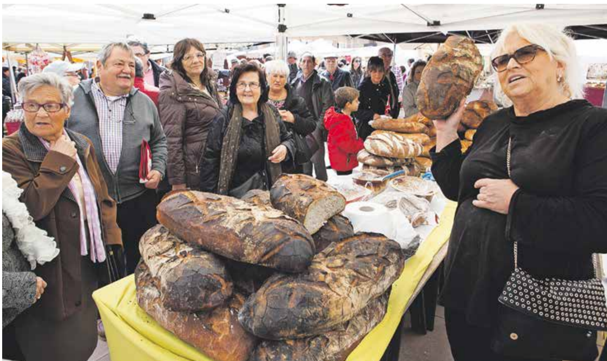
© Els castellarencs van poder gaudir d'una diada de Sant Josep plena d'oferta gastronòmica i alimentària de qualitat gràcies als 60 paradistes de la fira d'aliments artesans. || Q. PASCUAL ACTUALITAT P2 i 3