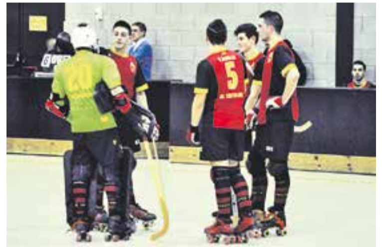
La visita a Capellades no era la més propícia per sumar punts.

Els d'Alejandro Ruglio tornen a ensopegar en lliga