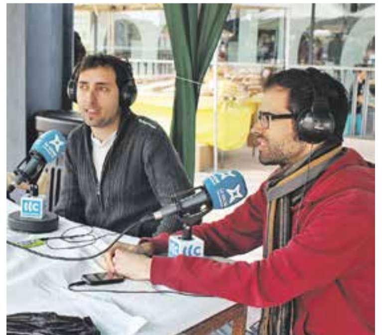
Un moment del programa 'Dotze' dijous a la fira de Sant Josep.

A les 13 hores es va afegir a la fira el magazín de Ràdio Castellar Dotze amb entrevistes i convidats relacionats amb la diada de Sant Josep, la festa local de la vila. Les connexions en directe des de les parades de la fira van ser les principals protagonistes de l'espai d'aquest 19 de març per seguir minut a minut tot el que passi al voltant de la plaça d'El Mirador. Un programa que es va poder realitzar gràcies als col·laboradors que van donar un cop de mà a l'equip habitual del magazín de la Ràdio. ✦