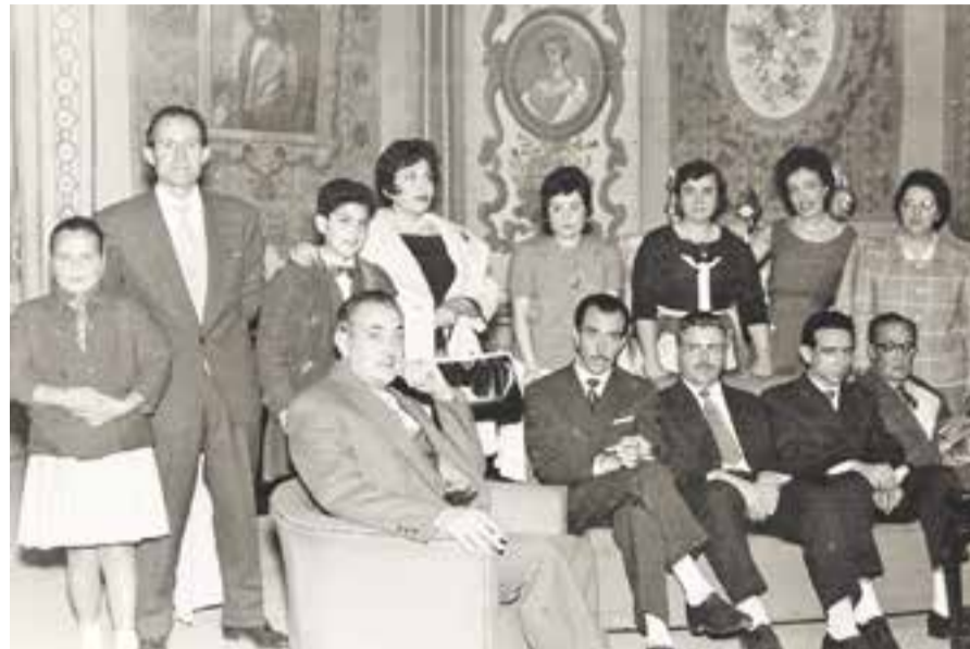
AUTOR: DESCONEGUT FONS: ANTONI BERNADET MATEU

CADA SETMANA, UN NOU FASCICLE DEL COL·LECCIONABLE AL TEU QUIOSC, PAPERERIA O LLIBRERIA