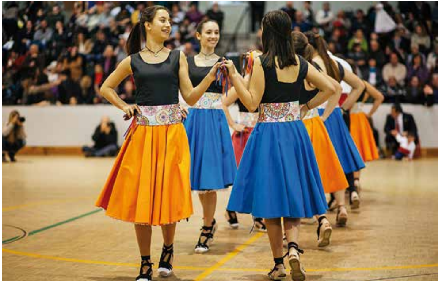
👤 La Colla de Joves durant la ballada d'aquest any al pavelló Joaquim Blume.

El recorregut pels carrers de Castellar començarà a les 11.30 hores a la plaça del Mirador. Tot seguit s'avançarà cap al carrer Sala Boadella, es continuarà per l'avinguda Sant Esteve, el carrer Lleida i, finalment, s'anirà cap al carrer Portugal fins acabar a l'Espai Tolrà. Durant el trajecte hi haurà tres zones de ball. La primera, al carrer