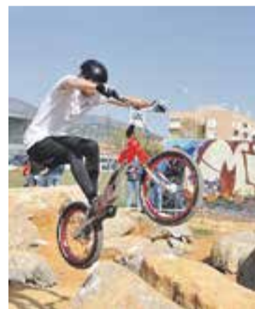
Els 61 participants van poder gaudir d'un circuit inèdit al bike-park de Castellar amb diferents nivells de dificultat

prés d'acabar el esdeveniment que "ha estat un èxit organitzatiu molt bo i des de l'organització estem molt contents perquè la gent va marxar molt satisfeta de la prova" i va remarcar que era un "bon senyal" que la gent repetís a les categories Open.