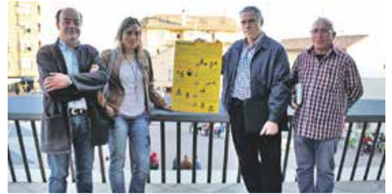
© Els membres d'ERC, en la presentació de les propostes sobre biomassa. || R.G.