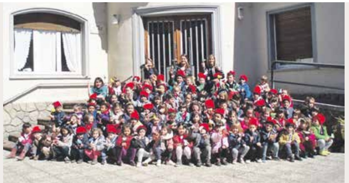
FEDAC CASTELLAR - LA IMMACULADA

Edita: Ajuntament de Castellar del Vallès · C. Major, 74 1r Pis · 937 472 123 Director: Julià Guerrero · Redactor en cap: Jordi Rius · Direcció d'art: Carles Martínez Calveras Redacció i Fotografia: Marina Antúnez, Cristina Domene, Rocío Gómez Compaginació: Àngel Pastor · Disseny publicitat institucional: Jordi Batalla Publicitat: ielou comunicació, S.L. · 937 070 097 · comunicacio@ielou.cat Impressió: Gráficas de Prensa Diaria · Distribució: TEB Castellar · Tiratge: 5.500 exemplars Correu electrònic: lactual@castellarvalles.cat · Dipòsit legal: B-13007-2008