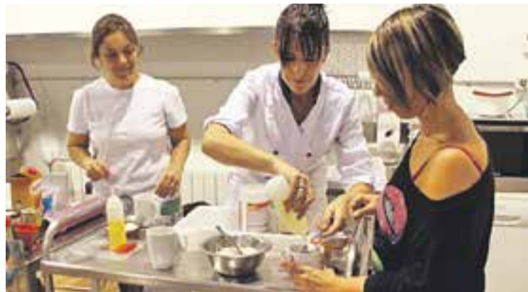
© Taller de cuina als Safareigs de la Baixada de Palau. || R. GÓMEZ