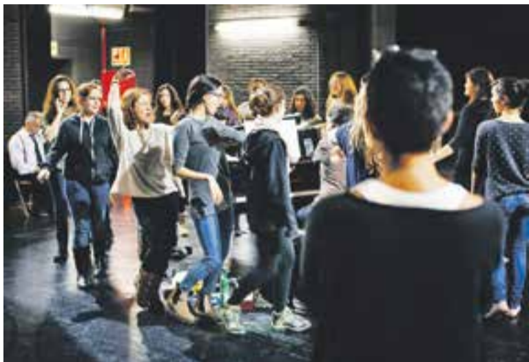
⊙ Una imatge d'un assaig de 'Silenci, es Roda', al novembre.

BANDES SONORES I PECES MUSICALS || Pel que fa a l'acompanyament musical sonaran els temes principals de les bandes sonores d' Allò que el vent s'endugué , la La llista de Schindler i Memòries de l'Àfrica . També la peça medley d' Annie , de La Sireneta i de Mary Poppins , així com la cançó As time goes by , de Casablanca . +