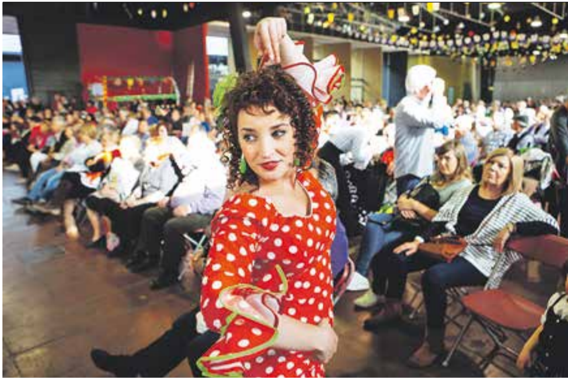
Les actuacions dels diferents quadres de ball van atraure molt gent al recinte firal.