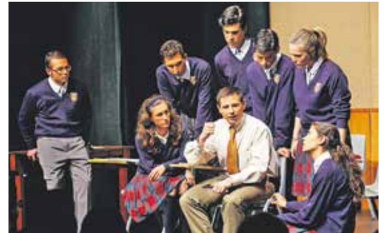
⊙ Moment de l'obra a la sala de petit format. || Q.P.

Carpe Diem està marcada per una evolució dels personatges, un canvi en la seva actitud. Però també per unir moments diversos: còmics, d'intriga, de sorpresa, de rebel·lia i, fins i tot, de tristesa amb la mort d'un dels personatges. Va ser una funció amb una durada aproximada de dues hores, però que va mantenir l'atenció del públic que omplia a vessar la Sala de Petit Format i que va correspondre als encarregats del muntatge amb forts aplaudiments. +