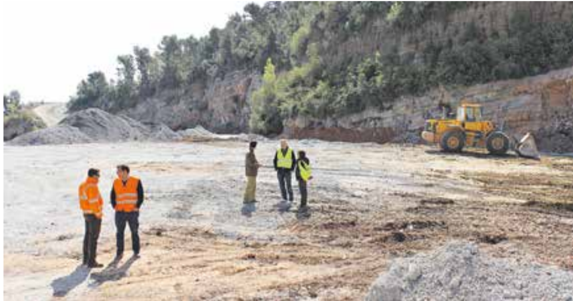
⊙ Tècnics municipals i de l'ACR durant la inspecció que es va fer a la pedrera.

Aquest expedient continuarà, a més de l'acta de la inspecció realit-