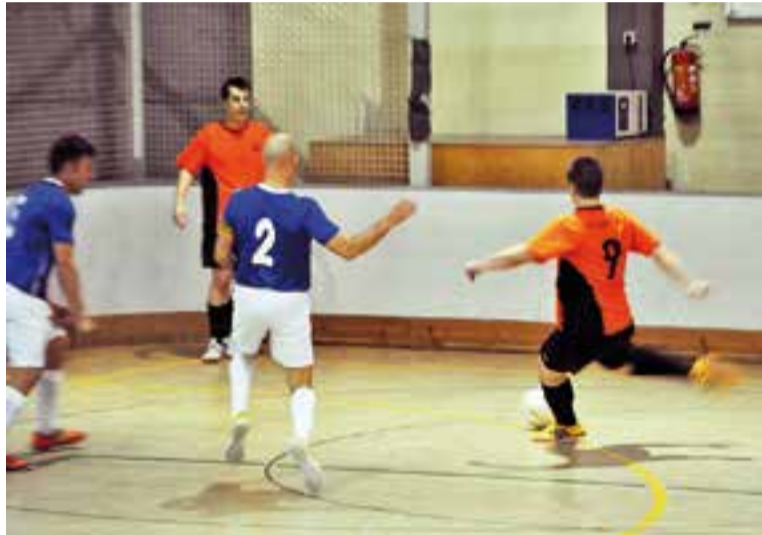
Amb l'empat, el FS Castellar va perdre l'ocasió d'allunyar-se del descens.