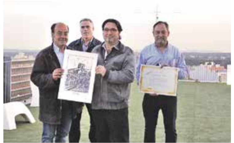
© Responsables d'ERC fan el lliurament del premi al RAF. || ROCÍO GÓMEZ