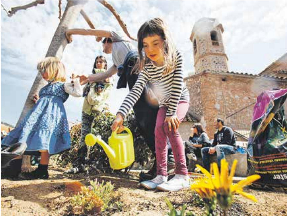
© Una nena rega amb una regadora una planta que acaba de plantar prop de la plaça del Doctor Puig. || Q. PASCUAL