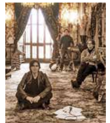
© Detall de la portada del disc.

La presentació oficial del nou disc Autoretrats serà el 24 d'abril al Museu d'Art de Sabadell. Un àlbum que segons defineix la banda sabadellenca és una col·lecció de cançons sense flors ni ornaments d'artifici, escollides i enregistrades de nou per a l'ocasió. + || ANNA PÀRERA