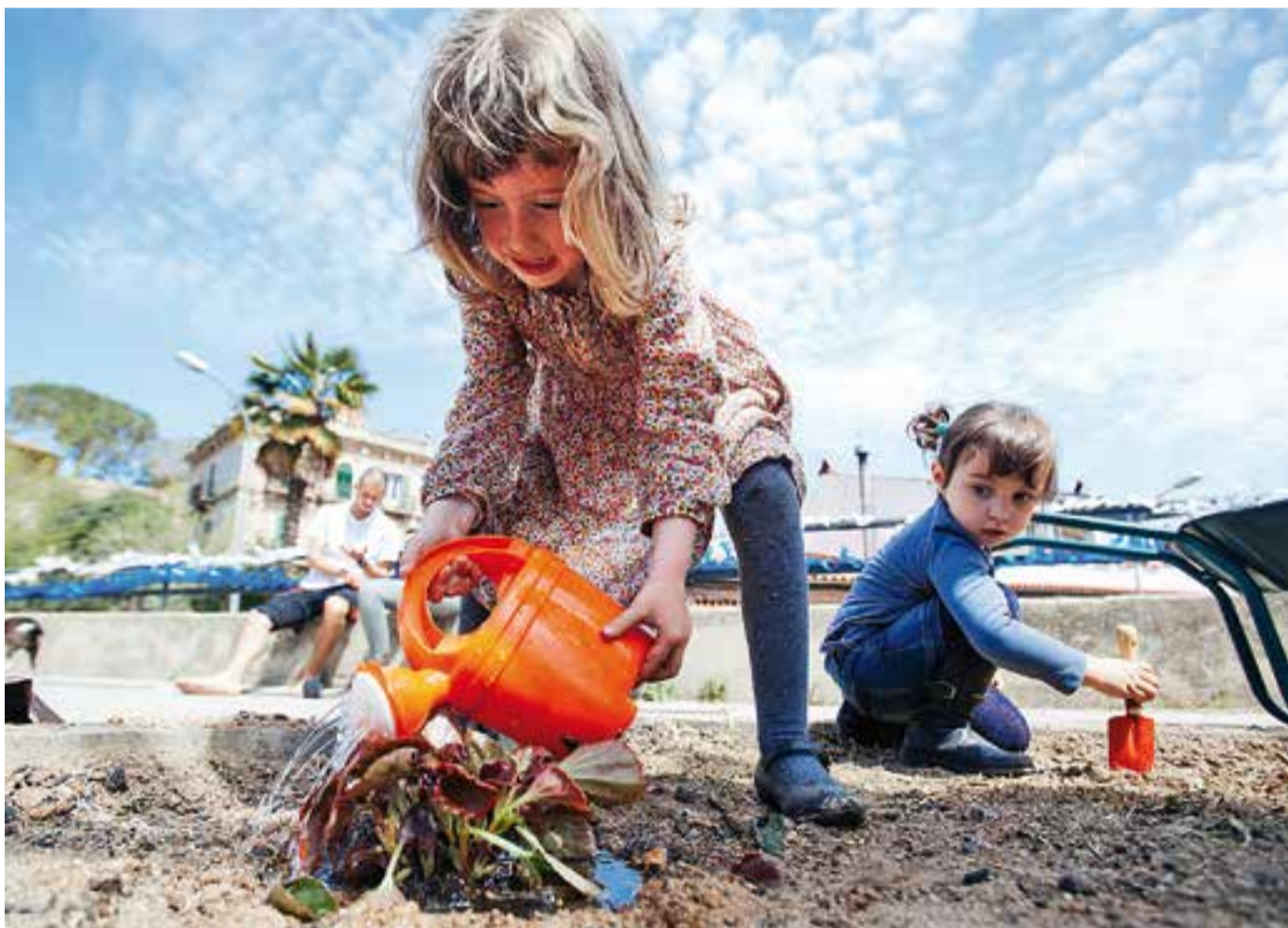
Dos infants participen al taller de jardineria celebrat el cap de setmana passat a Sant Feliu dins de la campanya veïnal 'Reviu Sant Feliu'.

▶ La fira del 23 d'abril inclourà 30 parades de comerços i entitats i el mercat municipal s'afegirà a la celebració ACTUALITAT P3