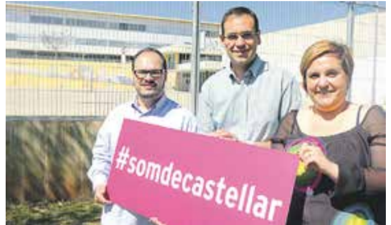
© D.Pérez, I.Giménez i S. Rodríguez, de Som de Castellar - PSC || CEDIDA