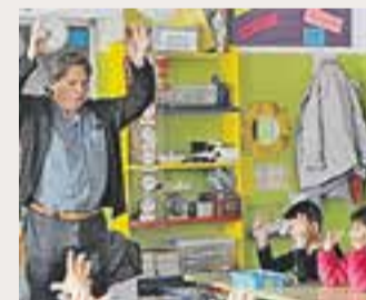
⊙ Activitat de Guia Didàctica. || JARXIU

Com és habitual, les propostes que arriben a més alumnes són les audicions musicals, el cicle de teatre per a les llars d'infants i pels centres d'educació infantil i primària i el teatre en anglès, activitats incloses dins de l'àrea Castellar i el món cultural. +