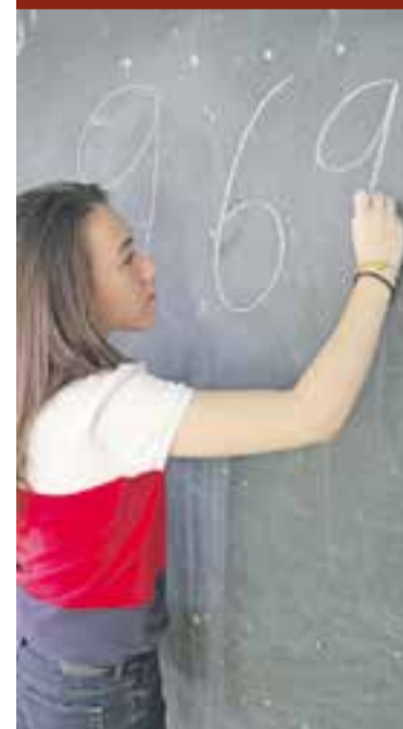
© Palacios ha obtingut un 9,69. | J.C. DÍAZ