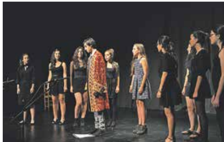
© El protagonista (al centre) amb les 9 dones de la seva vida. || A.PARERA

L'obra de teatre musical va intercalar moments de text amb peces musicals interpretades pels diferents actors i acompanyades al piano per Adrià Aguilera. Aquesta combinació va fer de Nine un muntatge àgil i fresc que va ser molt ben acollit pel públic que va aplaudir intensament després de cada intervenció musical, al final de cada escena i també quan va acabar la funció. + || A.PARERA