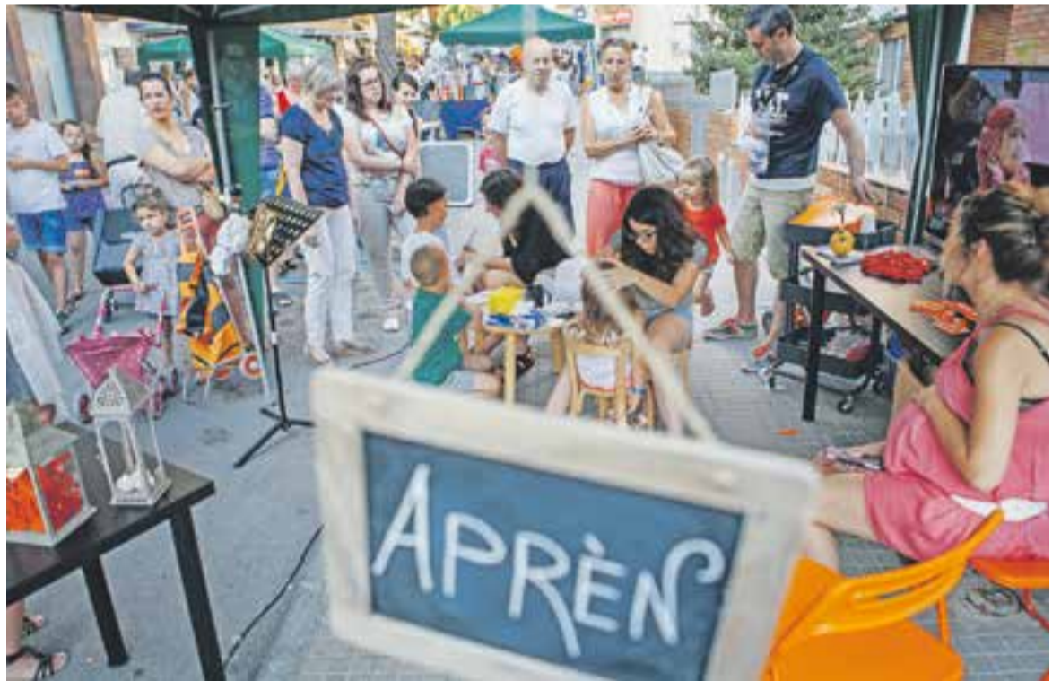
⊙ Aquest any, les activitats es van avançar i això va aconseguir atraure més públic a la Shopping Night. || Q. PASCUAL

A les 22 h es va fer el sorteig de tres paneres amb productes dels comerços. "Curiosament una de les paneres va anar a parar a una dona que l'any passat també va guanyar-la en la segona edició de la Shopping Night", apunta Casamada. ✦