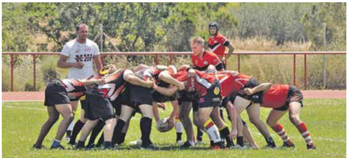
A dalt, un placatge del CREM, a baix una melé a la segona part del partit de dissabte.