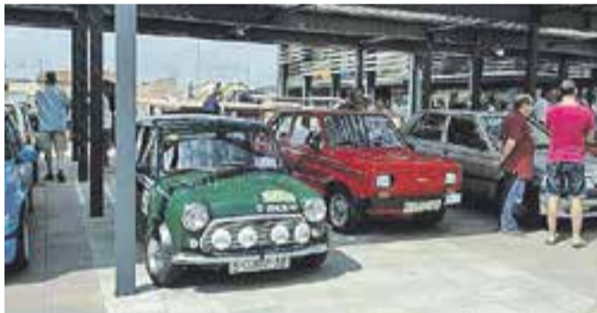
© Un Mini, l'any passat. || ESCUDERIA T3

Diumenge dia 5 de juliol, la Plaça del Mirador de Castellar es tornarà a omplir de cotxes amb motiu de la festa de Sant Cristòfol organitzada per l'Escuderia T3. Per segon any consecutiu, la T3 espera omplir el recinte amb vehicles clàssics i de competició, una concentració que es durà a terme des de les 10 a les 12 hores del matí. A les 12 del migdia, es realitzarà una rua pels carrers de la vila amb la tradicional benedicció dels vehicles, com és costum a tot el país per Sant Cristòfol, patró dels conductors. L'itinerari marcat passarà pels carrers Passeig, Centre, Font de la plaça Major, on rebran la benedicció, Major, Fàbregas, Passeig, Dr. Pujol, Avinguda Sant Esteve, Sant Pere Ullastre, Carretera de Sentmenat i la Dona acollidora, des d'on tornaran per la carretera de Sentmenat i Passeig fins arribar de nou a la Plaça Mirador. Tothom que vulgui formar part de la benedicció dels vehicles, podrà passar a fer-ho. + A. SAN ANDRÉS