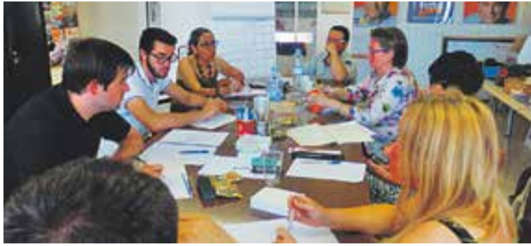
L'equip de CDC reunit en jornada de treball el passat dia 28.