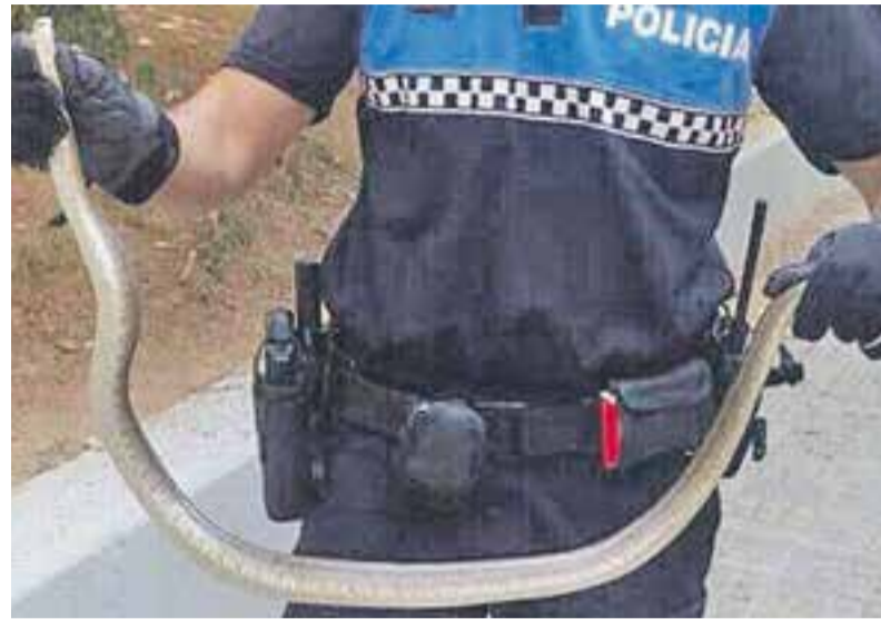
© La Policia Local durant el procediment de rescat de la serp || CEDIDA

pel futur del país", explica CDC en una nota de premsa. Per aquesta raó, cal accelerar l'organització per poder afrontar el repte del 27 de setembre. En declaracions posteriors a la reunió, Bea Garcia, va afirmar que "tenim l'oportunitat de dotar el país, del veritable poder que té la ciutadania, de decidir si volem la independència del nostre país o bé seguir com fins ara". És segons la portaveu del Grup Municipal, "l'única solució possible davant la negativa constant de Madrid a realitzar un referèndum acordat entre les dues parts". +