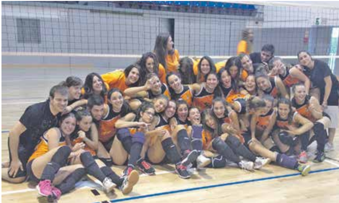
Les jugadores de la secció de vòlei del FS Castellar van gaudir d'allò més al torneig TIM Andorra 2015.

Els tres equips de la secció femenina de voleibol del FS Castellar van viatjar fins el país veí per jugar el torneig d'estiu