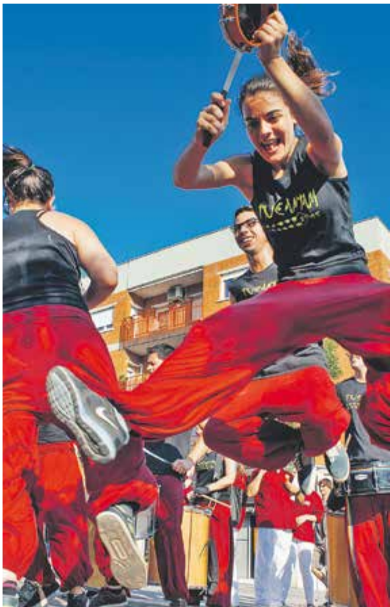
Actuació festiva de Tucantam Drums, que feia dos anys.