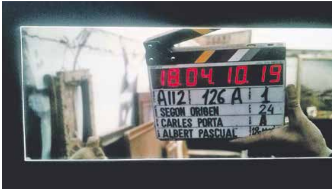
© Imatge del making off de la pel·lícula 'Segon Origen', que s'estrenarà al Festival de Cinema Fantàstic de Sitges || CEDIDA

D'altra banda, Segon Origen , produïda per Antàrtida Produccions,