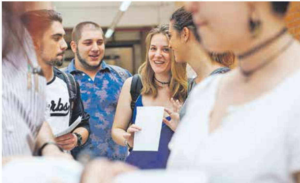
⊙ Alumnes de l'Institut Puig de la Creu moments abans de començar les proves de selectivitat d'enguany.