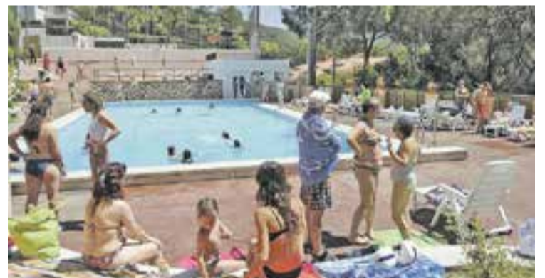
© Imatge d'arxiu de la Piscina de Sant Feliu || ARXIU

Després de donar l'avís, van arribar fins al lloc dels fets la Policia Local, els Bombers, una ambulància del SEM i un helicòpter d'emergències. Segons van informar els Bombers Voluntaris es va realitzar una tracció mandibular que va permetre respirar l'infant. L'ambulància va traslladar la nena a l'Hospital Taulí, on evoluciona favorablement a la Unitat de Cures Intensives. †