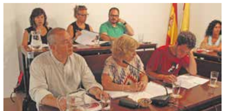
Ubicacions al saló de plens del govern i l'oposició.