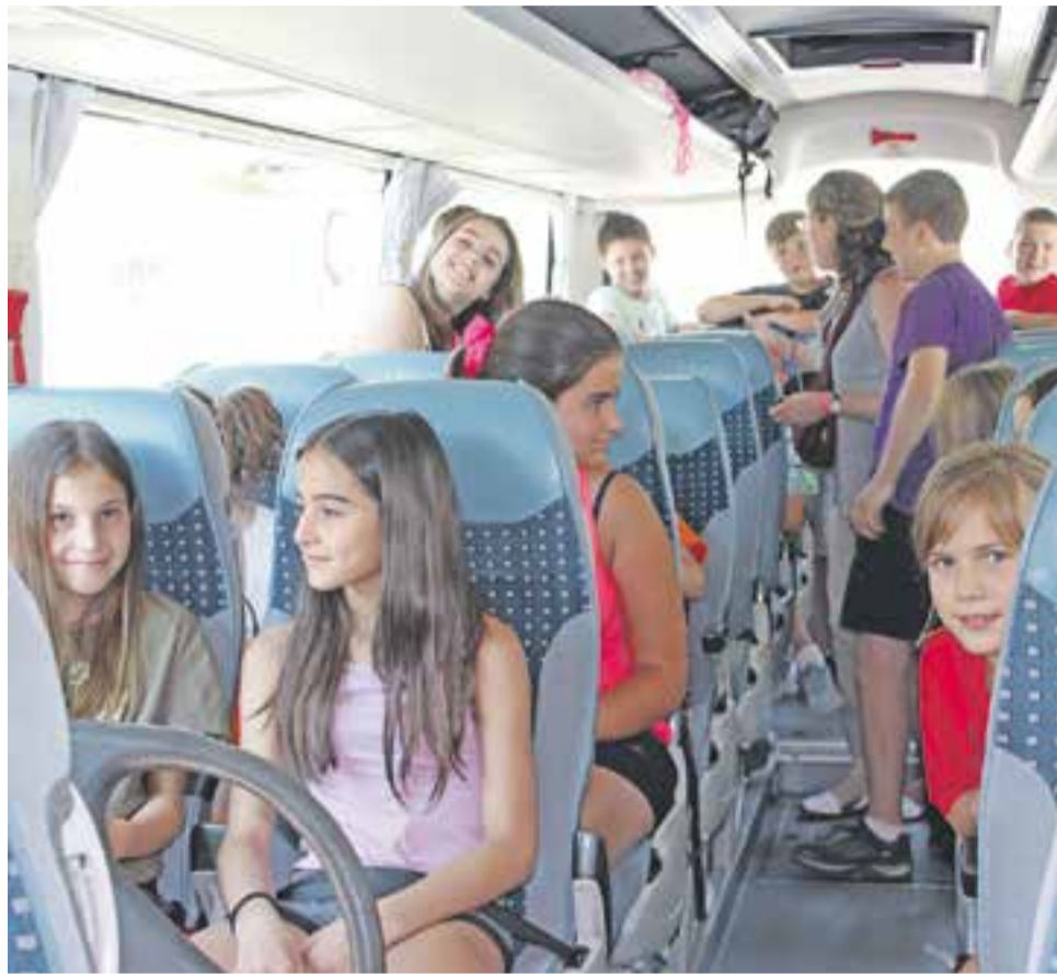
La primera tanda de colònies a l'autocar al moment de sortida, el passat 25 de juny.