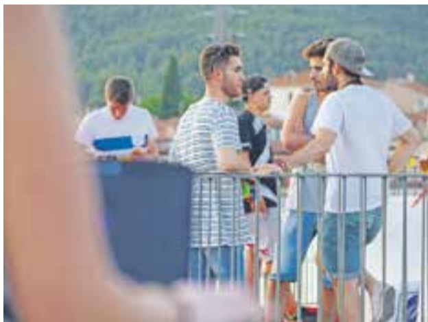
© L'Open Lounge, una proposta novedosa. || Q. PASCUAL

dres, que anava a càrrec de la discjòquei castellarenca C.A.S.H. amb una ambientació de música funky, la plataforma va demostrar que tal com havia afirmat no es tractava d'oferir una festa, sinó un lloc on els assistents poguessin estar tranquils, prenent alguna cosa per beure i xerrant amb la música com a acompanyant. Tanmateix aquells que van apropar-s'hi la primera estona van