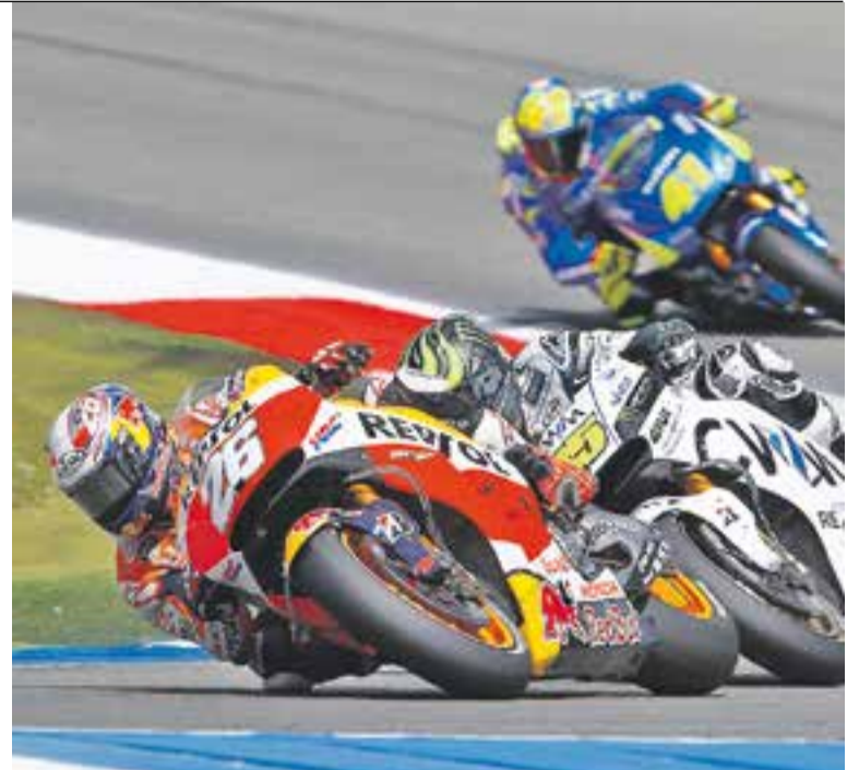
© Dani Pedrosa, pel davant de Cal Crutchlow i Aleix Espargaró, a Assen.

"Ha estat complicat adaptar-se però al final he pogut fer alguns avançaments, encara que Crutchlow m'ha avançat en la xicana frenant i això m'ha fet perdre