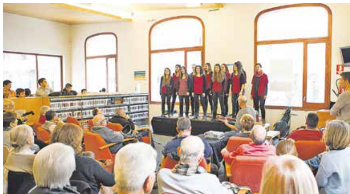
La Coral Xiribec (a dalt) i el Cor de Noies de la Coral Sant Esteve (a sota) en una actuació anterior.