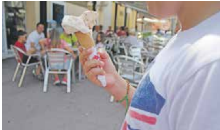
Les altes temperatures conviden a menjar gelats refrescants

A causa d'aquesta forta onada de calor arreu de Catalunya, des del CECAT i Protecció Civil recorden que els col·lectius més vulnerables