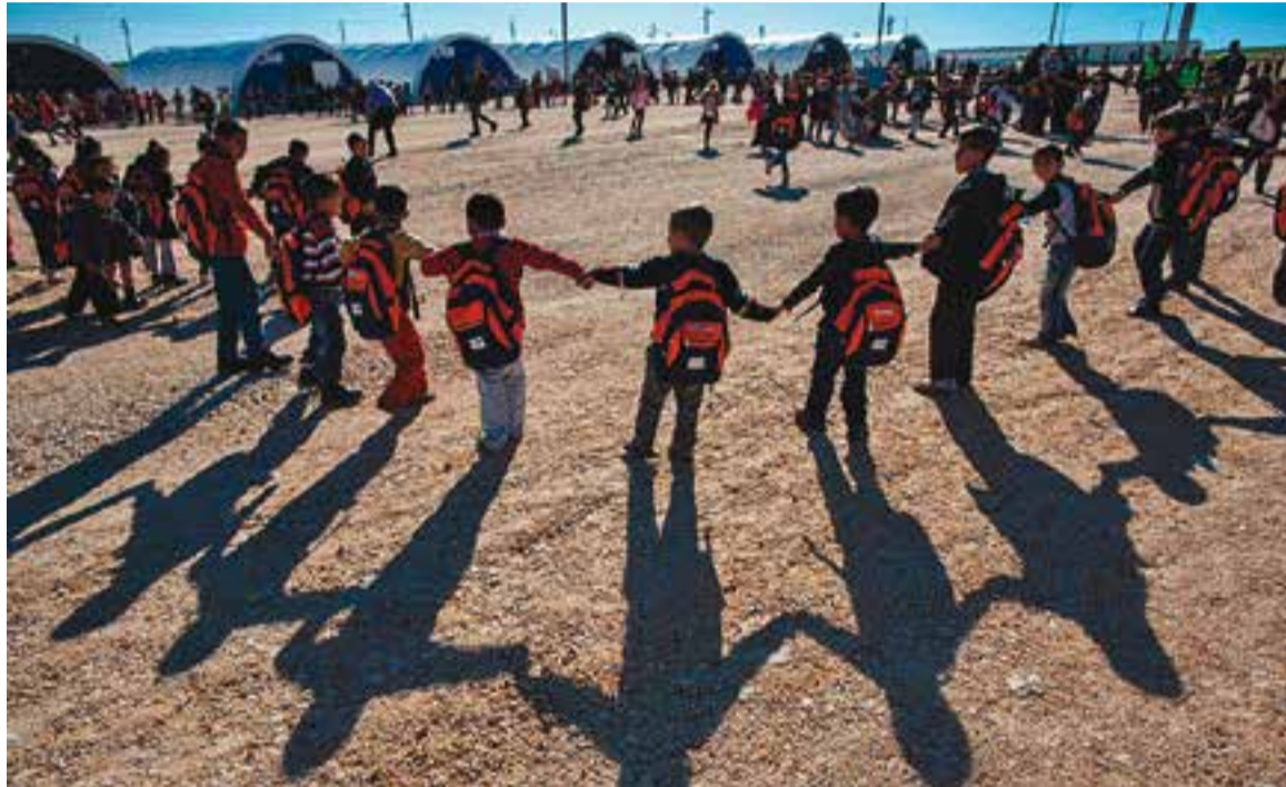
Grups de nens sirians a un camp de refugiats a Adiyaman (Turquia).