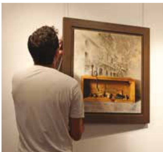
Dues imatges del muntatge de l'exposició.