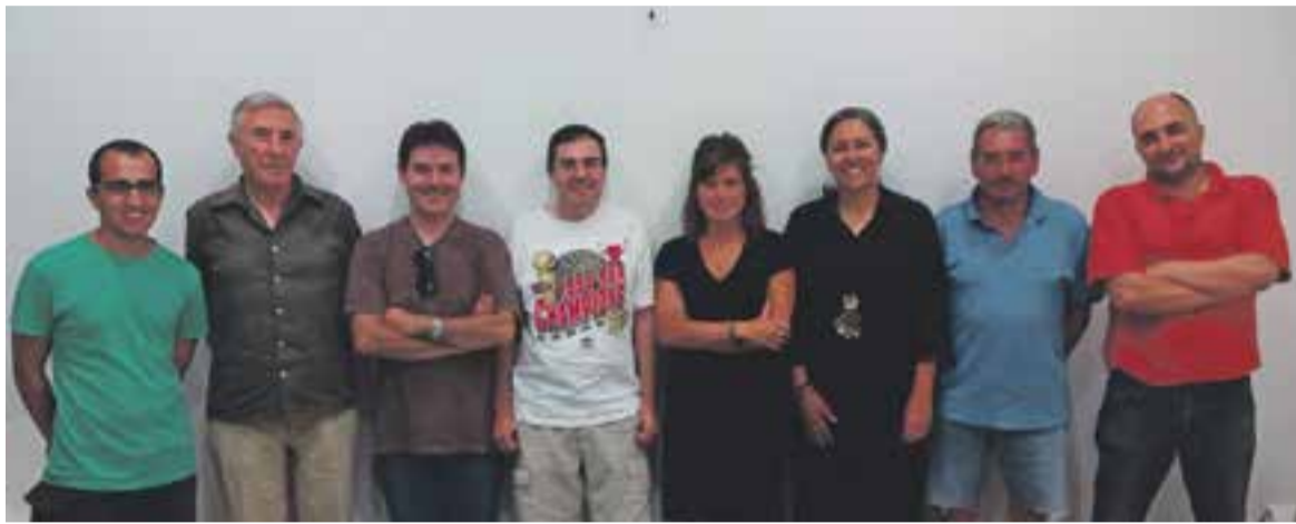
Membres de Decidim Castellar, CDC, ERC, ANC i CAL que organitzen l'ofrena popular de l'11-S.

Decidim, CDC, ERC, ANC i CAL faran l'acte a les 10 h al carrer de les Roques