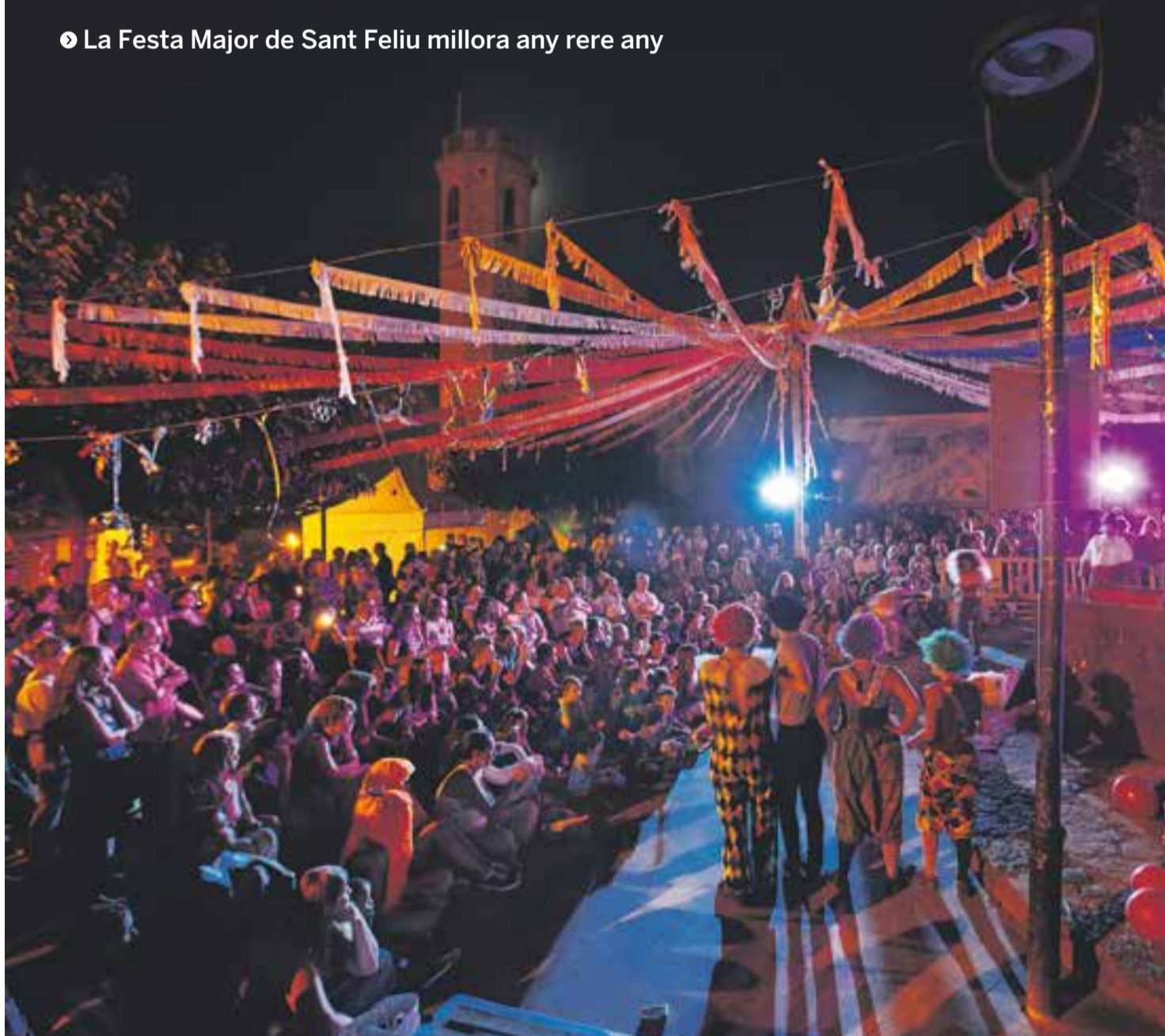
Imatge de divendres passat durant pregó, que va tenir com a protagonista el món del circ. || Q. PASCUAL

La Festa Major de Sant Feliu millora any rere any