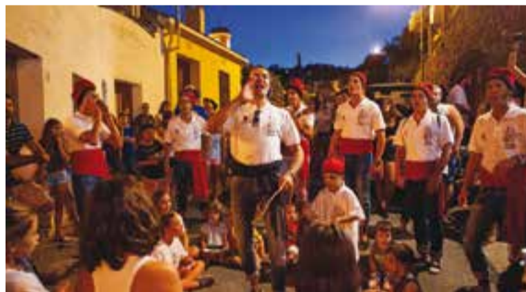
☉ Tres moments de la festa major de Sant Feliu: els castellers de Castellar, els Bastoners i les Cantades a càrrec dels Més Tranquils.