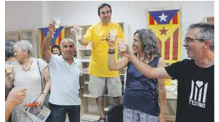
© El moment del brindis durant la inauguració del local. || Q. PASCUAL