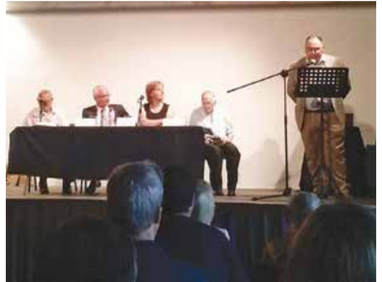
© Òscar Rocabert a l'acte del Premi Montseny.