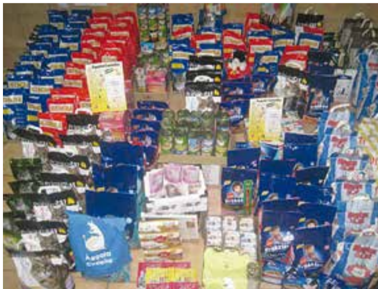
© Una imatge del material recollit durant la campanya. ||ÀGGATA CASTELLAR

La presidenta de l'entitat reconeix que la campanya ha estat "tot un èxit" i vol agrair la col·laboració dels supermercats ALDI i Con-