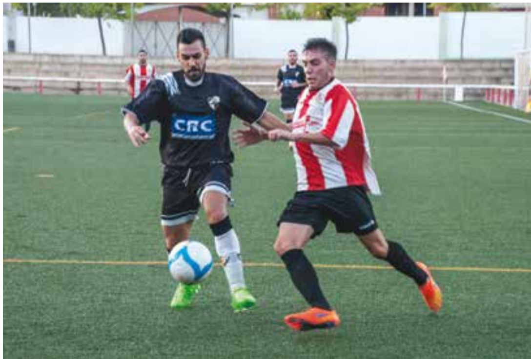
© A dalt, imatge del partit contra el Mollet que va ser suspès. A baix, contra l'Horta al Pepín Valls. || A. SAN ANDRÉS

el CF Mollet i la UA Horta, els dos militants del grup 1 de primera catalana.