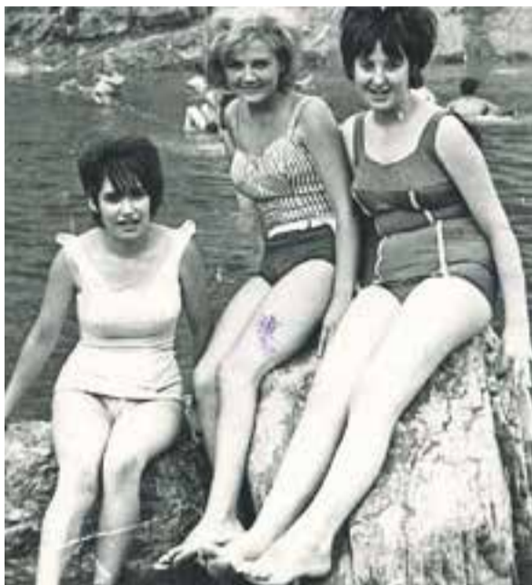
© La Ma. Dolors, la Ma. Rosa i la Ma. Teresa al riu Ripoll || CEDIDA