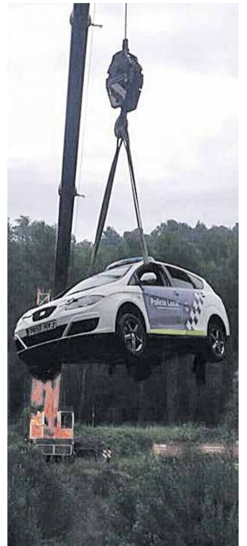
Retirada del vehicle amb una grua.

La matinada de dimecres 19 d'agost, un cotxe de la policia local de Castellar va caure a la llera del riu quan circulava per la zona popularment coneguda com el camí de les Cases del Cargol. Segons fonts de la regidoria de Seguretat Ciutadana, “la patrulla circulava en direcció al Pont de Turell per assistir una urgència quan el cotxe es va precipitar a la llera del riu cap a la una de la matinada, aproximadament”. “El terreny va cedir, la zona estava plena de fang a causa de les pluges de la setmana passada”, han apuntat des de la regidoria. Com a conseqüència, dos agents van resultar ferits lleus. El cotxe de la policia no es va retirar fins el matí de dissabte passat perquè “la zona era de difícil accés i va ser necessària una grua de gran tonatge que pogués situar-se en una base sòlida i treure el vehicle”. + || ROCÍO GÓMEZ