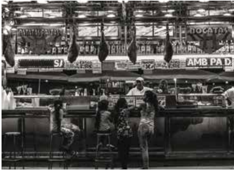
Una fotografia de José María Vilchez exposada al projecte.