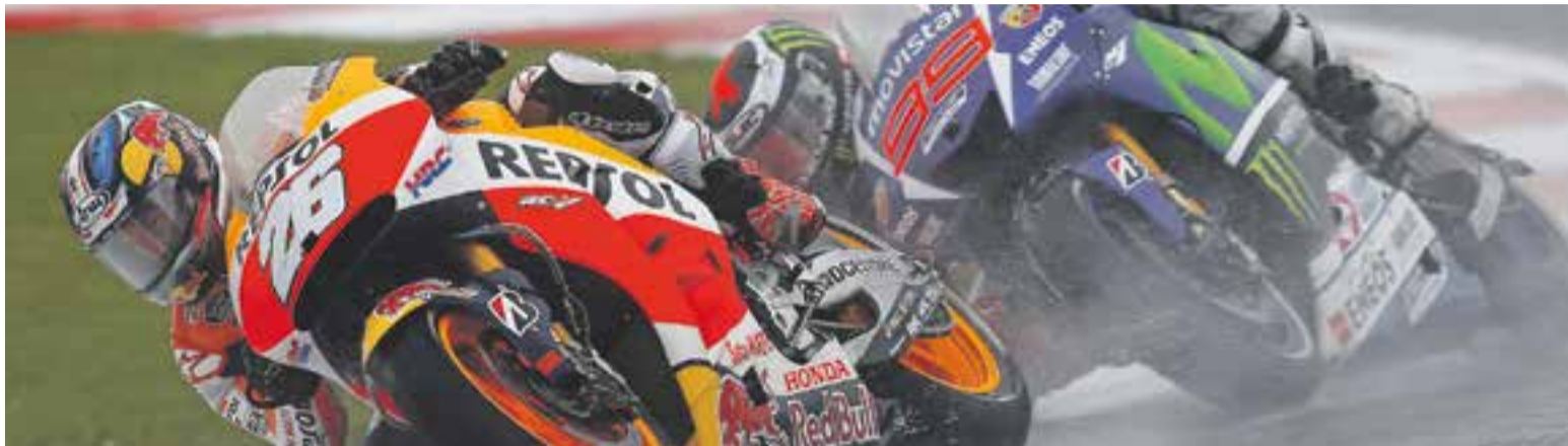
© Dani Pedrosa per davant de Jorge Lorenzo a Silverstone || REPSOL MEDIA

La temuda pluja condemna a Pedrosa a la cinquena posició del Gran Premi de la Gran Bretanya