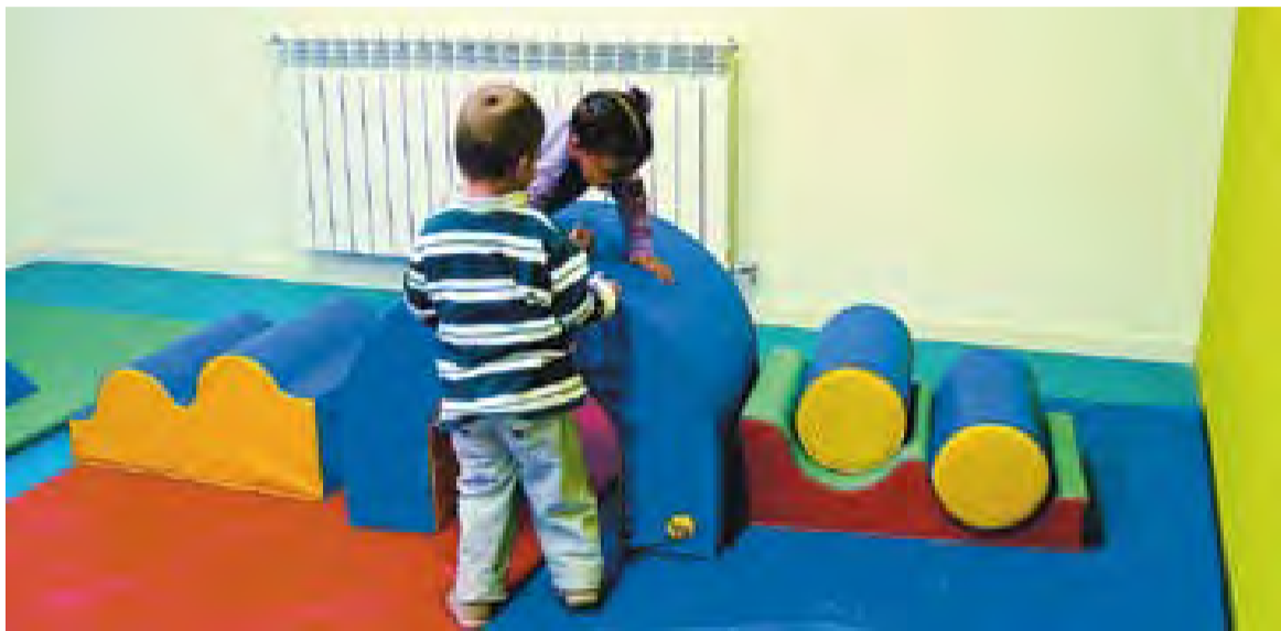
Uns nens jugant a un dels espais de la ludoteca municipal Les Tres Moreres.