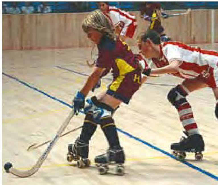
⊙ Totes les categories del club ja han començat la competició.