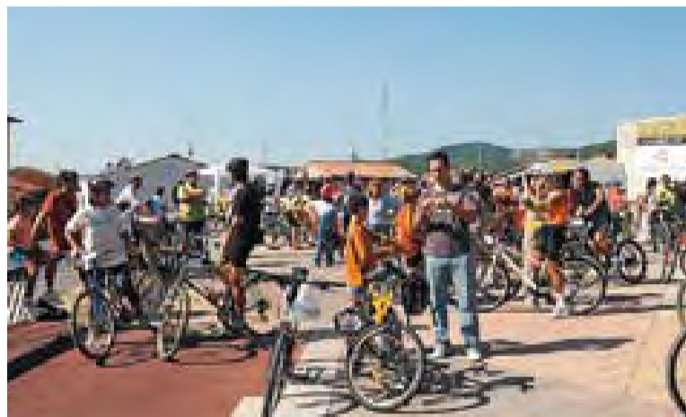
Els ciclistes es van concentrar a la plaça Major.

A banda d'aquesta activitat, durant la Setmana de la Mobilitat s'ha dut a terme la tradicional activitat amb les escoles. Durant la setmana passada, els infants de quart de primària van sortir al carrer a detectar males pràctiques o desperfectes que dificulten la mobilitat. +