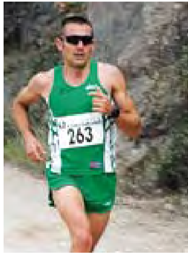
© Del Corral, el guanyador. || J.G.

Per darrere del campió van arribar a més d'un minut i mig Marc Garcia, del club Corredors.