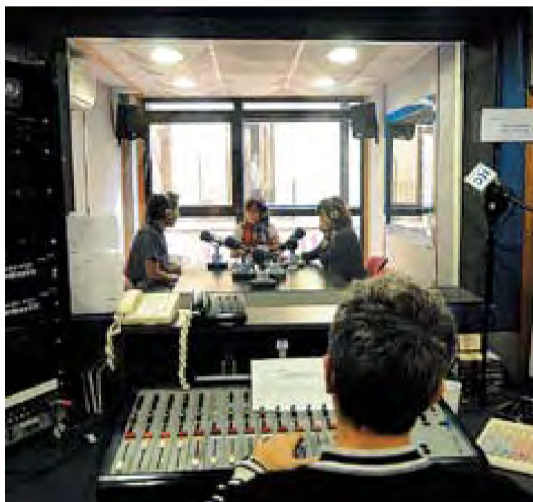
⊕ Una imatge del magazine Dotze que s'emet diàriament de les 12 a les 13:30 hores.