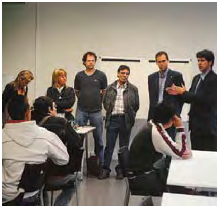
⊙ La presentació del Programa de Qualitat Professional Inicial el passat dilluns al Casal. Al costat, festa final de curs. || J.G.

Pel que fa a les activitats concretes es mantenen els tallers de flamenc, funky, batuca, voleibol o multiesport, a més de les jornades esportives dels dissabtes. Aquestes activitats es duran a terme a diferents espais, com l'Espai Firal o el pavelló Puigverd. També en la línia del Casal de Joves, s'aniran oferint tallers monogràfics de disciplines com ara percussió, breakdance o dansa del ventre. La posada en marxa d'aquestes activitats, així com els horaris i funcionament dependrà de la demanda que els propis joves vagin generant. +