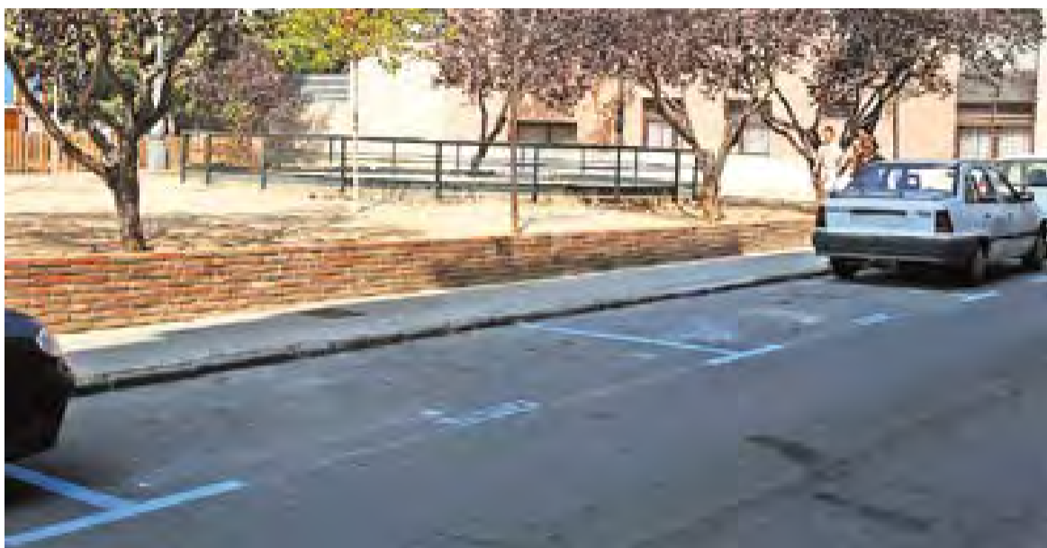
© Els aparcaments en zona blava es poden ocupar de moment com si fossin places normals. || JOSEP GRAELLS

El pagament s'ha inhabilitat fins que Tiferca instauri els 30 minuts gratuïts