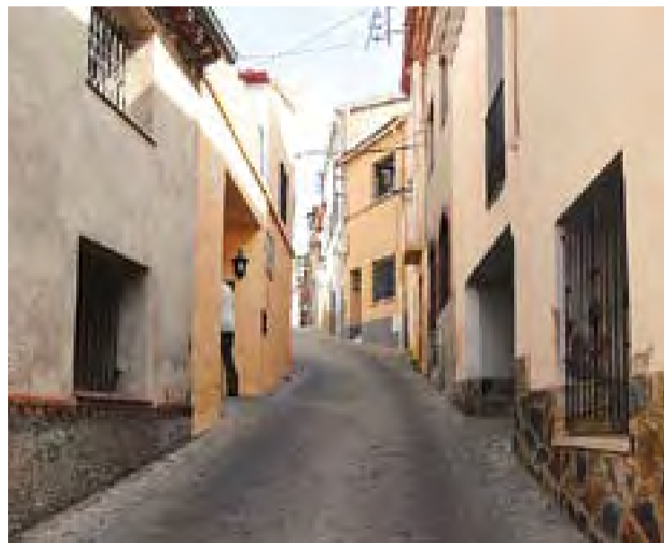
Un tram del carrer Puig de la Creu.

D'altra banda, Canalís també ha confirmat que es manté el calendari previst, i que, per tant, els carrers Montcada i Sala Boadella podrien ser per a vianants a principis del mes de novembre. +