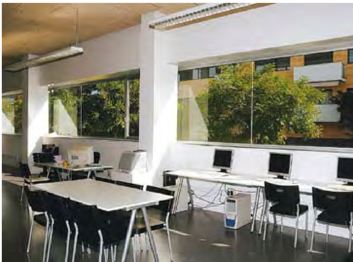
⊙ Les noves dependències del Casal de Joves a l'Espai Tolrà amb vistes al carrer Portugal.