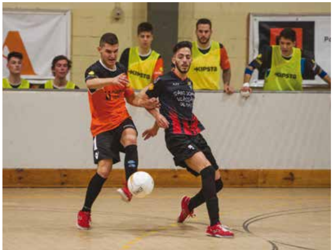
La banqueta del FS Castellar observa una jugada enfront el Sant Joan de Vilassar.

amb un temps mort, però els seus ja havien abaixat els braços. Juncosa amb una acció de parvulari, cometia una falta absurda a 21 segons del final, que era aprofitada per eixamplar la distància per part de Sergio Picado. El jove jugador castellar enc va ennuvolada la bona actuació, per una acció que no era a l'alçada del que es pot esperar de la seva qualitat, colpejant amb un cop de peu al rival.