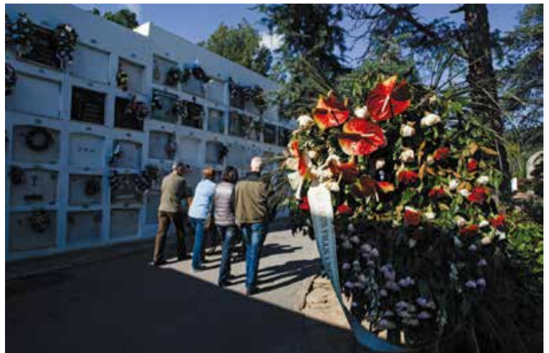
El dia de Tots Sants el cementiri estarà obert de 9 a 19 hores. || Q. PASCUAL

A les 16 hores, es farà el passí d'Insidious. El protagonista Josh, la seva es-