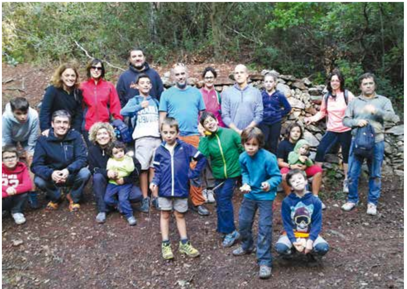
Grans i petits van poder gaudir d'un jornada festiva. || M.A.