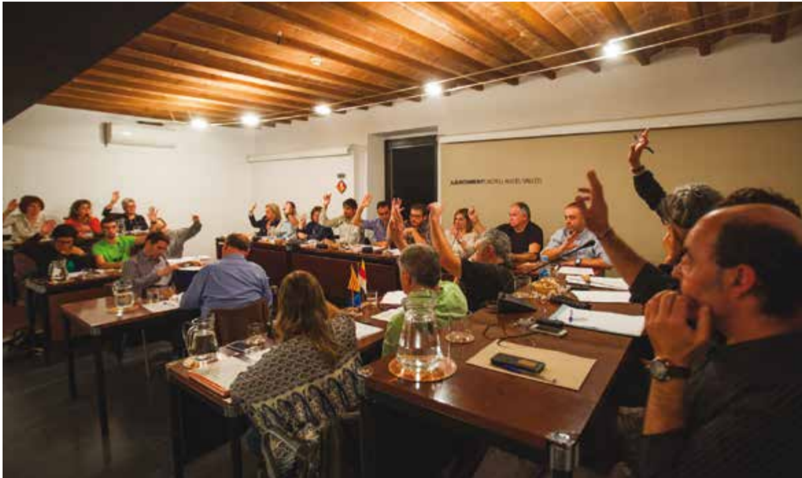
Votació unànime d'una de les mocions que es van portar al ple d'octubre relacionada amb la crisi política i institucional que pateix Catalunya.

L'equip de govern demana a Puigdemont eleccions al Parlament. L'oposició dona suport a la declaració d'independència