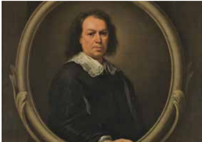
Bartolomé Esteban Murillo.

guda a nivell internacional i ha estat nomenat Director convidat de la Guitarra i Mandolin Youth Orchestra.