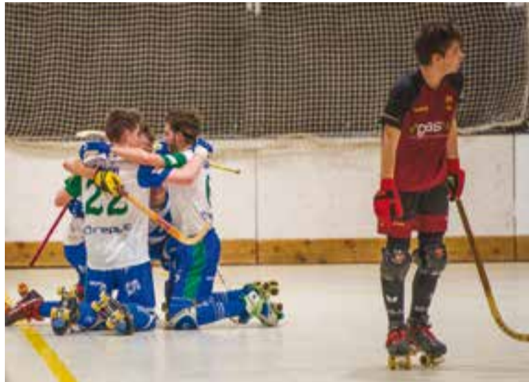
L'HC Castellar va demostrar la seva qualitat enfront del líder.

Armand Plans transformava un penal per tornar a plantar la igualada al lluminós del Dani Pedrosa. Però els visitants no es rendien tot i els embats dels de Truyols, que volien acon-