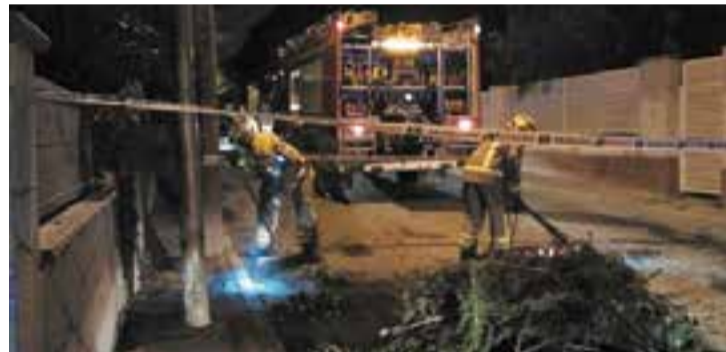
Les plantes van ser detectades durant una sortida dels Bombers.

Fruit d'aquesta comprovació la Policia Local ha instruït, conjuntament amb els Mossos d'Esquadra, diligències per delictes contra la salut pública i investiga tant la persona que estava al càrrec de la plantació com el propietari de l'habitatge. + || REDACCIÓ