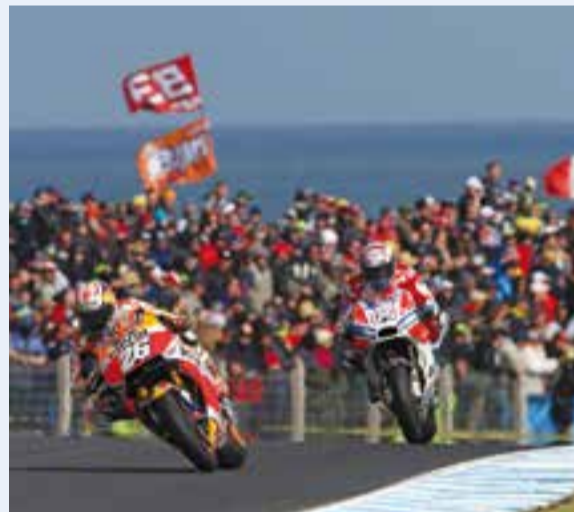
Dani Pedrosa pel davant de Dovizioso a Phillip Island. || REPSOL-M