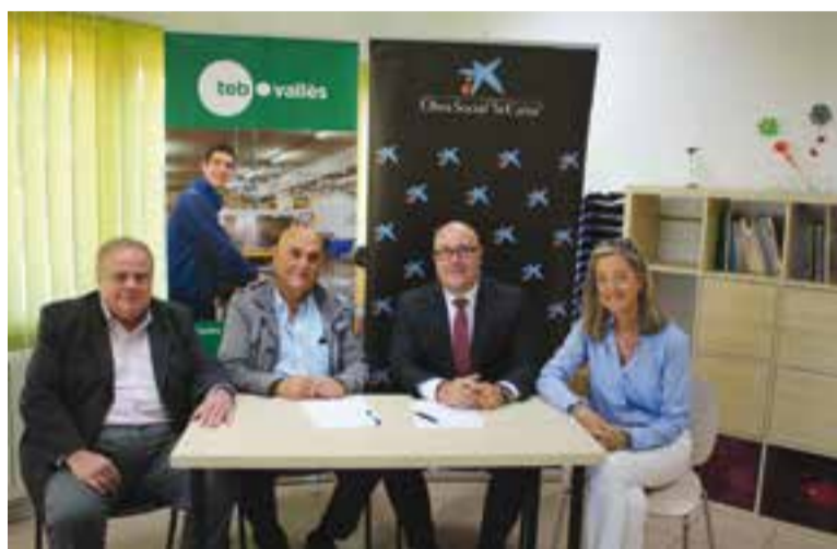
Membres de TEB Vallès en el moment de formalitzar l'acord amb CaixaBank.

TEB Vallès compta amb una associació de familiars que gestiona ajuts que s'aconsegueixen de diverses fonts, privades o públiques. "És molt enriquidor i positiu que totes les famílies i l'associació estiguin treballant perquè les dificultats no condicionin la qualitat de vida de les persones", assegura Altarriba. †