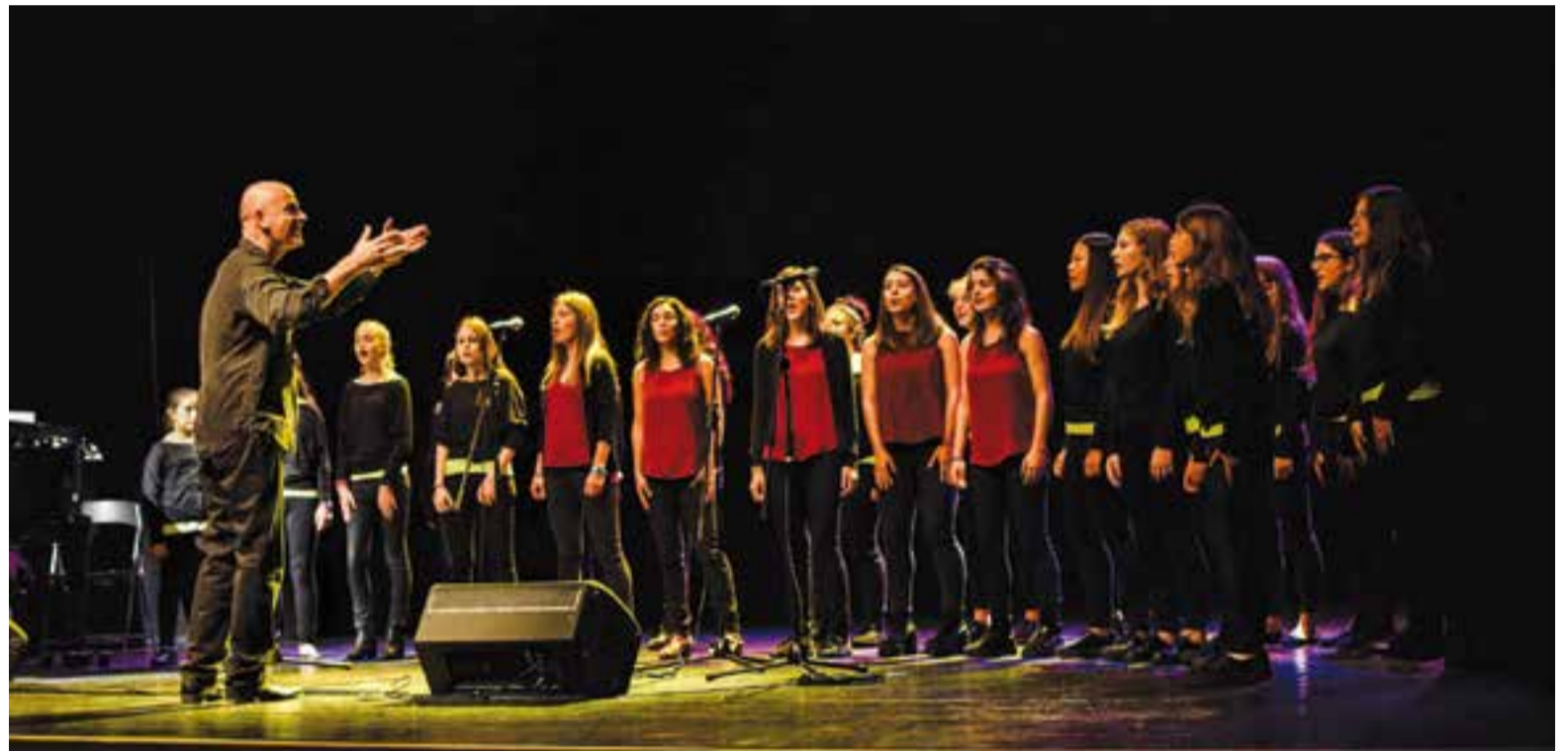
Instant de l'actuació conjunta de les dues corals diumenge passat a l'Auditori Municipal Miquel Pont. || G.PLANS

El director afirma que, musicalment, no hi ha molta diferència, encara que l'escola alemanya prové d'una llarga tradició germànica amb estil centre-europeu i la Coral Sant Esteve, en canvi, fa música "més rítmica, més oberta, mediterrània i d'arreu del país" . Les cançons conjuntes de