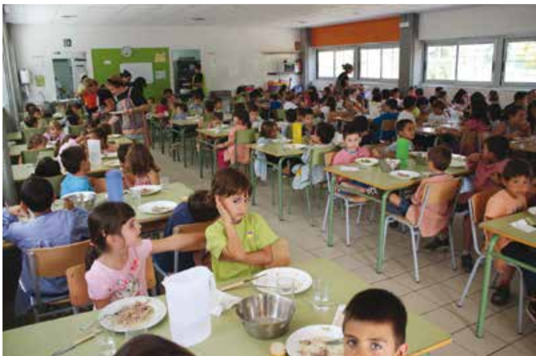
Una imatge del menjador de l'escola Sant Esteve.

El nombre de sol·licituds presentades a Castellar del Vallès ha augmentat respecte l'inici del curs anterior. En total, el Consell Comarcal ha rebut fins