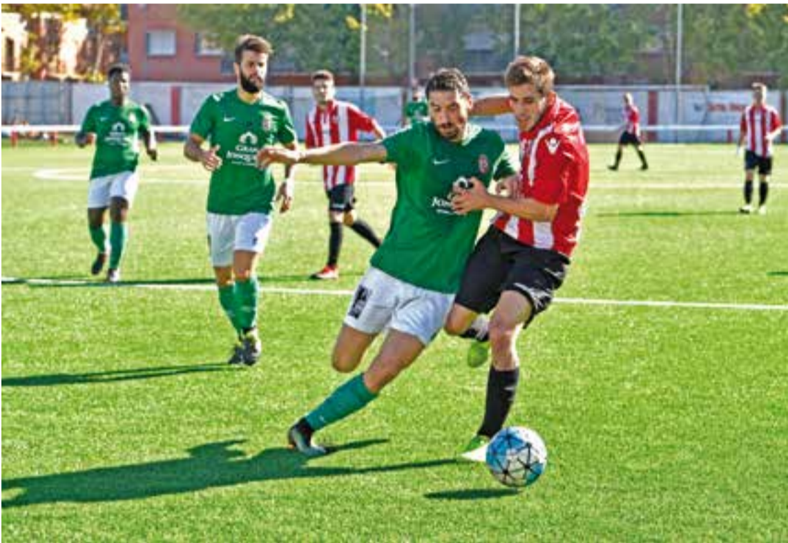
La UE Castellar va haver de lluitar de valent per aconseguir sumar un nou punt.

La UE Castellar suma el segon punt de la temporada amb canvi d'estil