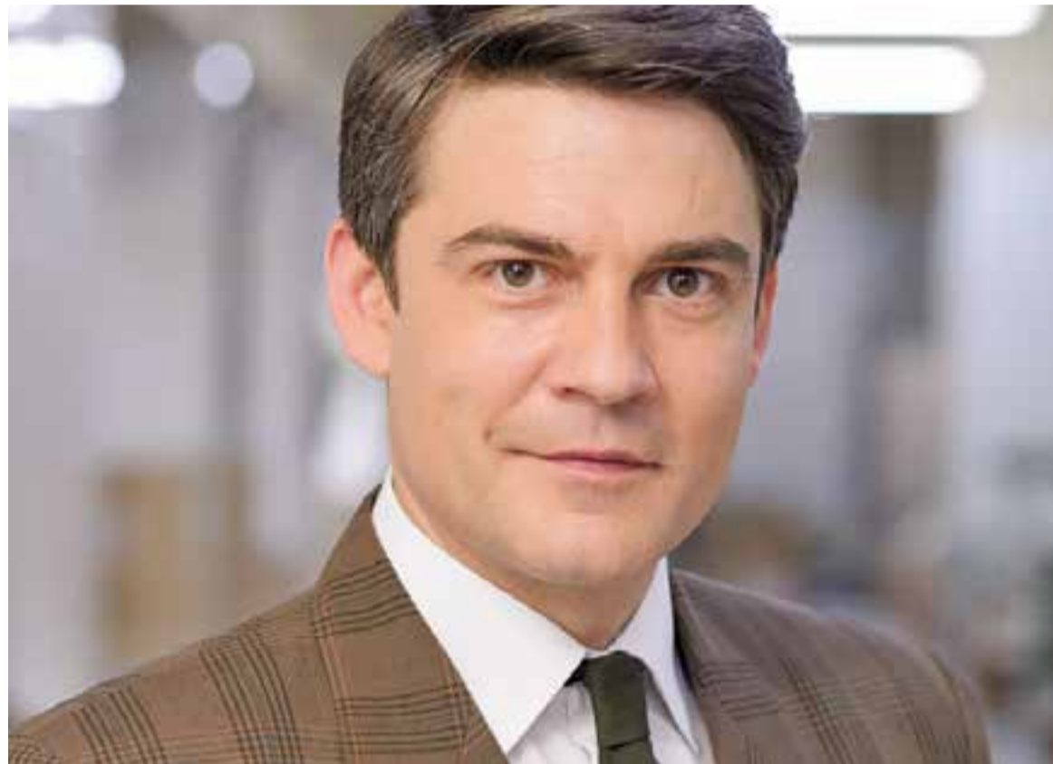
L'actor Roger Coma, protagonista de l'obra 'L'electe'.

Jo encarno el paper d'aquest polític, que mostra totes les característiques del caràcter català, la idiosincràsia del voler agradar, del voler deixar a tothom content, mostrant una actitud amable, complaent, re-