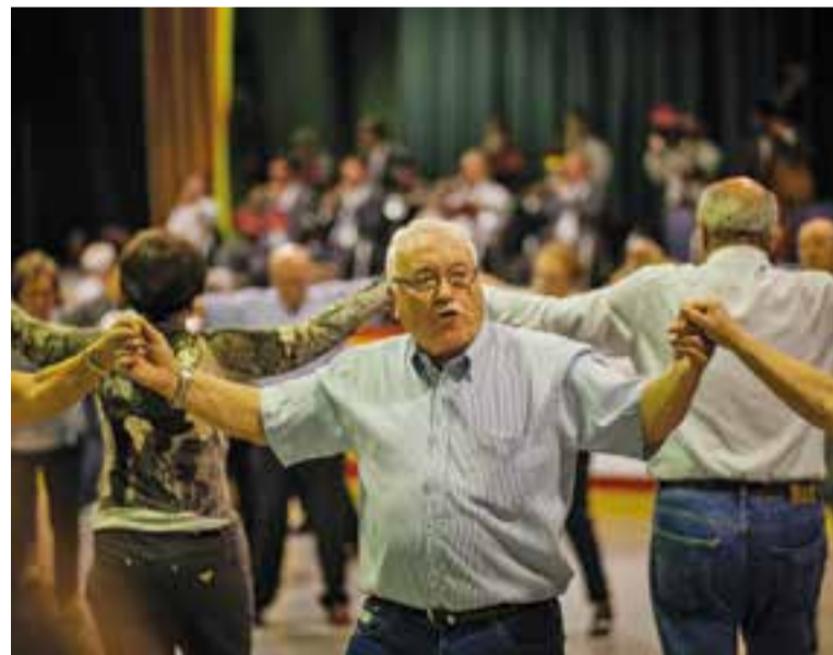
Diada Sardanista de l'any passat. || Q. PASCUAL

La Cobla Sant Jordi interpretarà les sardanes "Baixant del castell", de X. Ventosa; "Castellar sardanista", de X. Piñol; "Lluïsos CXL",