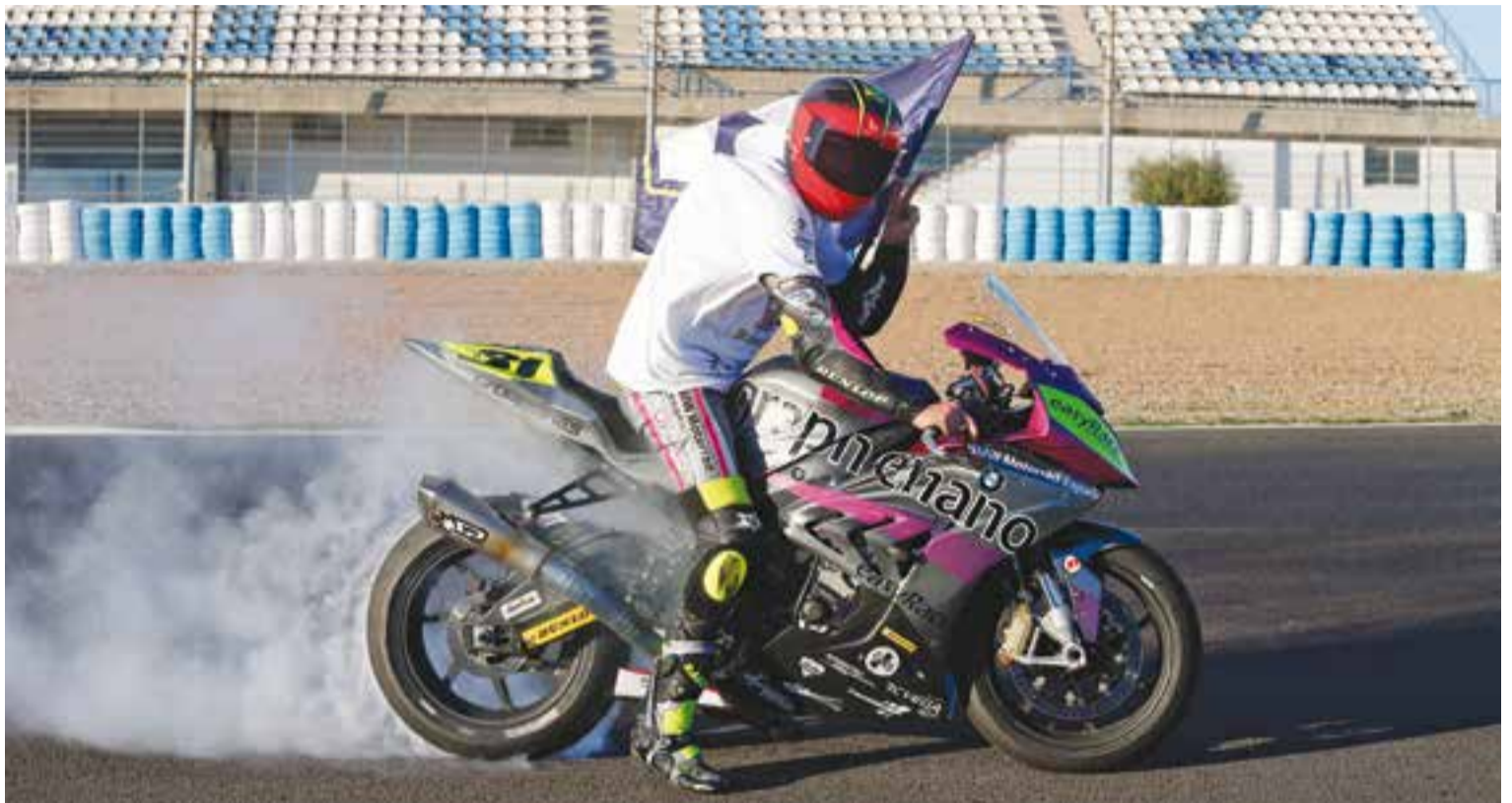
'Carmelito' crema roda sobre l'asfalt del circuit de Jerez, després d'aconseguir el campionat a la primera cursa.

A la cursa de diumenge, sense més transcendència, el del easyRace aconseguia de nou la segona posició pel darrere l'Aprilia del xilè, que no donava opció des de l'inici.