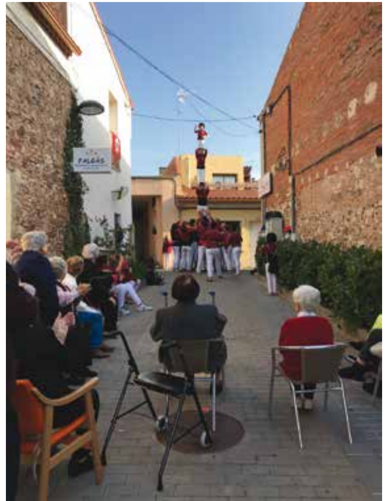
Castellers de Castellar al seu pas per la residència Falgàs.

ACTUACIONS A LES RESIDÈNCIES || El passat 28 d'octubre, durant tot el matí, els Castellers de Castellar van visitar les residències de Castellar, oferint diversos castells als avis i àvies. Van visitar la residència Falgàs, la Nord Egara, l'Obra Social Benèfica i Les Orquídes. També es va fer un agraïment als establiments col·laboradors amb la colla castellera. +