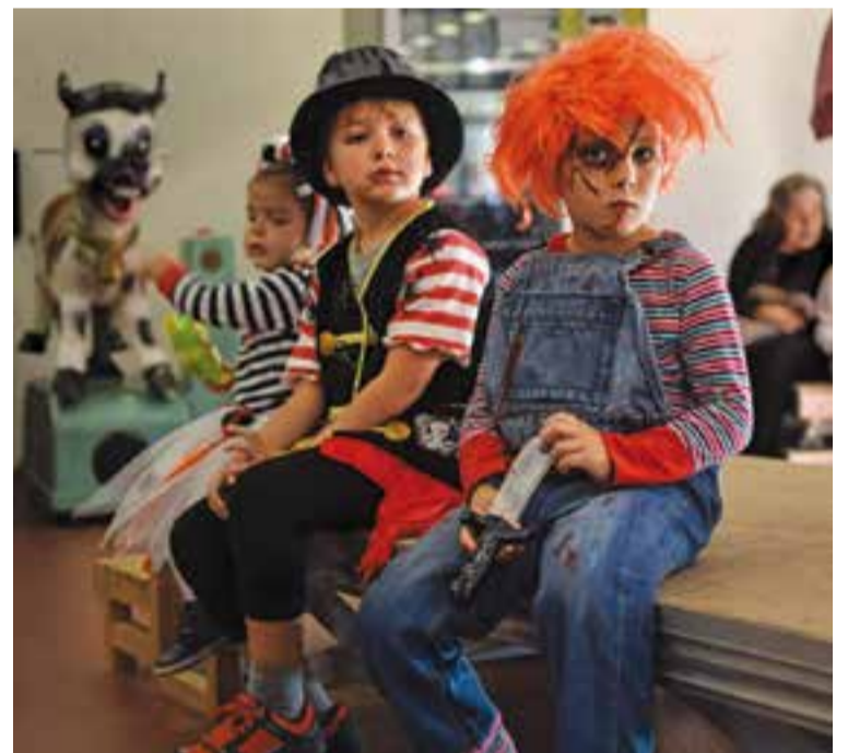
Una de les disfresses terrorífiques guanyadores del concurs infantil.

D'altra banda, el Mercat Municipal farà el pròxim 18 de novembre La Ruleta del Mercat on hi podran participar tots els clients que hagin efectuat les seves compres entre els dies 13 i 18. És requisit indispensable haver gastat com a mínim 30 euros amb la suma de tots els tiquets de compra. + GUILLEM PLANS