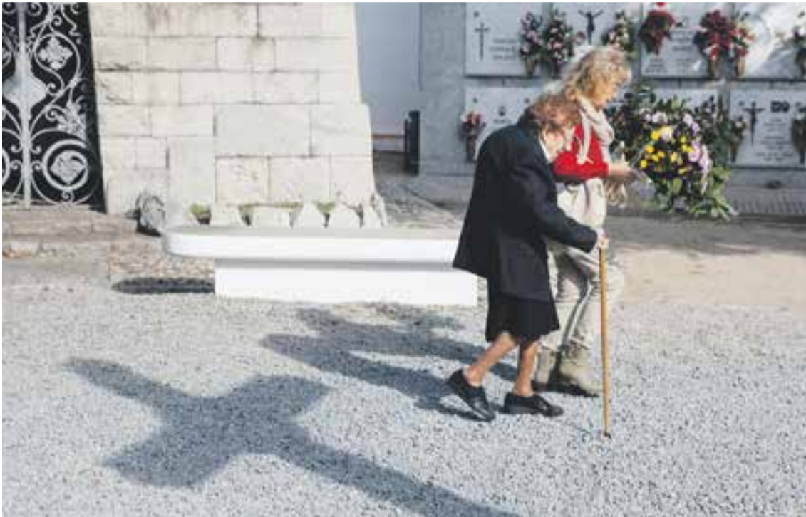
Dues dones visiten el cementiri de Castellà el dia de Tots Sants || Q. PASCUAL

Els actes que es van organitzar a la vila van tenir molta participació