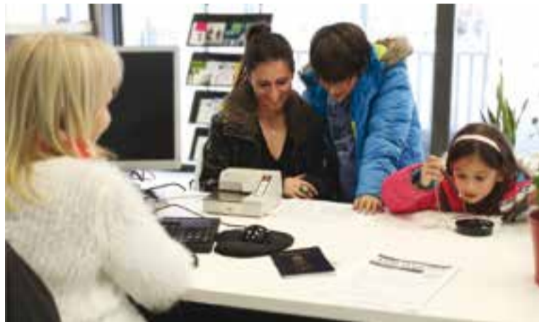
Una usuària del SAC fent una consulta.

Pel que fa al coneixement de l'horari d'atenció al públic, un 49% dels enquestats el coneix i el 84% el considera suficient. La major part (95%) considera a més que la informació rebuda del personal municipal ha estat notable (25%) o excel·lent (70%). A més, un 95% de les persones enquestades considera notable o excel·lent el tracte rebut a les dependències d'atenció ciutadana d'El Mi-