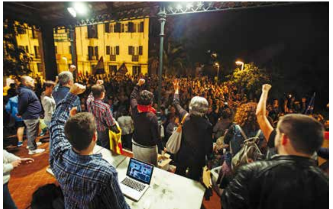
Els assistents, en el moment de la interpretació del Cant dels Segadors.

Més de 400 persones van brindar i ballar per la nova república