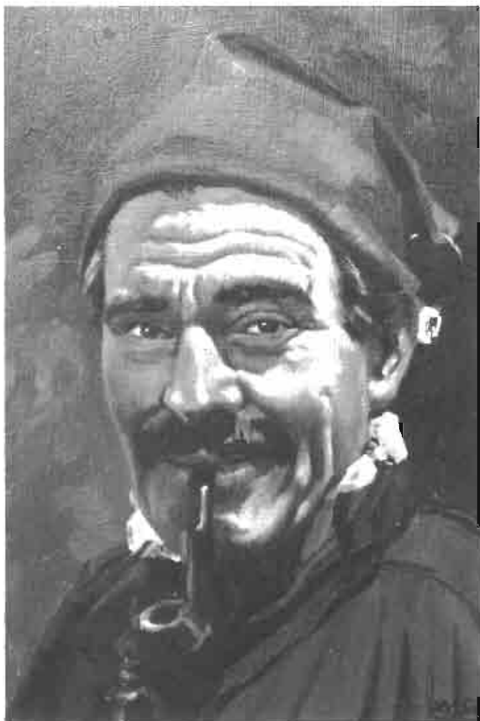
Jaume «de Catafau». Pintura a l'oli de Xavier Caba.