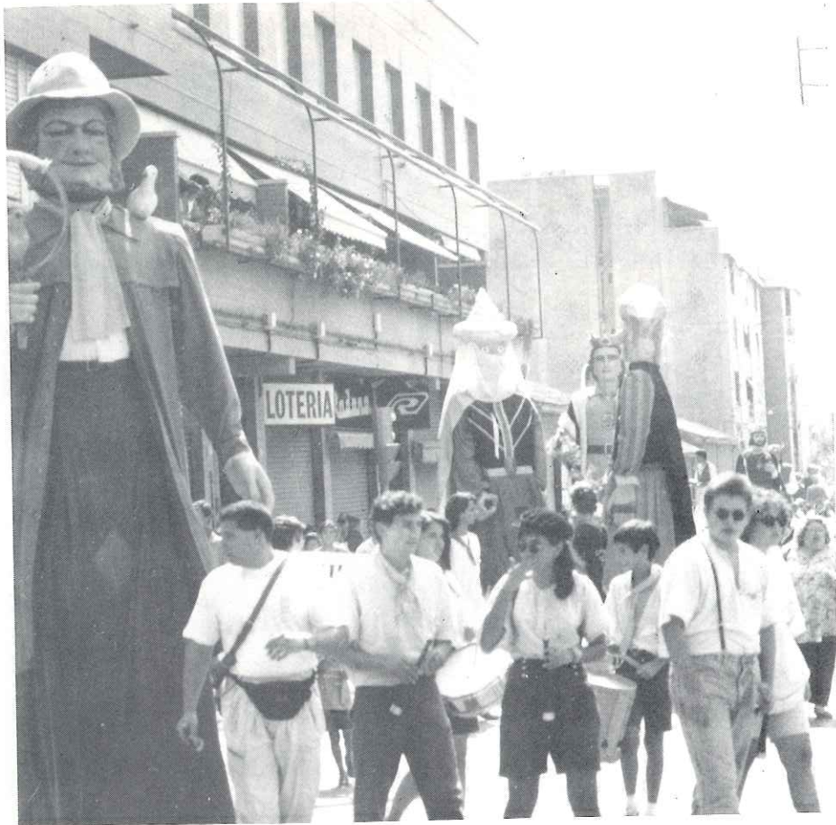
El Cercavila de gegants va omplir de color els carrers de la nostra vila

La música va tornar tot seguit, ja que els Solistes de la Costa, al carrer Balmes, i el Grup Musical del Prat, en els carrers Sant Iscle i Bassetes, posaven una nota encara més festiva als carrers engalanats.