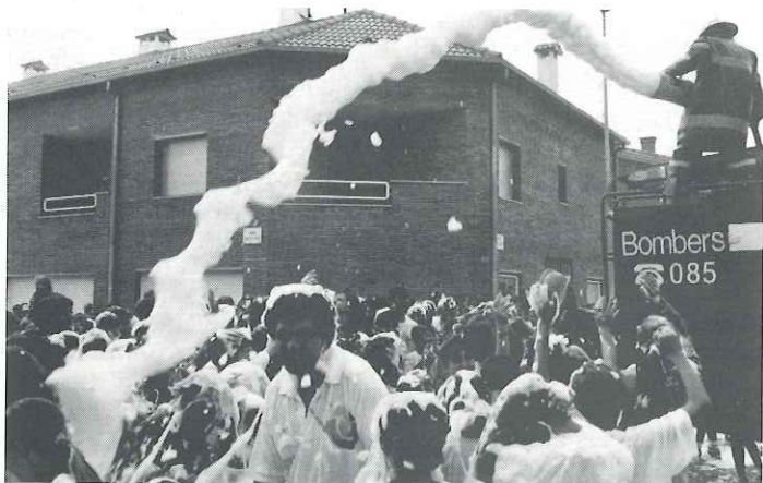
La diada dels infants va tornar a ser un gran èxit

Majorettes, el Ball de Gitanes i el Ball de Bastons.