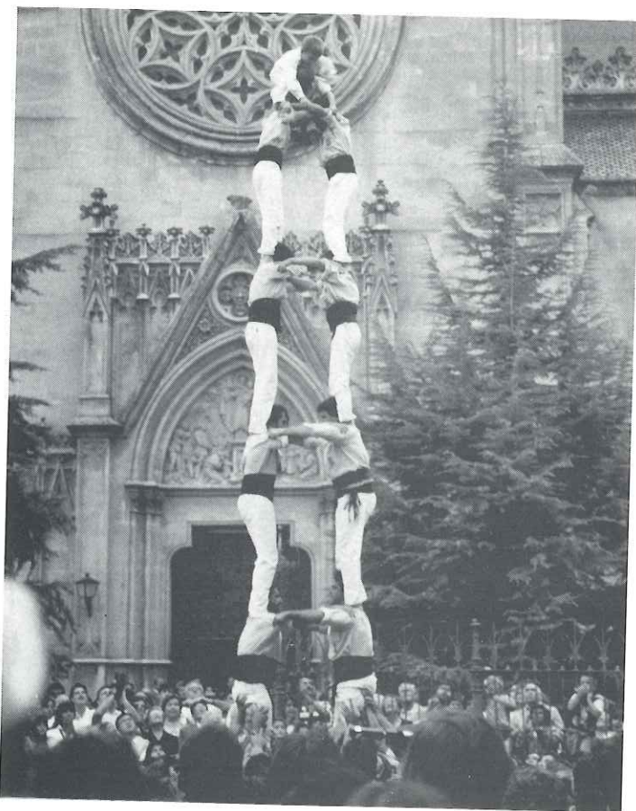
Els castellers, sempre espectaculars, van aplegar una gentada davant de l'església

Dissabte al matí era el dia assenyalat perquè el jurat qualificador de la X Edició de carrers engalanats els passés a visitar. El jurat el formaven quatre veïns de la federació de carrers de la vila de Gràcia i dos del barri de Sants de Barcelona. El seu veredict va ser el següent: Primer carrer classificat: Sant Sebastià; segon: Mina; tercer: Agustina d'Aragó; quart: Balmes; cinquè: Bassetes;