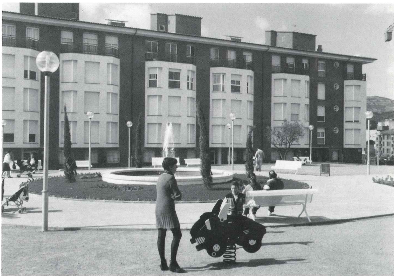
Castellar compta amb una nova plaça, la dedicada a Emili Altimira