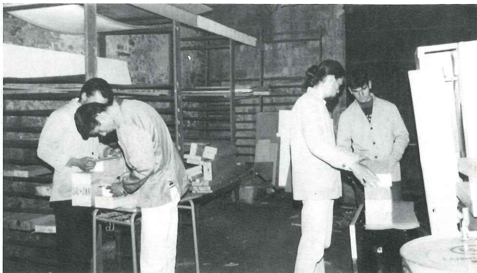
El mòdul de fusteria està a cal Botafoc