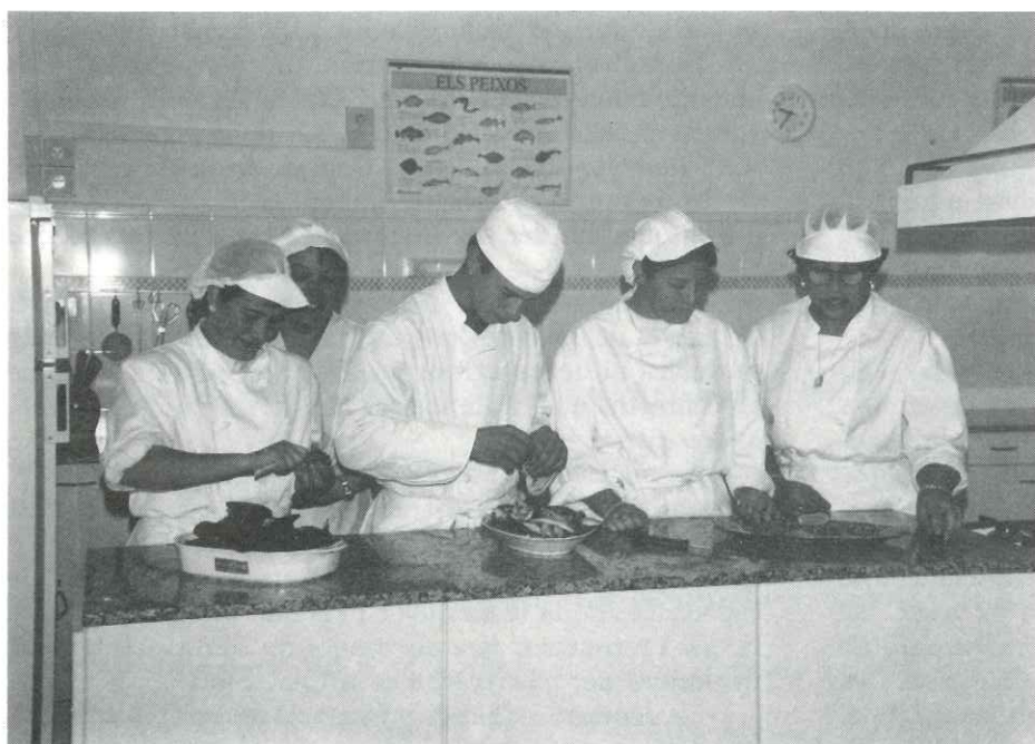
Als safarejos de la Baixada Palau es fa el Pre-taller de Cuina

Es fa també un seguiment coordinat amb els centres educatius. El curs va començar a finals d'octubre i les places estan exhaurides.