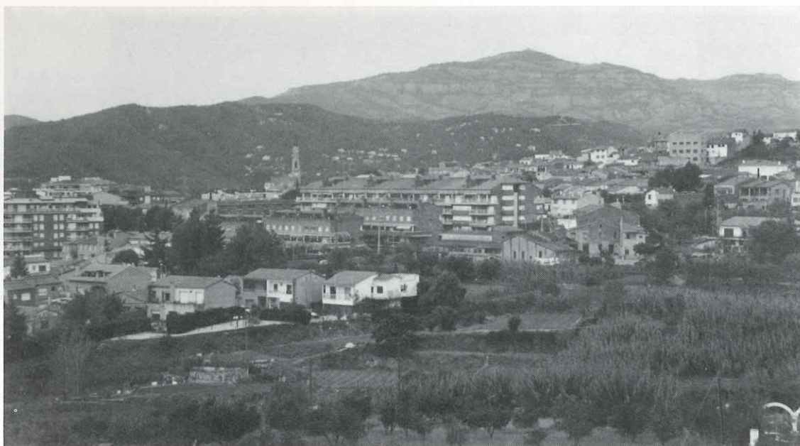
El creixement de Castellà ha de ser racional i equilibrat

teres comarcals, les quals crearien importants impactes paisatgístics, i milloraran la seguretat viària i la protecció civil en cas de catàstrofe.»