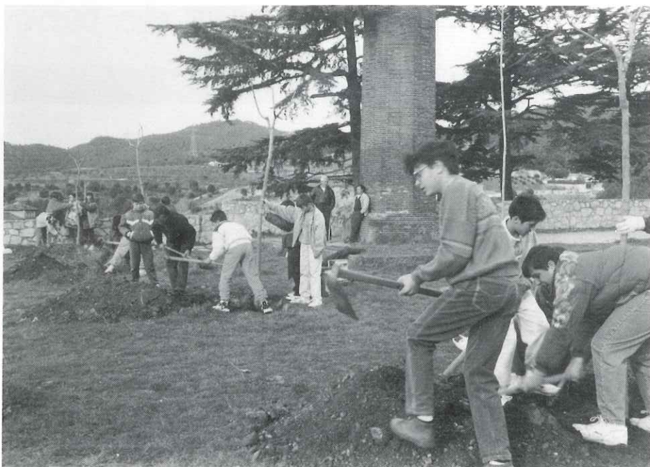
Festa de l'arbre corresponent a l'any passat

— Barri de can Serrador, on hi ha la zona del camp de futbol, i el torrent de Puigverd, situat al marge de la ronda de Llevant des del carrer Catalunya fins al camí d'entrada a Puigverd. S'hi pretén ajudar i estimular la recuperació boscosa natural de la seva ribera dreta en un tram que