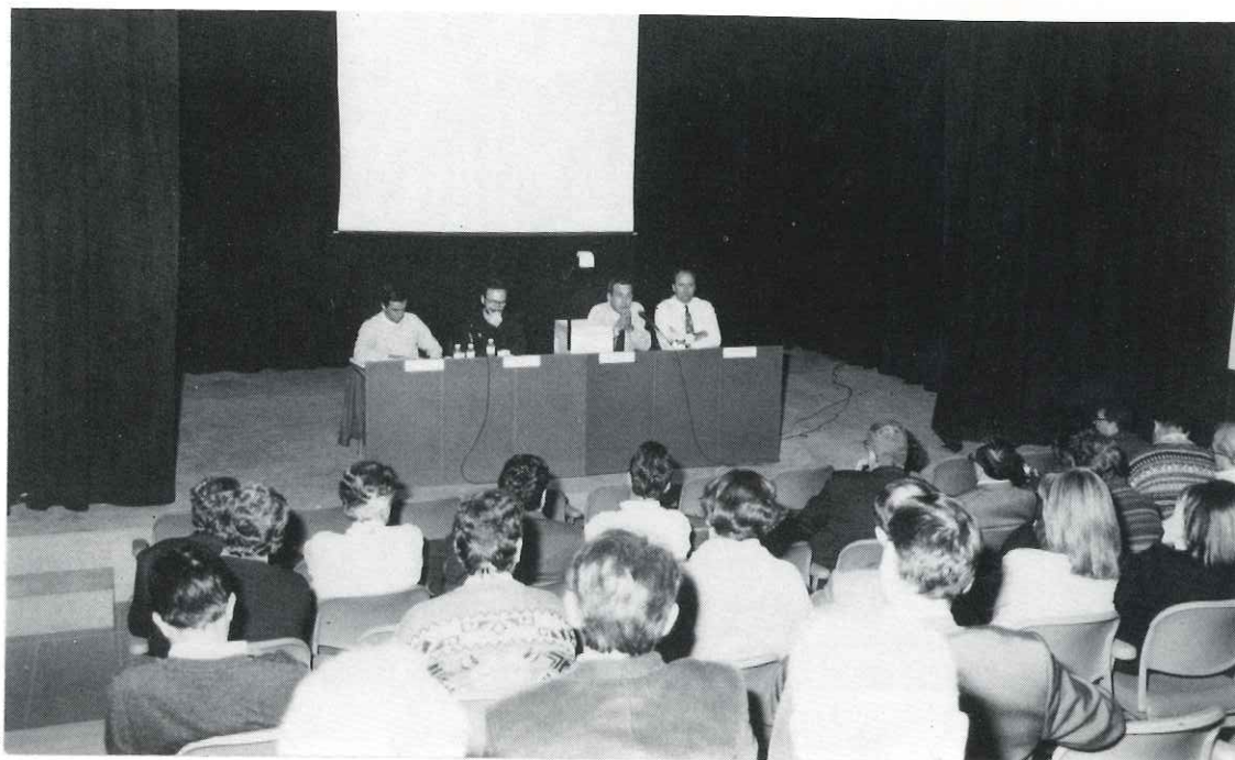
Les sessions del Debat 2000 d'urbanisme s'han fet a l'Ateneu amb una gran assistència de públic

que la futura ampliació del parc prevista per la Diputació de Barcelona també inclogués el nostre terme municipal.