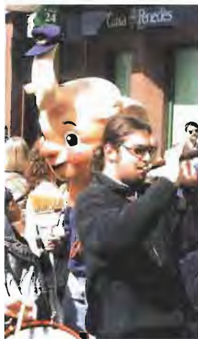
Una imatge del la cercavila d'aniversari que La Xarxa va organitzar del passat 18 d'abril

L'àlbum és com un llibre sobre Castellar però en miniatura.