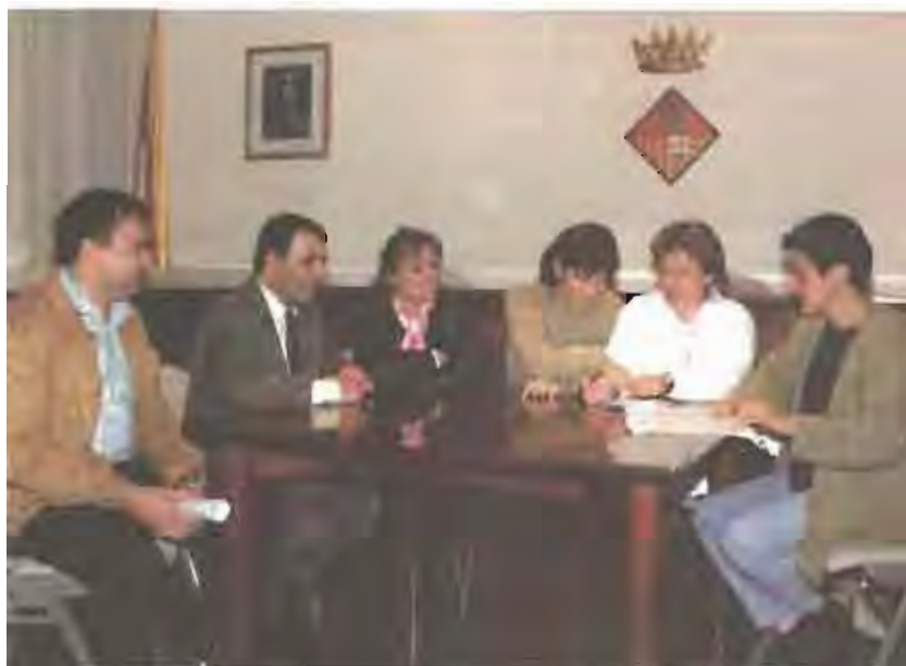
Els representants de les AMPA, en una imatge del darrer Consell Escolar Municipal.

És per això que es fa necessari que els pares i les mares s'informin i participin activament de totes les decisions que afecten a l'educació dels seus fills.