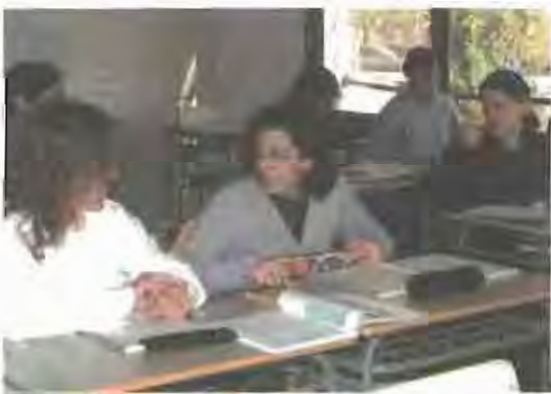
Una classe corresponen al nou cicle formatiu que hi ha a l'IES.

Segons els alumnes, el motiu principal que els ha portat a realitzar aquests estudis és poder tenir més sortides professionals i més facilitats a l'hora de trobar una feina. Els mateixos alumnes manifesten que de moment s'estan complint les expectatives que tenien sobre aquest cicle i que les assignatures que més els agraden són aquelles que tenen una aplicació directa en la realitat laboral, com ara la fiscalitat i la comptabilitat.