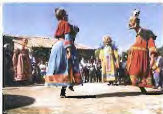
La festa d'acollida va comptar amb la participació dels geganters i grallers de l'Esbart Teatral i dels geganters del Carnaval de Solsona.