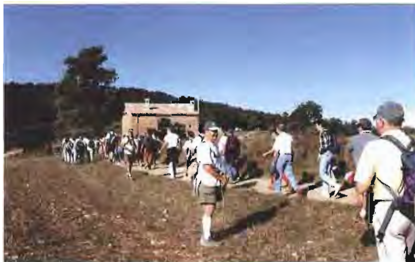
L'Isidre Cabedo (al centre de la foto) i en Ramon Falcó són els dos principals organitzadors de les caminades d'agermanament amb els altres «Castellars».

Més de 100 persones van participar a la 3a travessa d'agermanament entre Castellar del Riu i Castellar de la Ribera.