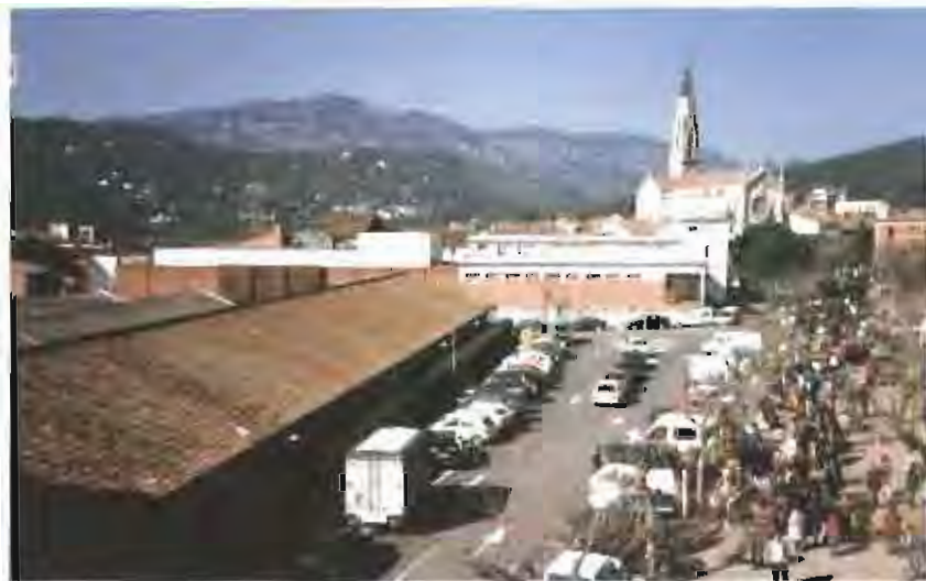
L'àrea d'estacionament del costat de la Nau i un tram del carrer Torras es convertirà en zona blava a partir del proper mes de desembre.

El consistori municipal va aprovar el passat dimarts, dia 2 de novembre, les ordenances fiscals per a l'any vinent, que a grans trets suposarà una pujada generalitzada dels impostos locals d'un 2 per cent. Aquest percentatge es troba per sota de la previsió d'increment de l'Índex de Preus al Consum (IPC). Entre altres novetats, les noves ordenances preveuen la creació d'una taxa de parquímetre a la zona d'estacionament del mercat municipal.