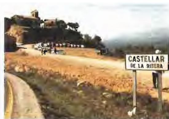
Castellar de la Ribera és un petit municipi situat al costat de Solsona i que té una població de 150 habitants.

El cercle d'agermanaments es tancarà amb una travessa que unirà en tres etapes els 130 quilòmetres que separen Castellar de la Ribera del nostre poble.