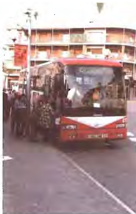
A la pàgina anterior, una nova parada del renovat servei autobusos. En aquesta pàgina, dos dels vehicles que cobreixen els recorreguts.

El cost anual del servei d'autobusos s'incrementarà fins als 15 milions de pessetes. D'aquests, es preveu que només se'n recuperaran tres milions en concepte de venda de tiquets. En conseqüència, l'esforç inicial de l'Ajuntament es concretarà amb una aportació de 6 milions de pessetes, la qual cosa suposa un 50 per cent del dèficit que generarà el nou servei. L'altre 50 per cent serà finançat per la Generalitat de Catalunya.