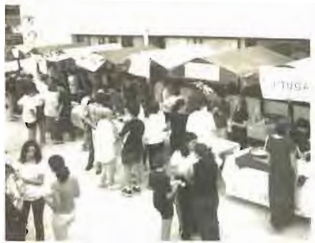
Una imatge de la Gran Festa de les Cultures, que va tenir lloc el passat mes de juny. En aquest curs, el grup solidari ja ha dut noves iniciatives, com ara un col·loqui sobre la pena de mort i la intolerància, que es va fer després d'una de les representacions de l'obra de l'ETC Dotze sense pietat .

El Grup Solidari de l'Institut va sorgir de la necessitat de coordinar les diferents campanyes que s'havien dut a terme anteriorment al centre (campanya d'ajuda a Kòsovo i Cuba). El grup està integrat per representants de diferents cursos i del professorat.