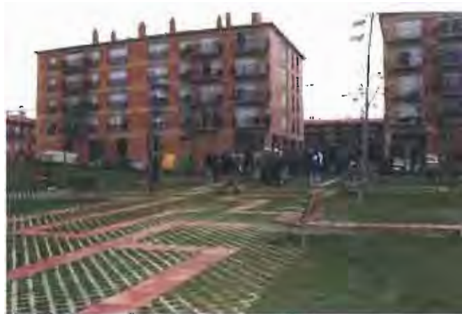
El manteniment d'espais com el del parc de Colobrers passaran a dependre d'una empresa privada.

Castellar disposa en el seu municipi d'uns 360.000 metres quadrats d'espais verds que requereixen tenir-ne cura.