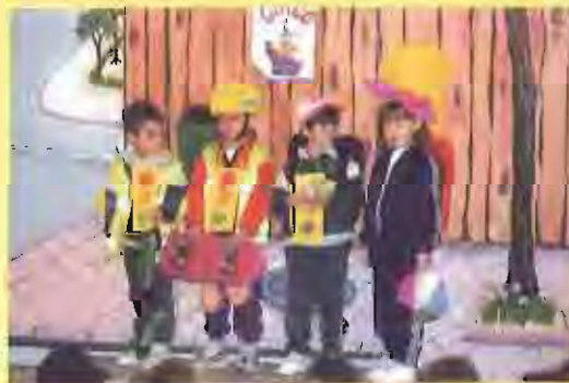
A dalt, una instantània de la darrera edició dels Jocs Florals. Al mig, alumnes mirant-se les làmines de Castellar editades per l'Editorial Mediterrània. A baix, una obra teatral sobre seguretat viària.