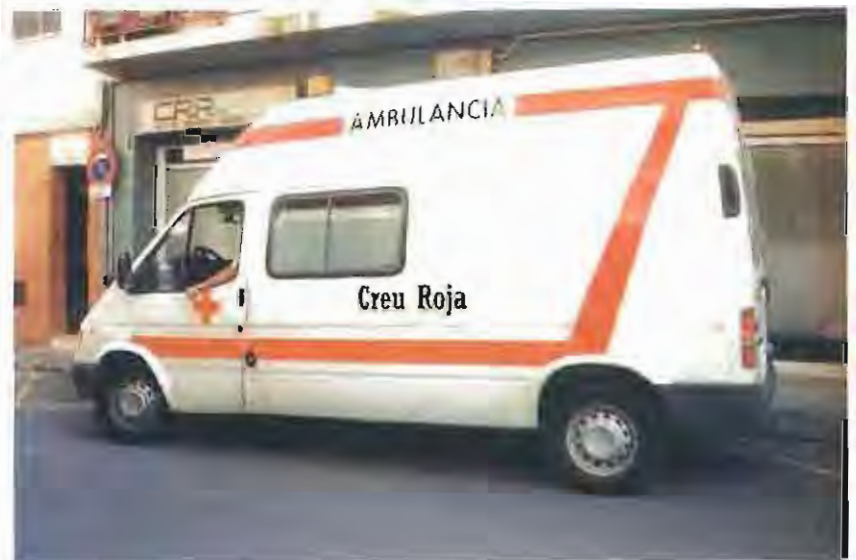
La nova base disposarà de tres ambulàncies que donaran assistència 24 hores al dia.

Castellar satisfarà la tardor vinent una de les demandes que des de fa temps reclama amb més urgència la seva ciutadania. I és que a partir de l'1 d'octubre, la vila disposarà d'una seu pròpia de transport sanitari, amb una dotació de tres ambulàncies que cobriran les 24 hores del dia el trasllat de malalts i accidentats. La nova base del servei d'ambulàncies estarà situada al carrer de les Fàbregues i serà gestionada per la unió temporal d'empreses (UTE) formada per Ambulàncies Pedraforca, Ambulàncies de Terrassa i Serveis de Transports Sanitaris SL. La mateixa UTE, que des de la nostra vila també donarà servei a Sant Llorenç Savall, completarà a més l'àrea d'influència que fins ara cobria la Creu Roja obrint una altra base, a Sentmenat que també tindrà tres ambulàncies fixes.