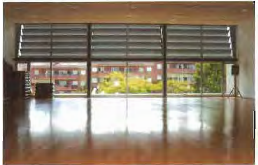
La planta primera del nou equipament disposa d'una sala apta per al fitness i l'aeròbic.

La sala de musculació disposa ara d'uns 230 m 2 , pels 100 m 2 de l'antic equipament. Per la seva banda, la sala de fitness ha eliminat les columnes i les canonades d'aire, que entorpien la pràctica esportiva.