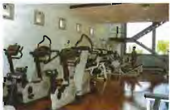
A dalt, vista general del nou solàrium de la piscina descoberta. A baix, dues fotos de la planta baixa del gimnàs, que mostren la dotació d'aparells disponibles.