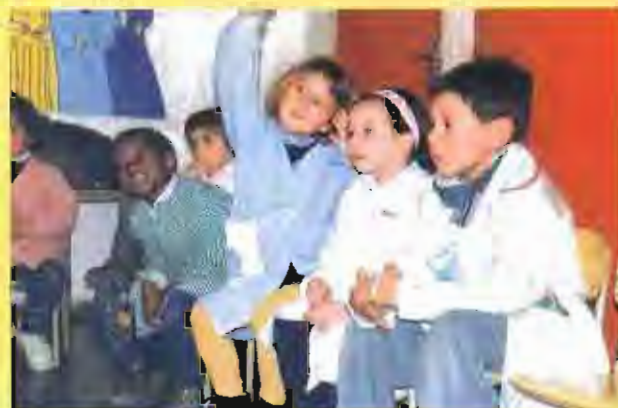
Els més menuts també han pres part activa del projecte.

Quina ciutat volem? El 2000 s'ha iniciat des de la Regidoria d'Ensenyament el projecte Castellar i l'escola, una guia didàctica elaborada des de l'àmbit de l'educació. L'objectiu és que els infants puguin conèixer de prop Castellar per decidir i participar en el model de ciutat que volen en els pròxims anys.