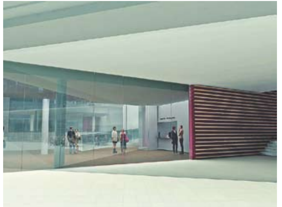
Imatge virtual del nou vestíbul de l'Auditori.

Serà el tret de sortida a la segona etapa de la història de l'equipament, que vindrà marcada per la seva integració a El Mirador.