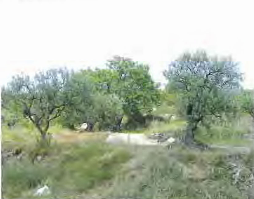
Plaça de les Oliveres de l'Airesol C.

A banda de la remodelació de voreres, en les properes setmanes també es posarà en marxa una nova campanya de pavimentacions, que afectarà el nucli urbà, Sant Feliu, i les urbanitzacions del Racó i el Balcó, on es construiran cunetes i una feixa interceptora al Passatge de Coll Monier. A més, ja s'ha iniciat l'arranjament de la plaça de les Oliveres, a l'Airesol C. Resta pendent, també, la remodelació de vials als carrers del Centre, de la Mina i Sant Pau. A més, s'habilitarà un pas de vianants elevat a la Ctra. de Sentmenat, davant del Passeig de la Plaça Major.