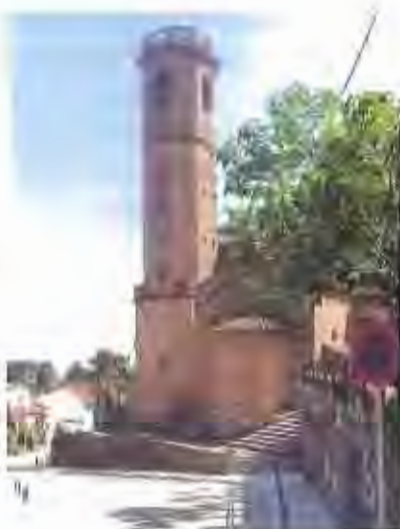
La depuradora d'efluents residuals del Pla de la Bruguera i el complex de l'església de St. Felip.