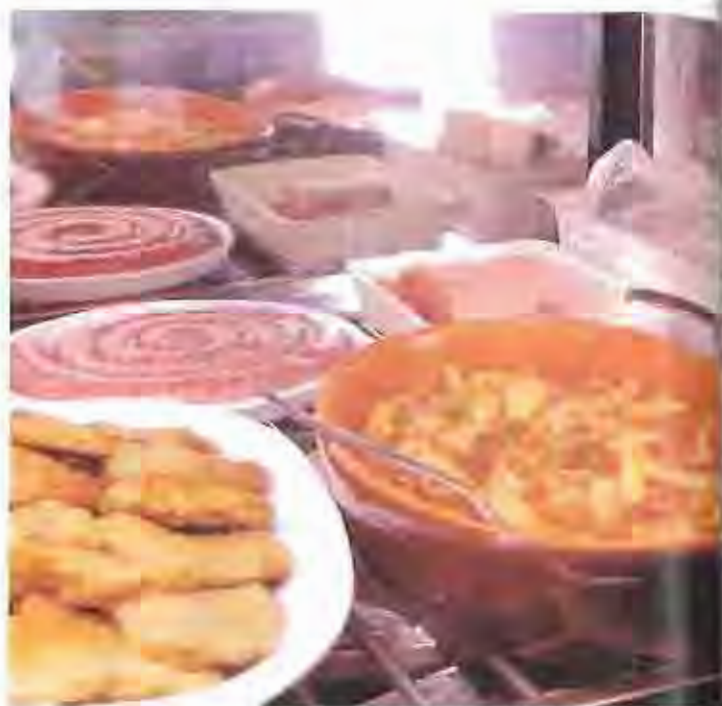
El 90 per cent dels establiments mantenen unes condicions idònies.