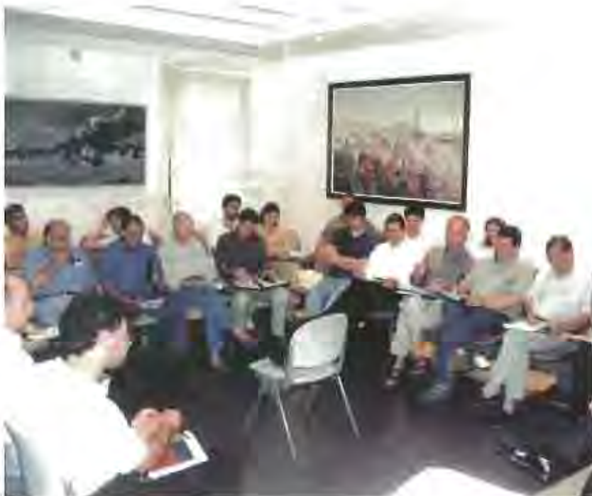
El primer Fòrum Ambiental va coincidir amb el Dia Mundial del Medi Ambient. A la dreta, matges de la preséquia i la taronjada per l'Espai Aeronatural de Llevant.

L'Ajuntament ha actuat de moment com a motor impulsor del Fòrum. L'objectiu final és, però, que en un futur aquest organisme pugui ser liderat per