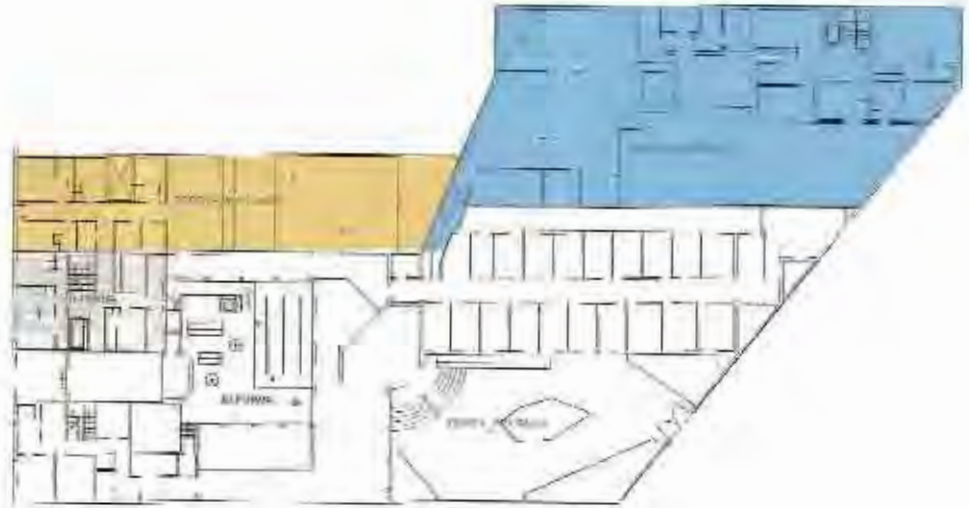
Plànol de l'equipament de l'OSB, incloent la superfície d'ampliació

L'Obra Social Benèfica (OSB) ha iniciat les primeres passes per a l'ampliació del servei de residència, un projecte que la mateixa entitat ja va anunciar l'any 1999 amb motiu de la inauguració de les noves dependències del centre de dia i dels habitatges tutelats. Gràcies a la recent adquisició d'un immoble situat al carrer de l'Hospital, l'OSB té el propòsit de crear en el termini més curt possible 27 places noves del servei de residència assistida.