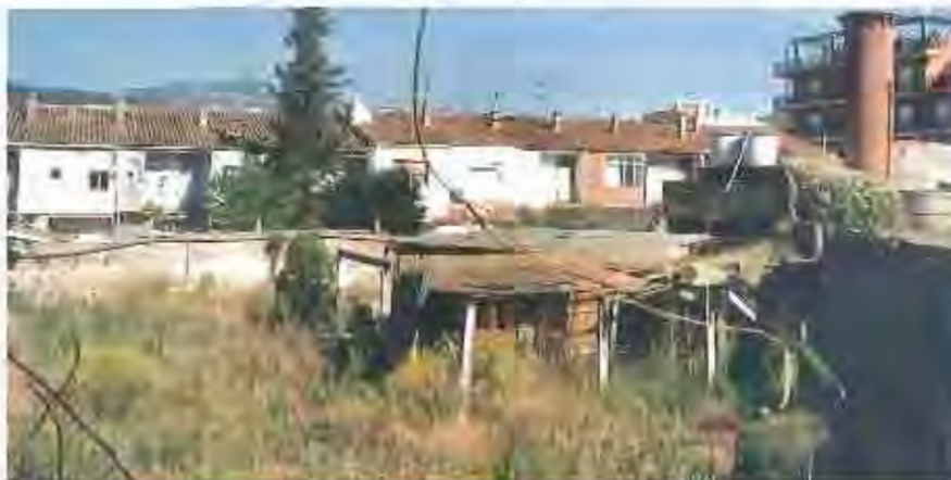
Vista dels horts de l'Àlemany, espai que pretén a tenir un doble ús públic i privat.