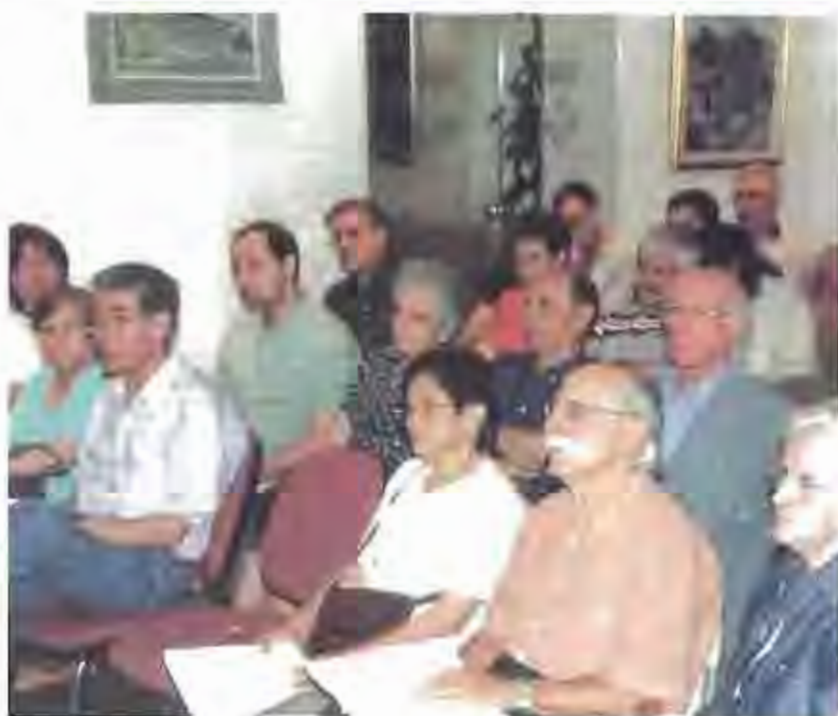
La ciutadania també hi té molt a dir en el procés de reforma i ampliació de la plaça Major.

Perquè fa a la munió destinada a les entitats, el tema central de debat va ser la possible mobilitat de la seu del Centre Excursionista de Castellà. Una decisió que, per la