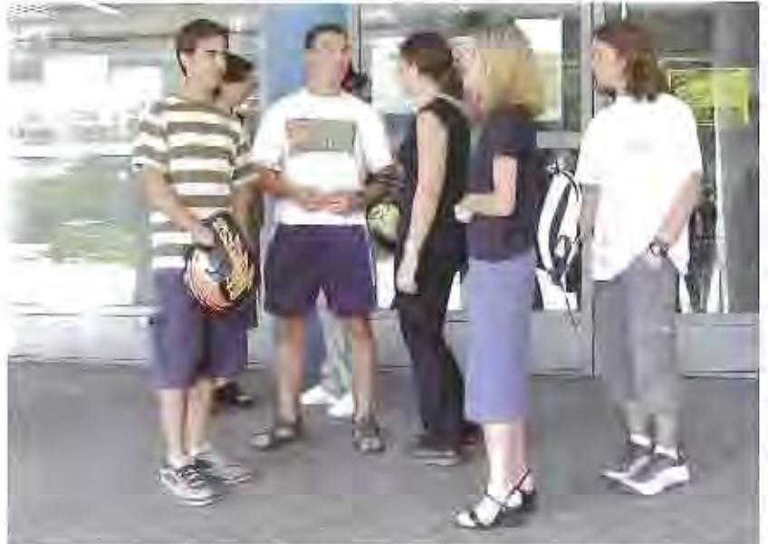
El curs 2004-2005, els alumnes de secundària de Castellar es podrien distribuir en dos centres.