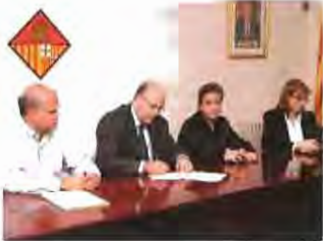
L'alcalde i els regidors s'ajunten amb l'equip de treballadors al consistori municipal de la Plaça de l'Arc Torquet.

Ael que fa als seus usos arquitectònics essencials, el nou equipament presenta