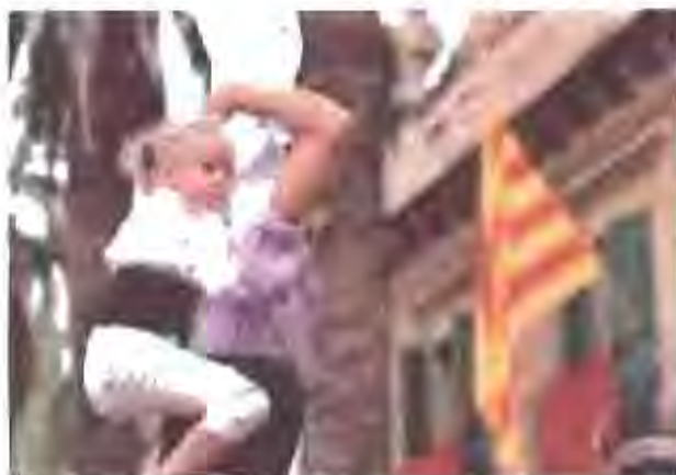
1r premi Fotografia