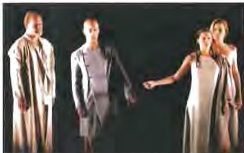
Teatre i dansa en un espai de teatre música - dansa a Castellà

Una programació que dona cobuda tant a grups professionals, com a entitats locals i també a nous artistes que tot just comencen, però que volen compartir les seves oficions amb el públic castellà. Aquest és una de les voluntats de la Mandràgora, una programació nova i diferent, de concerts acústics, que es dirigeix a un públic molt concret però amb un punt en comú: que tingui una actitud positiva davant les propostes noves. Amb tot això, i amb teatre, música, dansa i contes s'ha engegat un any més, l'oferta cultural de Castellà.