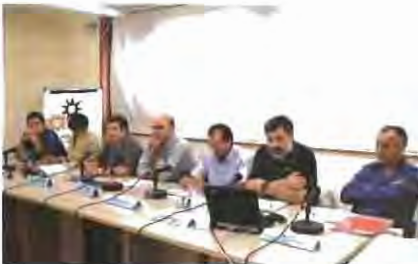
Participants a la jornada de debat prèvia a la primera de comunicacions del Pla Estratègic.

La 1a Comissió va anar precedida d'una jornada de debat amb la participació de representants de l'ATM, la Fundació Bosch i Cardellach, l'ADENC i Sarbus.