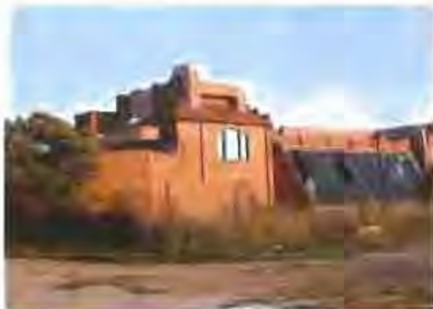
Can Turequet amb el seu aspecte general. La imatge és del 2010 i la foto superior és del 2017.