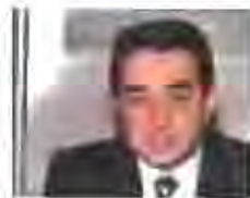
Manuel Rosta Alcalde de Sabadell