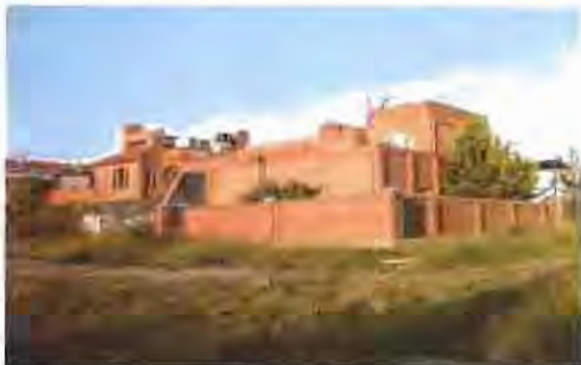
Conjuntament amb l'edifici Teja. Can Turuguet mantindrà un nou espai d'ocupació social del municipi.

L'Ajuntament de Castellor del Vallès ha arribat a un acord per adquirir la finca privada de Can Turuguet, de prop de 7.000 metres quadrats. El conjunt d'edificacions que conformaran aquest nou equipament municipal inclou l'habitatge i la nau de l'antiga indústria de teixits de vellut que va ser propietat de la família Turuguet.