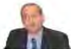
Xavier Casas Regidor d'Urbanisme de l'Ajuntament de Barcelona