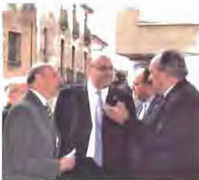
Família de Ca l'Alberola amb el conseller i el secretari general de Justícia, a l'acte d'inauguració del nou Jutjat de Pau. Acompanyats pel alcalde i altres autoritats locals i de l'àmbit de la Justícia.