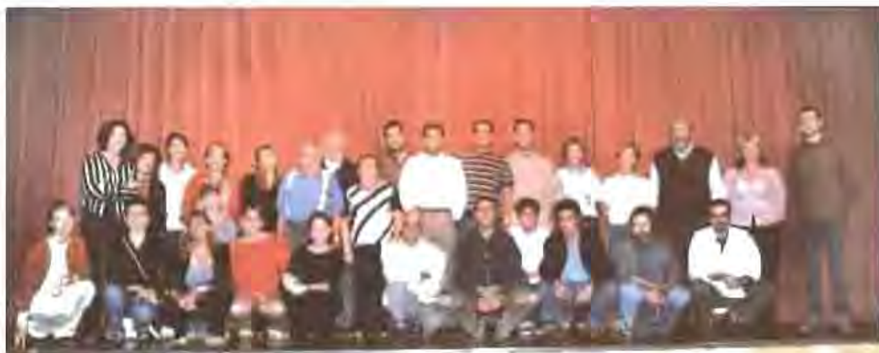
Equip de professionals i col·laboradors de la temporada 2002-2003

Ràdio Castellar va presentar el 7 d'octubre passat la seva nova programació de la temporada 2002-2003 per primera vegada en format vídeo-clip. La nova temporada presenta moltes novetats que es basen en una important ampliació de l'oferta d'informació esportiva i d'espais per als més joves.