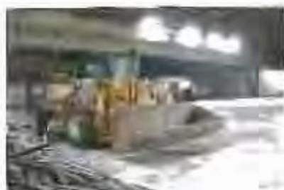
Estat actual de les obres a la nau d'Oficis Artesans (arquitecte: Jordi A. Puig-Agent)

Les obres al sector de la fàbrica nova de la Tola ja s'han iniciat. En una primera fase del projecte, s'està rehabilitant la nau municipal d'uns 600 metres quadrats des de finals de juliol, per tal que compleixi diversos usos socials, lúdics i culturals.